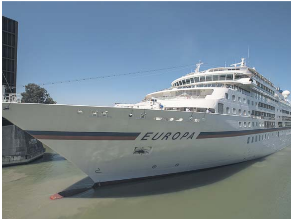
Un crucero saliendo del puerto de Sevilla tras estar atracado unos días en la ciudad.

El gasto medio diario que realizan en su destino estos cruceristas asciende a 40,6 euros. Casi ocho de cada diez cruceristas afirman que la principal actividad en la que gastan su dinero es la gastro-