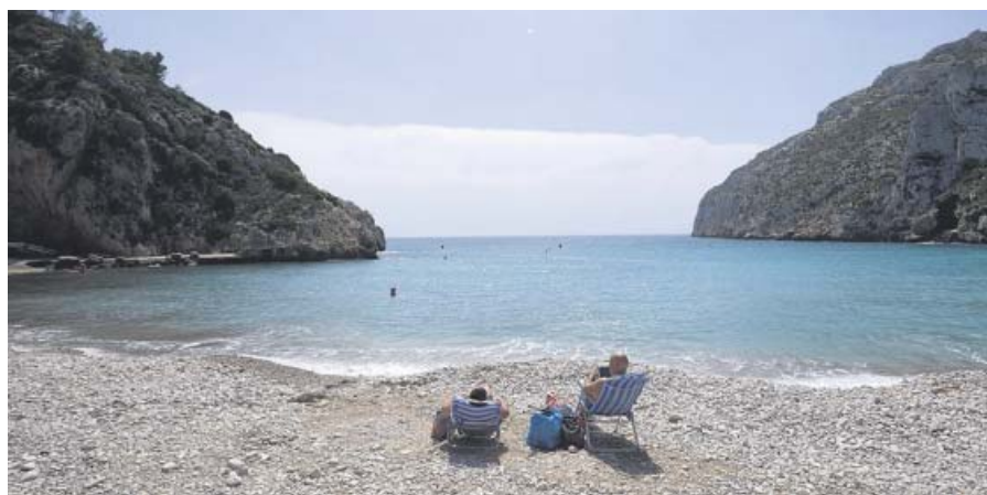
Playa de la Granadella, en Jávea (Alicante).