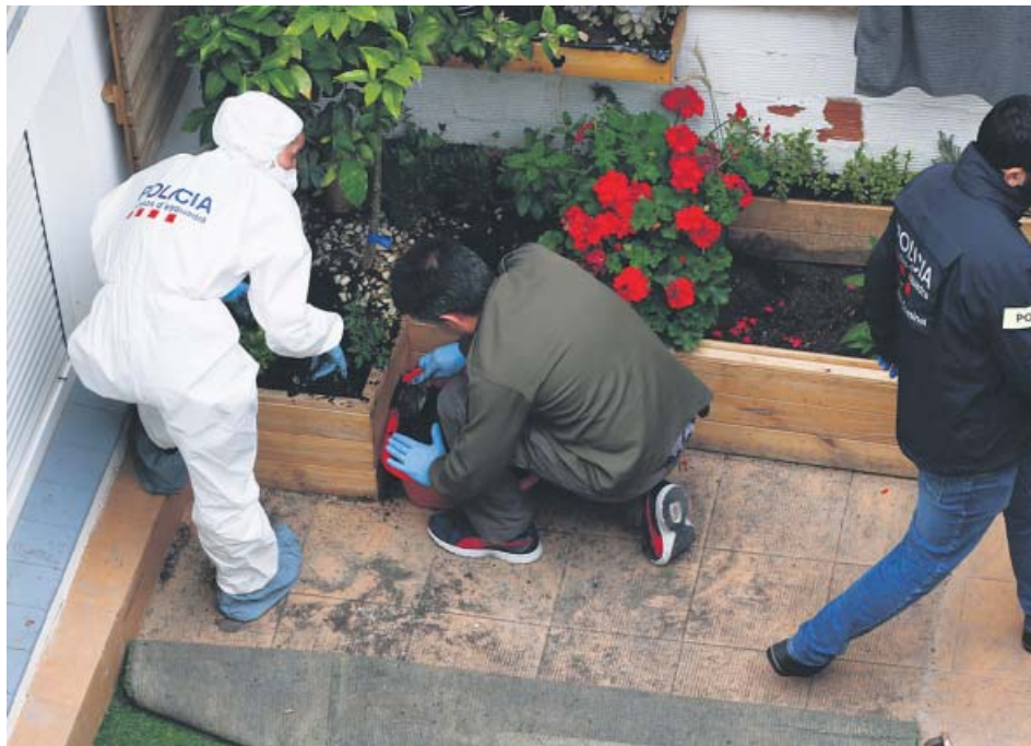
Los Mossos registraron ayer el domicilio de uno de los arrestados.