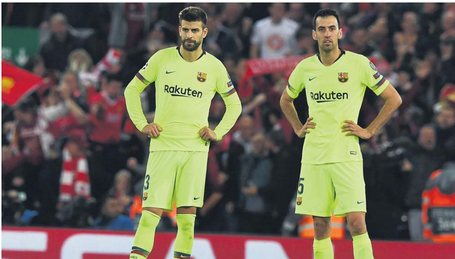
Sergio Busquets y Gerard Piqué se lamentan tras uno de los goles del Liverpool en Anfield.