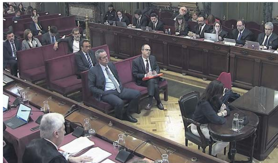
Una votante del 1-O declara ante el Supremo. Detrás, los acusados escuchan su relato.

Otro testigo aseguró que en un colegio de Manresa los policías «se llevaron a niños y gente mayor a otro lado para que no vieran cómo pegaban a sus familiares»; y una vecina de Dosrius (Barcelona) contó que le dieron «un meneo» y la tiraron al suelo. «Rompí a llorar histérica», enfatizó. Además, un votante de Girona explicó que los bomberos intentaron defender a la ciudadanía y también fueron agredidos: