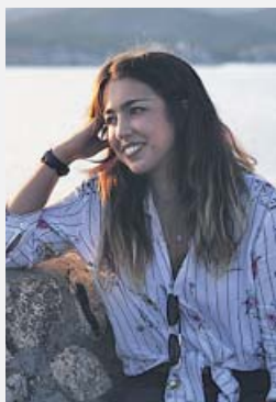
INSTAGRAM/NATALIA SÁNCHEZ URIBE