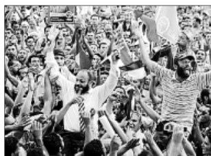
Mubarak entró en camilla a su juicio el 7 de septiembre (arriba) y el 2 de junio (izda.). Protestas contra la Junta Militar en El Cairo (dcha.).