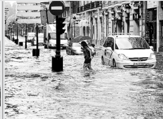
INUNDACIONES EN ALBACETE. Una tormenta de lluvia, granizo y viento provocó ayer fuertes inundaciones en las calles y los garajes del centro de Albacete.

Y muchas más, en las fotogalerías de 20minutos.es