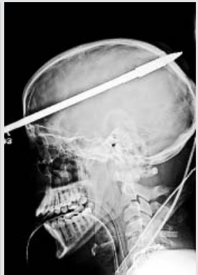
RECUPERÁNDOSE. Iba de pesca y se clavó un arpón. Es un joven de 16 años de EE UU.