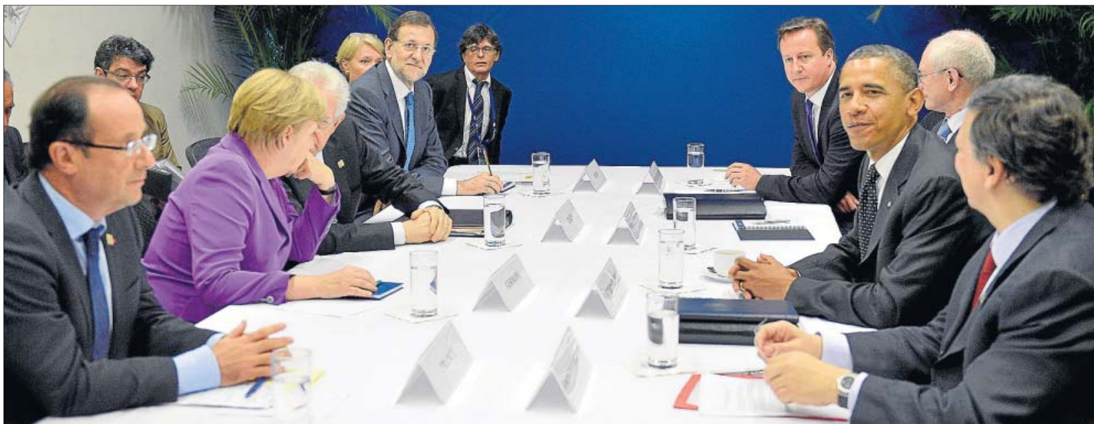
REUNIÓN EE UU-UE. Rajoy (al fondo) durante la reunión celebrada ayer entre la Eurozona y EE UU en la cumbre del G-20. Al encuentro también asistieron el presidente francés, François Hollande; la canciller alemana, Angela Merkel; el primer ministro italiano, Mario Monti; el primer ministro británico, David Cameron; y el presidente de EE UU, Obama.