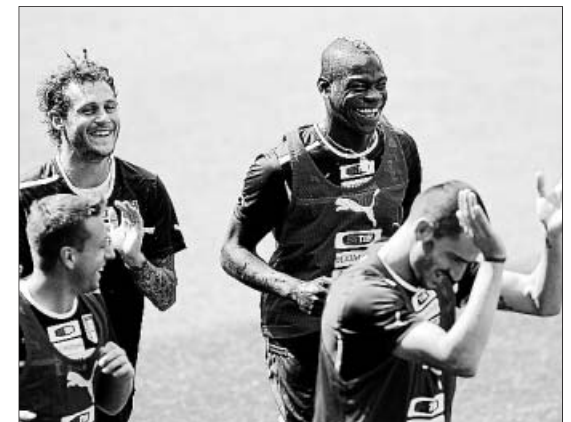
Bonucci (dcha.) aplaude a Balotelli (detrás de él).