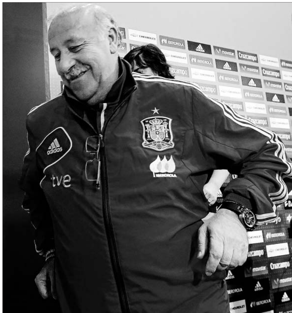
Vicente Del Bosque se marcha sonriente tras la rueda de prensa de ayer en Gniewino (Polonia).

Xavi. La temporada ha sido larga y exigente y a algunos, como a Xavi, se les nota y, por contagio, a la selección.