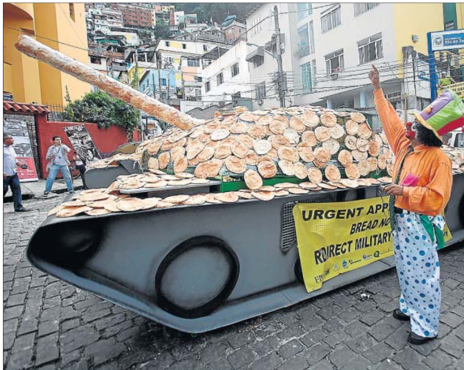
Un tanque de guerra cubierto con pan, para exigir menos gasto en armamento y más en pan, en Río de Janeiro.