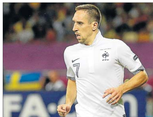
Ribery es uno de los futbolistas fundamentales en Francia.

La última vez fue en los octavos de final del Mundial de Alemania de 2006. Francia venció 1-3 pese a que España empezó ganando gracias a un penalti transformado por Villa. Más lejano queda el último enfrentamiento en una Eurocopa. Fue en el año 2000, en los cuartos de final del torneo continental or-