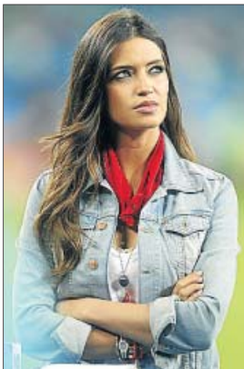
Sara Carbonero en Polonia (arriba, izda. y abajo). A la derecha, la periodista en el Mundial de Sudáfrica.