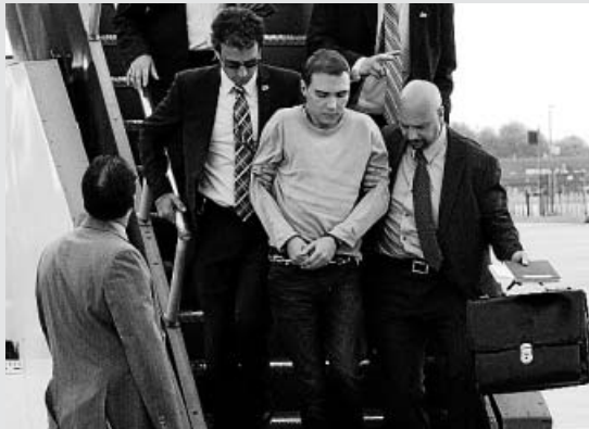
EL 'CANÍBAL DE MONTREAL' LLEGÓ A CANADÁ ayer, tras ser extraditado de Alemania. Se declaró no culpable de matar a su novio y comerse partes de su cuerpo.

Y muchas más, en las fotogalerías de 20minutos.es