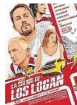
2017. Director: S. Soderbergh Reparto: Channing Tatum, Adam Driver, Daniel Craig, Katie Holmes

Y así comienza el disparate, una aventura ligera repleta de chistes y personajes carismáticos que confía en que el espectador se la tome tan poco en serio como la película se toma a sí misma. Mención especial merece una escena carcelaria que ya es, sin duda, el mejor tributo rea-