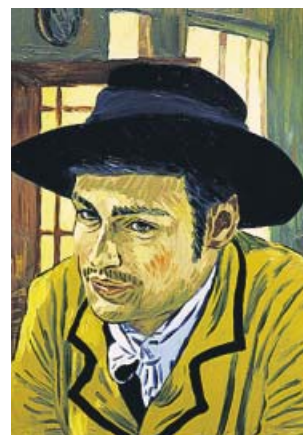
Uno de los 65.000 fotogramas de Loving Vincent , al óleo. KARMA

dros de Van Gogh, en una producción inicialmente rodada con actores, y descubre la enigmática figura del pintor holandés a través de las cartas que es-