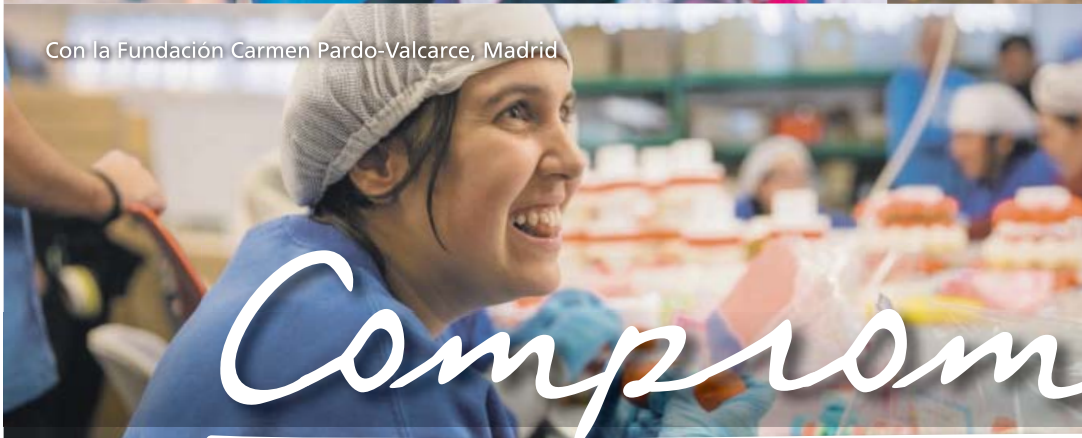
Con la Fundación Carmen Pardo-Valcarce, Madrid