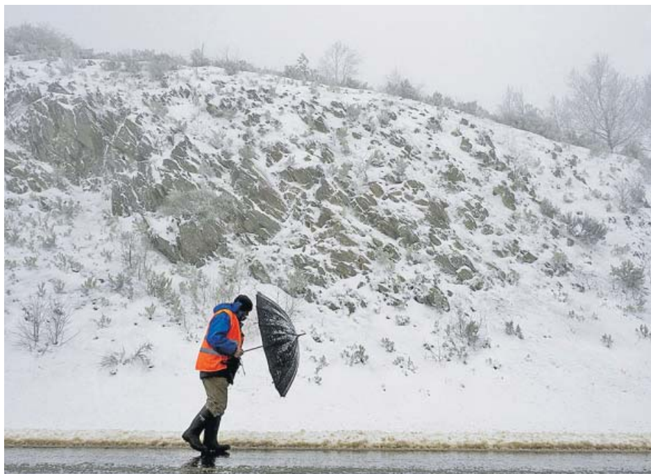
Un hombre intentaba cubrirse frente a la nieve, ayer, en O Cebreiro (Lugo).

Un varón de 22 años fue hallado muerto ayer, sobre las 8.11 horas de la mañana, en un autobús de Guadalajara. Al cierre de esta edición (23.00h) aún se desconocían las causas que pudieron desencadenar su muerte.