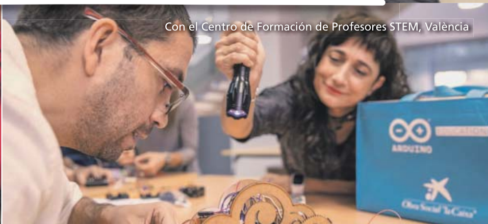
Con el Centro de Formación de Profesores STEM, València