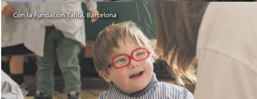
Con la Fundación Talita, Barcelona