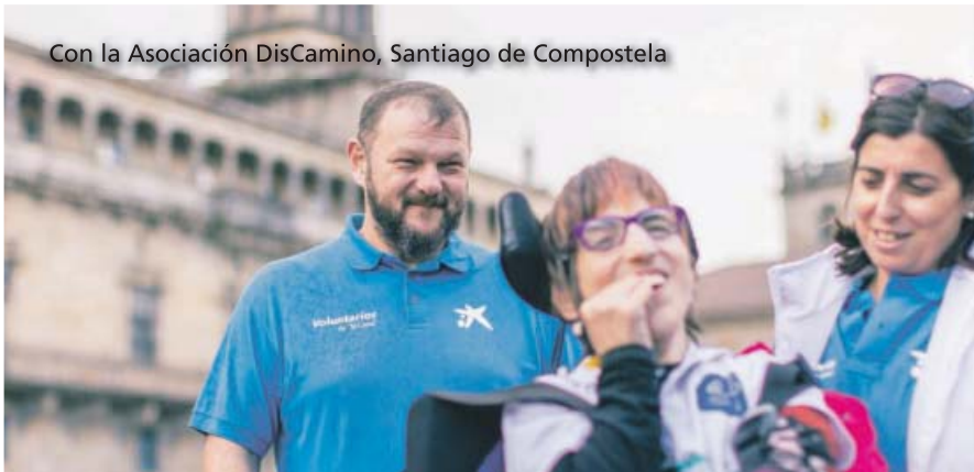
Con la Asociación DisCamino, Santiago de Compostela