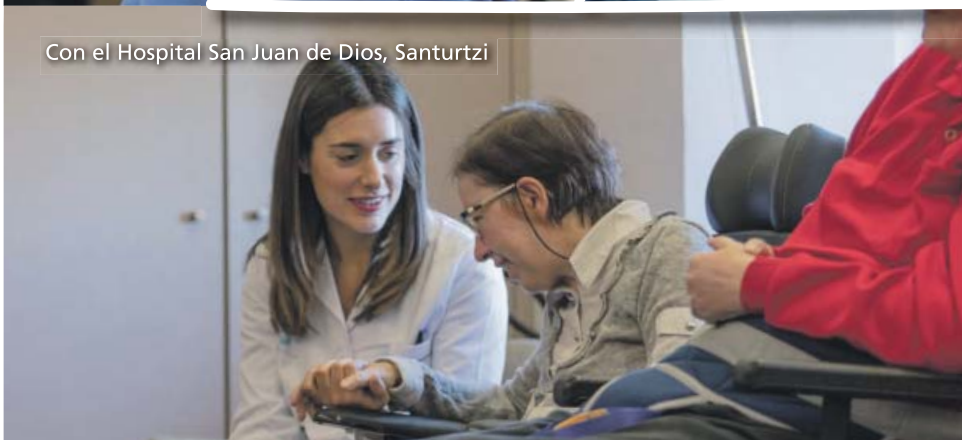
Con el Hospital San Juan de Dios, Santurtzi