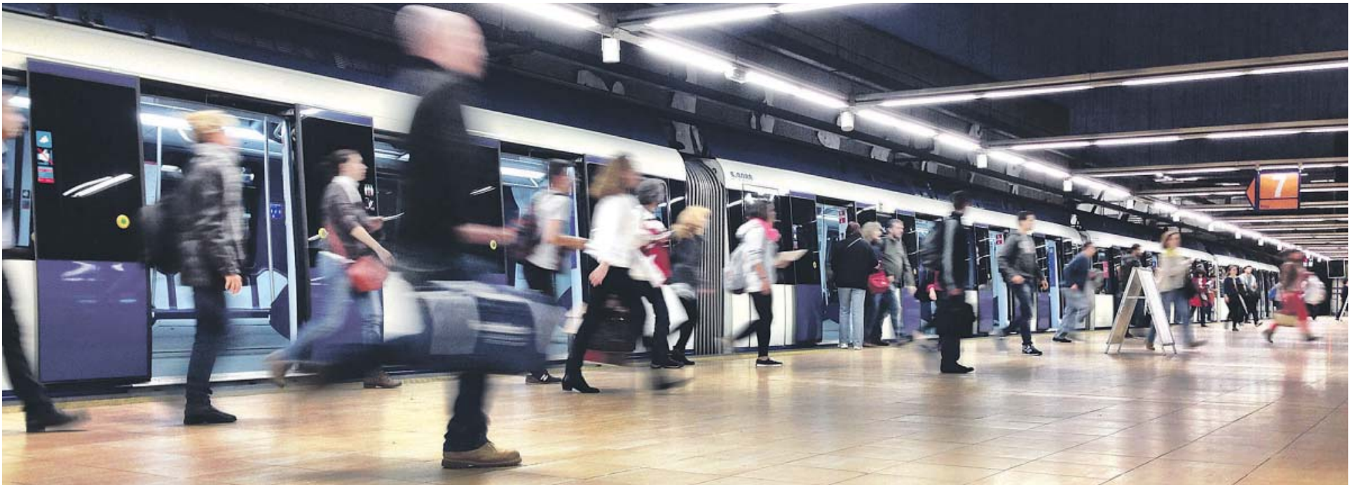
El Metro y otras opciones de transporte público son la elección del 39% de españoles. JORGE PARÍS