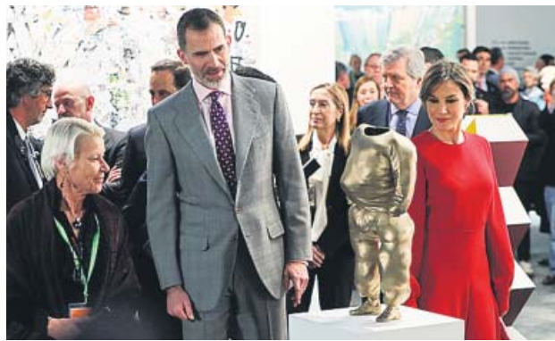
Los Reyes observan la obra He-Hop , de Erwin Wurm.

En la edición del año que viene, Perú será el país invitado de honor, una costumbre que este año se ha sustituido por el futuro como temática de la feria. ● R. C.