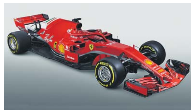
FERRARI Y MERCEDES