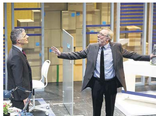
Un momento de la representación.

La obra es un «hechizo de sirenas» que apela, según su director, Antonio C. Guijosa, a esa «llamada del amor que dejamos ir», un texto de Al-