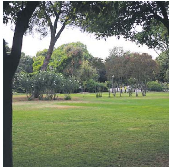
Parque de los Príncipes, en Los Remedios.

Esta nueva fase contempla la reforma del interior del antiguo edificio de aseos, de forma que se habilite uno para hombres, otro para mujeres, otro para personas con movilidad reducida y otro para los trabajadores del parque, a los que se dotará también de un espacio de comedor. Asimismo, se llevarán a cabo tres caminos de albero para un correcto tránsito, que evite la utilización de las praderas.