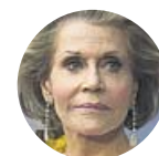
JANE FONDA Actriz

«Creo que 'Cincuenta sombras de Grey' no es un libro muy bueno, pero en EE UU estimuló a muchas mujeres. Eso es bueno»