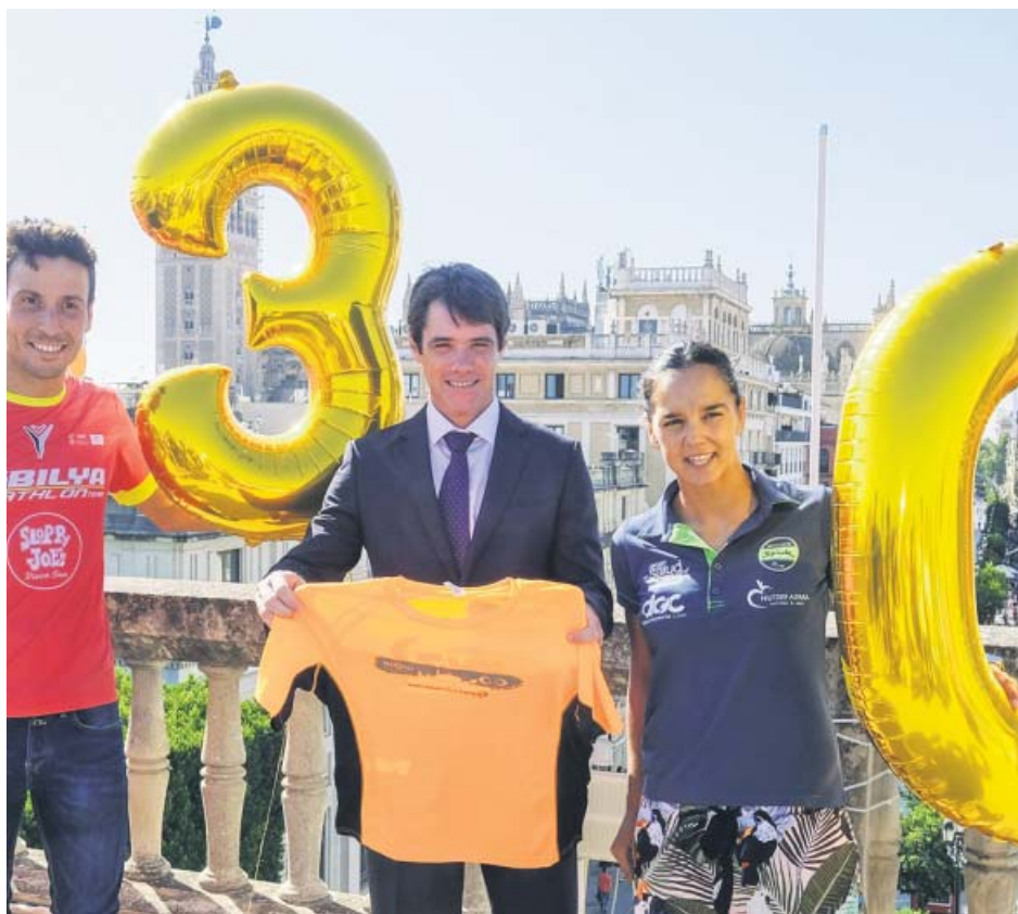
Presentación de la Carrera Nocturna del Guadalquivir, ayer en Sevilla.

El Consejo de Gobierno dio ayer luz verde a la elaboración del III Plan de Acción Integral para las Personas con Discapacidad, así como otro específico dirigido a las mujeres. El colectivo está integrado actualmente por unas 700.000 personas en la comunidad (el 10% de la población total). De ellos, el 61% son mujeres.