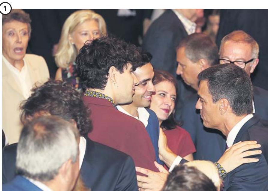
El presidente, con 'los Javis' y Rosa María Mateo

Unos de los invitados que más llamaron la atención fueron los actores y directores de La Llamada o Paquita Salas , Javier Ambrosi y Javier Calvo, conocidos como los Javis. Al fondo de la imagen, la administradora única de RTVE, Rosa María Mateo, no quiso perderse tampoco el acto