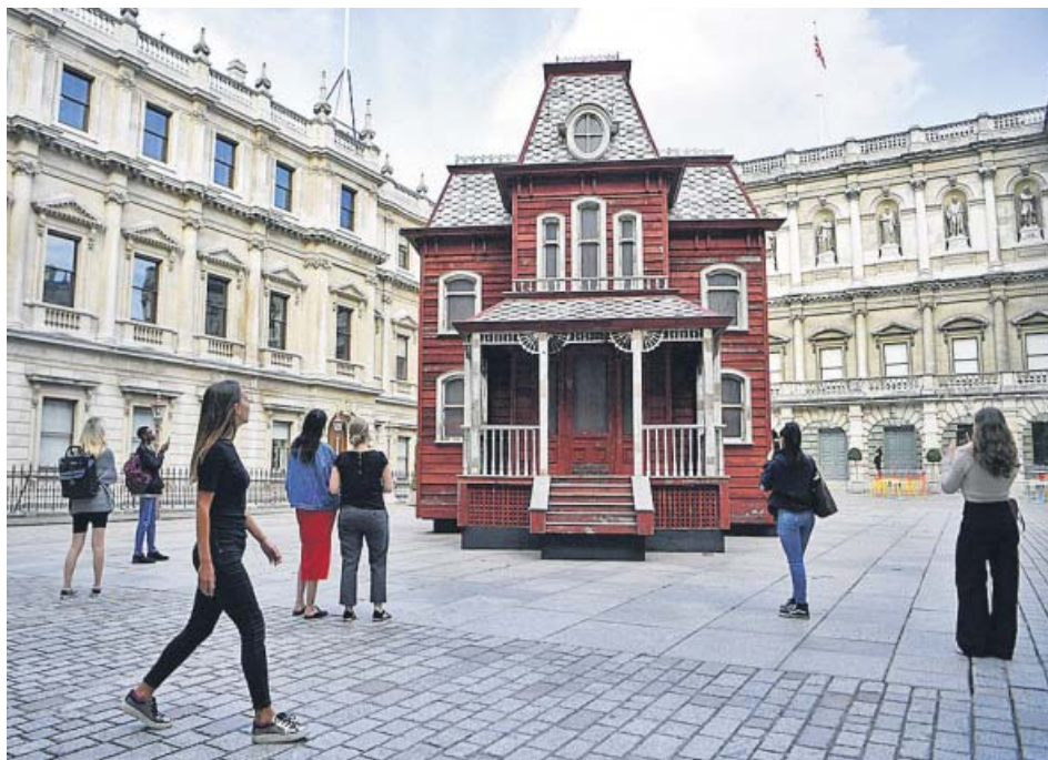
Los peatones observan la reproducción de la casa de la familia de Psicosis , en Londres.

La artista Cornelia Parker ha hecho realidad el sueño de muchos cinéfilos con su última obra: una reproducción de la casa de la famosa familia Bates, protagonista de la película Psicosis (1960), dirigida por Alfred Hitchcock. La réplica está situada delante de la Real Academia de Arte de la ciudad, en Burlington House, (Picadilly, Mayfair), lugar al que se han acercado multitud de seguidores del cineasta y turistas para hacerse una foto. ● R. C.