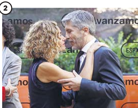
Los ministros, entre besos y Gibraltar

Unos de los invitados que más llamaron la atención fueron los actores y directores de La Llamada o Paquita Salas , Javier Ambrosi y Javier Calvo, conocidos como los Javis. Al fondo de la imagen, la administradora única de RTVE, Rosa María Mateo, no quiso perderse tampoco el acto