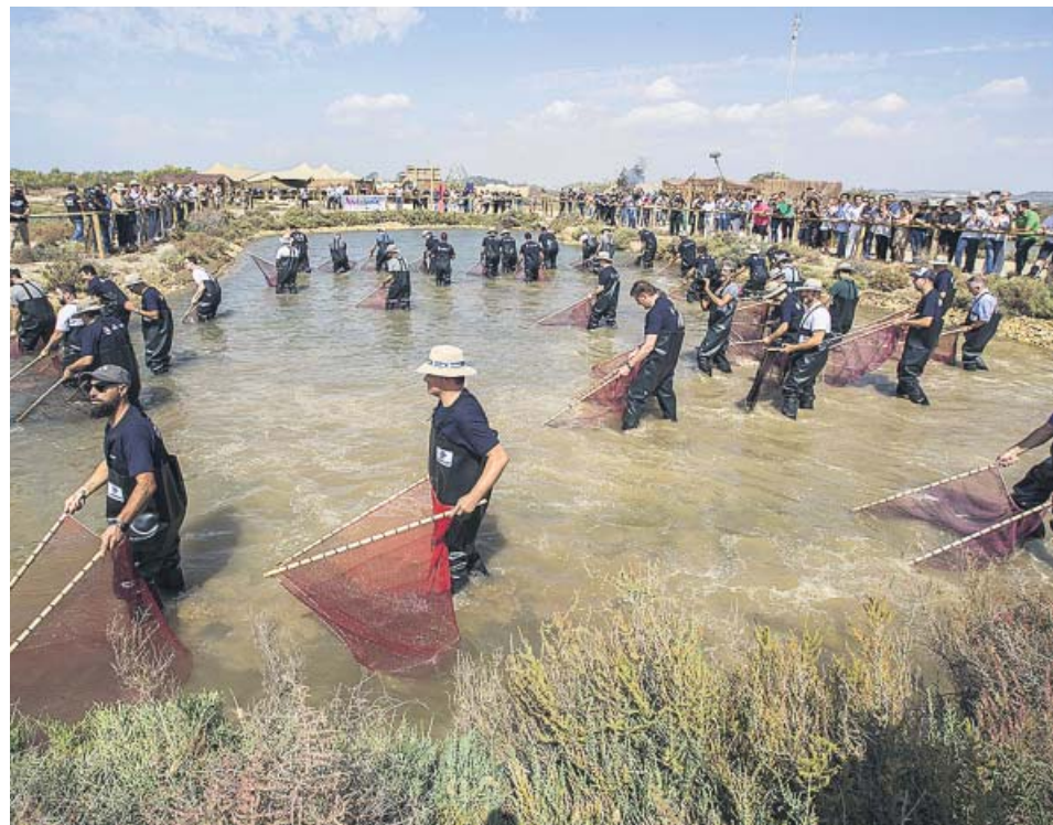
Algunos de los cocineros que ayer participaron en el despesque en Cádiz.

«Hay un proyecto para Andalucía que no pasa ni por mantener el status quo de un PSOE-A cuyo único proyecto es mantener el poder, ni el proyecto de las derechas andaluzas», señaló Maíllo. Rodríguez, por su parte, aseguró que buscarán «alternativas» tras diez años en los que las políticas del PP y del PSOE «han castigado a la mayoría social con recortes y privilegios para una minoría», algo que ha padecido «especialmente Andalucía por las redes clientelares y la corrupción». ● R. A.