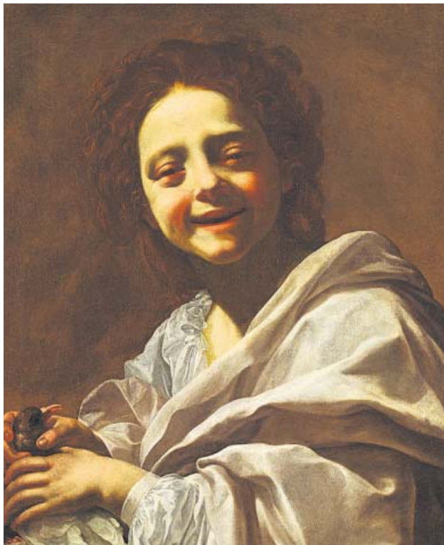
Retrato de niña con paloma, de Simon Vouet. COLECCIÓN PARTICULAR

Con este novedoso 'crowdfunding', la pinacoteca busca adquirir la obra 'Retrato de niña con paloma', de Vouet