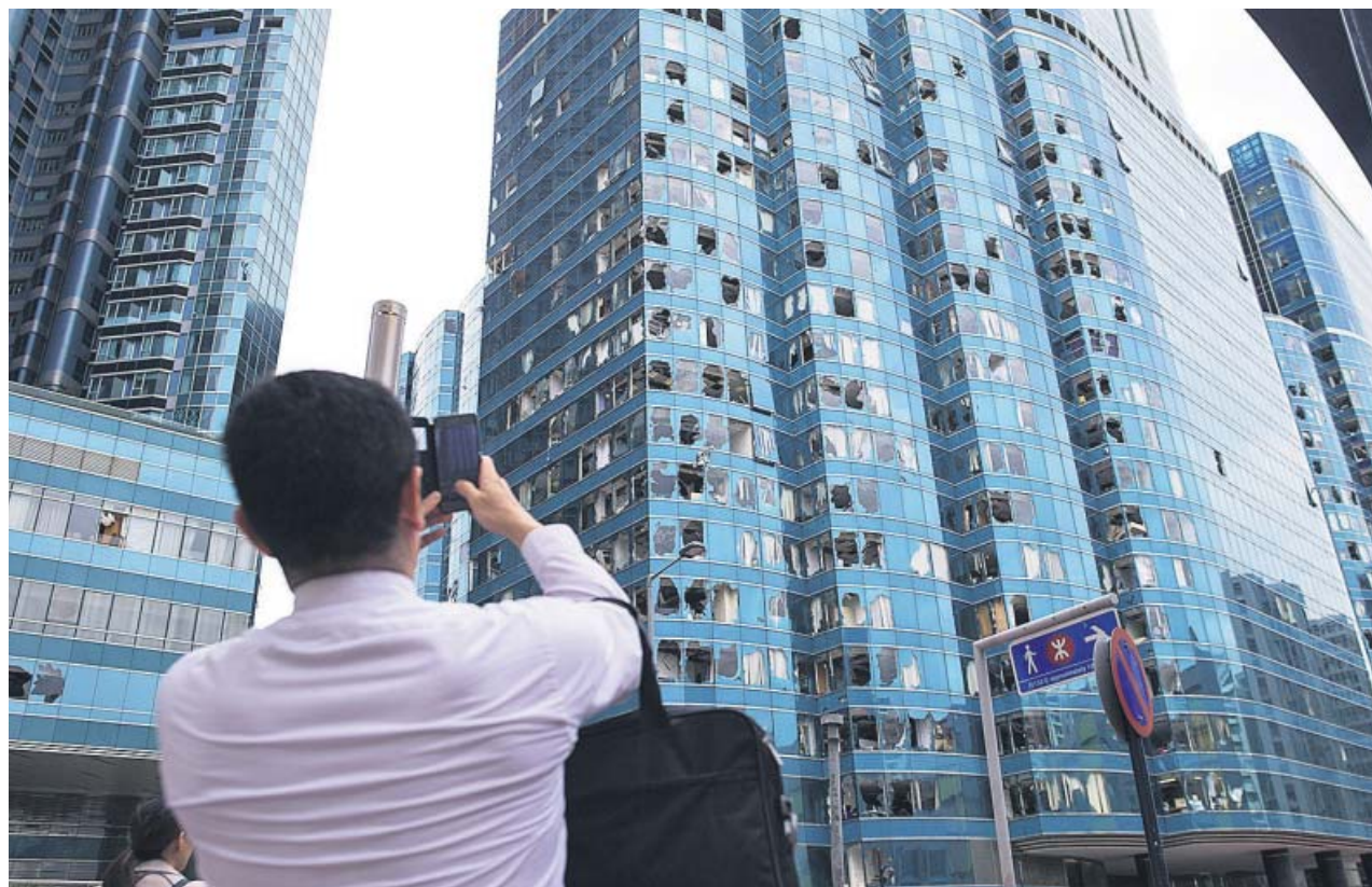
Un hombre fotografía las ventanas dañadas por el paso del tifón Mangkhut en Hong Kong.

vechó un momento que sabía que iba a estar a solas con el niño» y destaca que enterró su cuerpo sin vida en un «hoyo que previamente había hecho con una pala» y luego quiso deshacerse del cadáver en un invernadero, de acuerdo a las escuchas acordadas por el juzgado instructor y cuyo contenido está en una pieza separada. ●