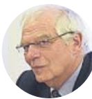
JOSEP BORRELL Ministro de Asuntos Exteriores

«Vamos a utilizar el 'brexit' para obtener las cosas más positivas posibles para nuestra gente en Gibraltar»