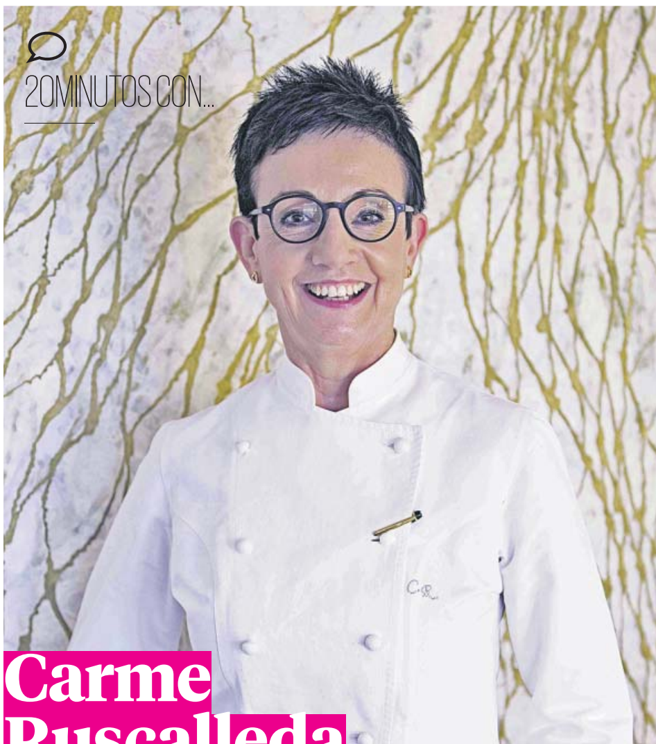
MARIANA HOSTENCH / ACADEMIA CATALANA DE GASTRONOMIA