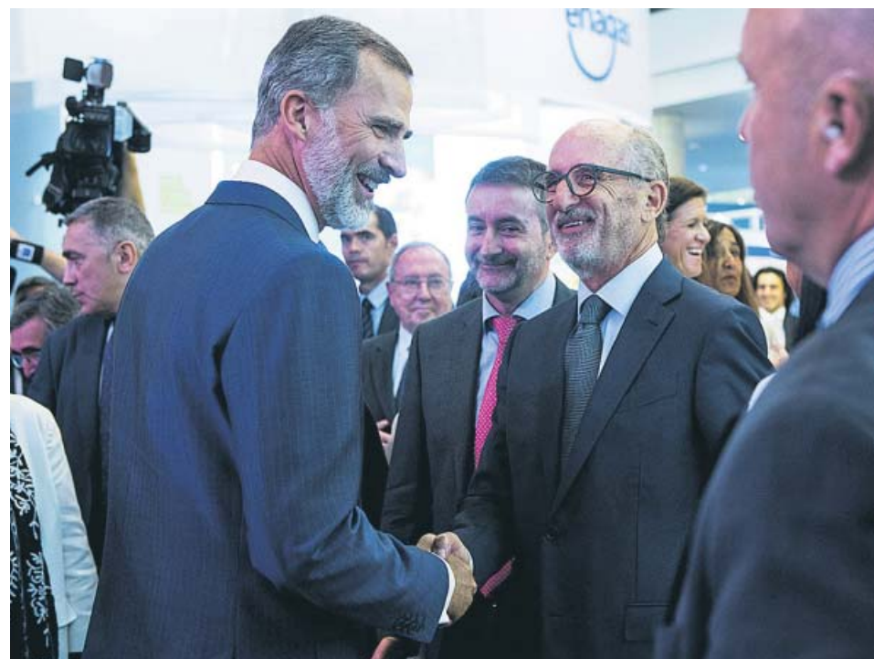
El rey Felipe VI saluda al presidente de Repsol Antoni Brufau (d).

Javier Maroto (PP) advirtió de que en la venta de armas a Arabia Saudí el Gobierno «está rozando el esperpento» al pretender convencer a los españoles de que las bombas «no matan». El presidente de Ciudadanos, Albert Rivera, manifestó que él no hubiera roto el contrato porque esa situación «compromete» a un Estado y a su credibilidad. El líder de Podemos, Pablo Iglesias, avanzó que su formación exigirá al Gobierno paralizar la venta de armas a Arabia Saudí. ●