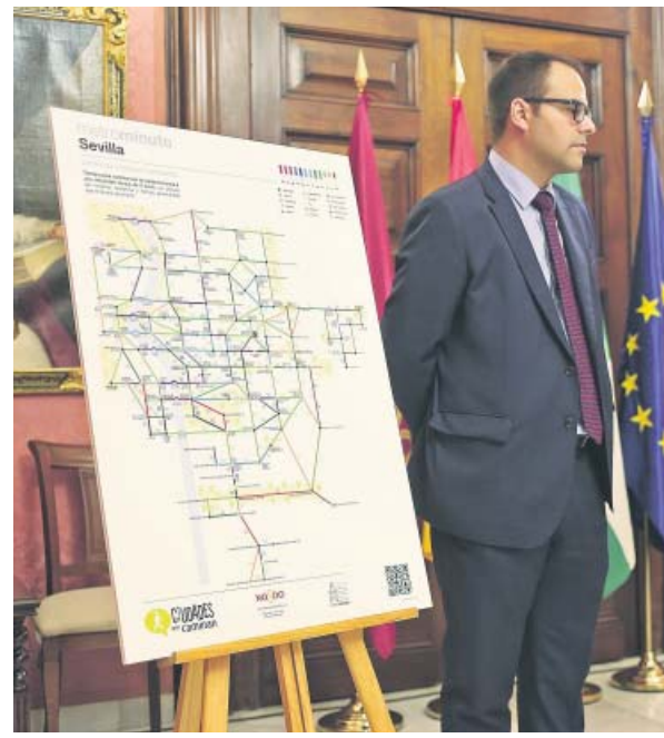
Mapa del proyecto Metrominuto. AYTO. SEVILLA

La primera fase de este proyecto arrancó ayer con la distribución, tanto en formato físico como digital, de un plano de la ciudad con más de 150 puntos, como centros de salud, mercados de abasto, centros comerciales, parques, comisarías, instalaciones deportivas, aparcamientos y estaciones de autobús, Cercanías, metro o tranvía.