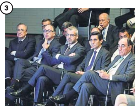
El poder económico se sentó en primera fila

Todos los ministros, salvo las de Transición Energética y Defensa, acudieron a escuchar a Sánchez, antes de su reunión con Borrell y Michel Barnier sobre el brexit y Gibraltar.