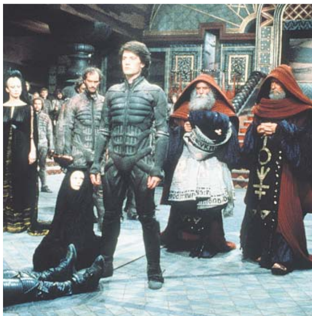
Fotograma de la película Dune, de David Lynch (1984).

Teniendo en cuenta la densidad de la obra y los numerosos fans que ha ido atrayendo, Denis Villeneuve no lo tiene fácil, aunque ha estado a la altura en los dos recientes largometrajes de ciencia ficción que ha dirigido: La llegada y la secuela de Blade Runner ( Blade Runner 2049 ). El rodaje está previsto que empiece en febrero de 2019