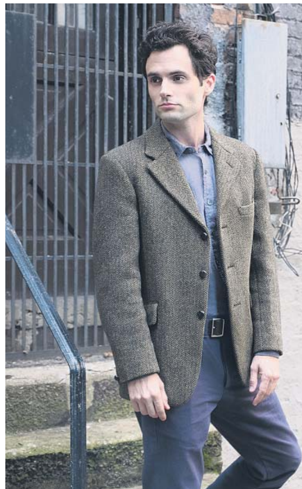
Penn Badgley, de la Reina Cotilla al obsesivo Joe.

A diferencia de Joe, Penn reconoce que no ha podido interactuar en redes «como la mayoría de las personas» debido a la fama. Por eso, poder