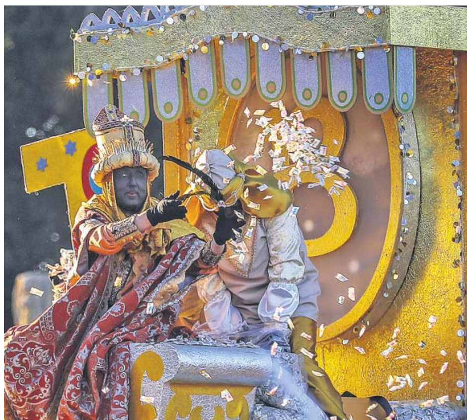
El Rey Baltasar durante la cabalgata de los Reyes Magos en Sevilla.

El colectivo feminista de Andalucía Mujeres24H ha convocado para el martes 15 de enero concentraciones tanto a las puertas del Parlamento, en Sevilla, como en el resto de provincias de la comunidad y del país, bajo el lema Nuestros derechos no se negocian. Ni un paso atrás en igualdad .