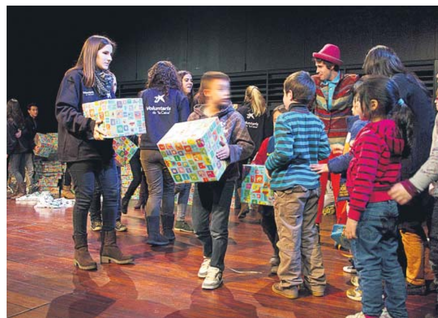
Niños en situación de vulnerabilidad recogen regalos gracias a Obra Social La Caixa. L.C.

La campaña de rebajas de invierno generará este año 122.900 contratos, lo que supone un 4,1% más que el año anterior, según las previsiones del grupo Adecco. Cataluña (23.071 contratos), Madrid (16.484) y Comunidad Valenciana (16.295) serán las que generarán más empleo. ●