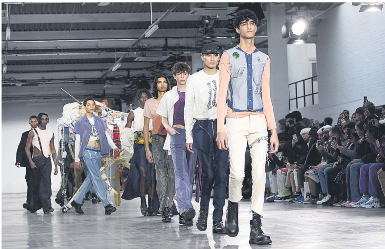
Varios modelos presentan creaciones del diseñador sueco Per Gotesson durante la London Fashion Week Men's.

Aunque lo de ponerle a todo nombre en inglés da pereza, sin duda esta es la tendencia más interesante para 2019. Porque real food no es ni más ni menos que comida real. Es decir: más mercado, más cocina y menos alimentos ultraprocesados. Y si llamarlo así ayuda a que algo tan lógico y necesario se convierta en una moda, bienvenido sea. ●