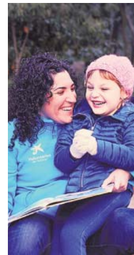
Una voluntaria lee un cuento a una niña. L.C.

El programa CaixaProinfancia impulsa el desarrollo integral y la inclusión social de la infancia en situación de pobreza. Desde 2007 ha prestado apoyo a más 300.000 niños y adolescentes y a más de 176.000 familias gracias a las 420 entidades sociales de todo el país que implementan el programa en sus territorios. Hasta hoy «la Caixa» ha destinado a este proyecto un presu-