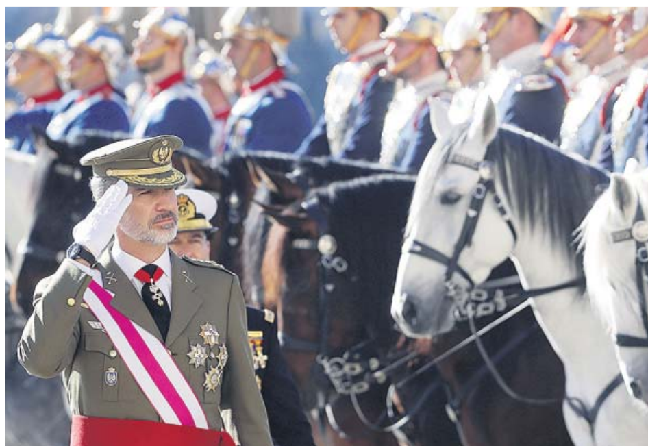
El rey Felipe VI pasa revista durante la celebración de la Pascua Militar en el Palacio Real.

Felipe VI aprovechó esa celebración para destacar también el papel clave que han tenido las Fuerzas Armadas en la consolidación del sistema democrático en España. «Las cuatro décadas de democracia no podrían entenderse plenamente sin reconocer la profunda identificación con la Constitución que han demostrado los integrantes de nuestras Fuerzas Armadas, fuerzas y cuerpos de seguridad del Estado y servicios de inteligencia», dijo