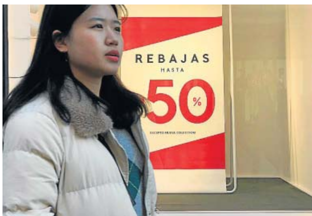
Una mujer pasa junto al escaparate de una tienda en rebajas.

El periodo oficial de descuentos arranca hoy. Las asociaciones de consumidores dan consejos contra los timos en tiendas