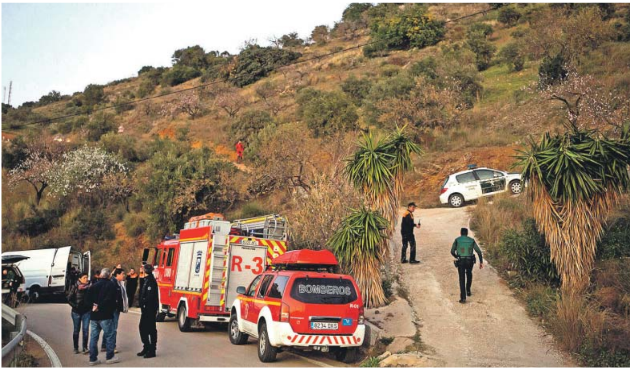
Efectivos de diferentes cuerpos de seguridad y emergencias se desplegaron ayer en el Dolmen del Cerro de la Corona.