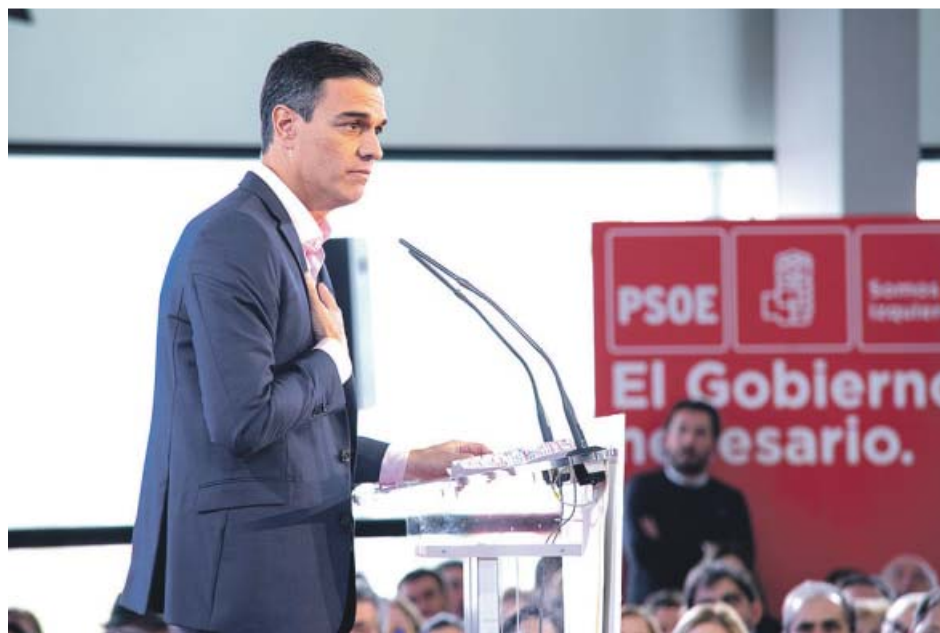
Sánchez presentó este fin de semana a los candidatos del PSOE en Barcelona y Burgos.

Lo hizo en su segunda intervención pública desde el viernes, en Burgos, en la presentación de Luis Tudanca como candidato a presidir la Junta de