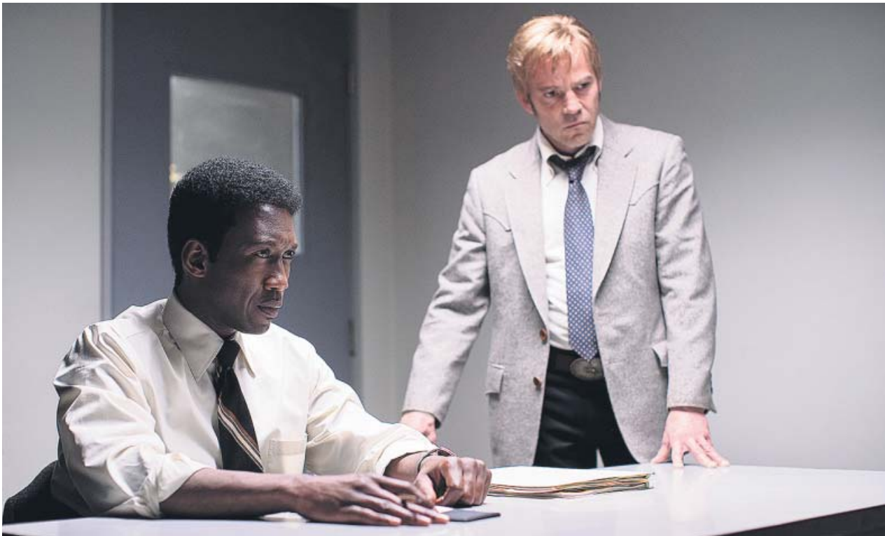
Wayne Hays (Mahershala Ali) y Ronald West (Stephen Dorff), algunos hombres buenos.