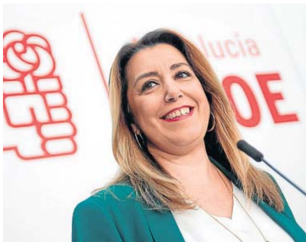
Susana Díaz, secretaria general del PSOE-A.

Díaz también se refirió a la posición en la que ha quedado el PSOE-A tras las elecciones, con siete puntos de ventaja sobre el PP y diez sobre Ciudadanos. Sobre esta cuestión dejó claro en la carta su respeto por la «vo-