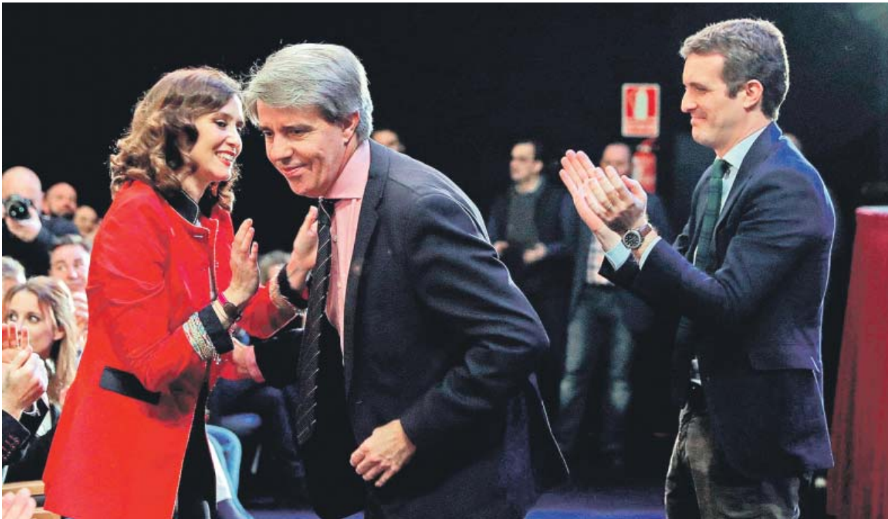
El presidente madrileño Ángel Garrido (c), ayer, en la capital con la candidata Isabel Díaz Ayuso y Pablo Casado.