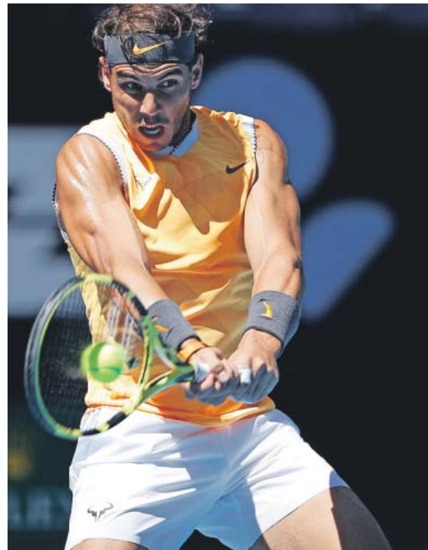
Rafa Nadal golpea la bola ante Berdych.

Tsitsipas se enfrentará ahora a Roberto Bautista, que disputará por primera vez unos cuartos de final en Australia tras deshacerse del croata Marin Cilic (6-3, 6-2, 4-6 y 6-4). «Puede ser el mejor momento tenístico de mi carrera», afirmó el jugador castellanense, de 30 años y número 24 en la clasificación de la ATP. ●