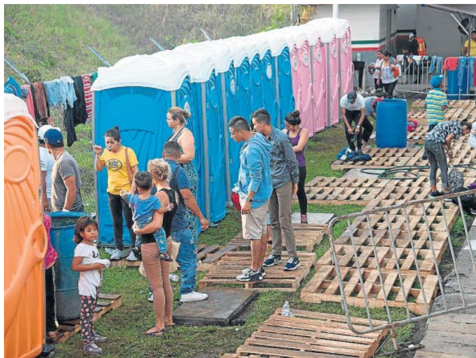
Integrantes de la caravana en el punto fronterizo de Tecún Umán (Guatemala).

Más de 400 niños acompañan a sus padres y madres en la caravana migrante, de unas 2.000 personas, que cruza estos días el suroriental estado mexicano de Chiapas con el fin de llegar a Estados Unidos. Vuelven a ser protagonistas involuntarios de la situación, porque muchos de ellos padecen problemas de salud, con enfermedades gastrointestinales y respiratorias por el cambio de clima y deshidratación por el fuerte calor, con temperaturas de hasta 40 grados. ●