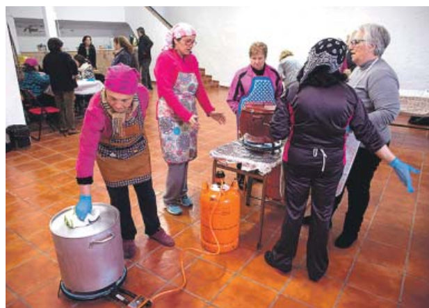
Vecinas de Totalán llevan caldo a los equipos de rescate.

Además de los dispositivos de rescate (Guardia Civil, bomberos, geólogos...), los periodistas y los 700 habitantes de Totalán (Málaga) tampoco descansan, porque del desgraciado acontecimiento que une a toda esta gente ha brotado algo