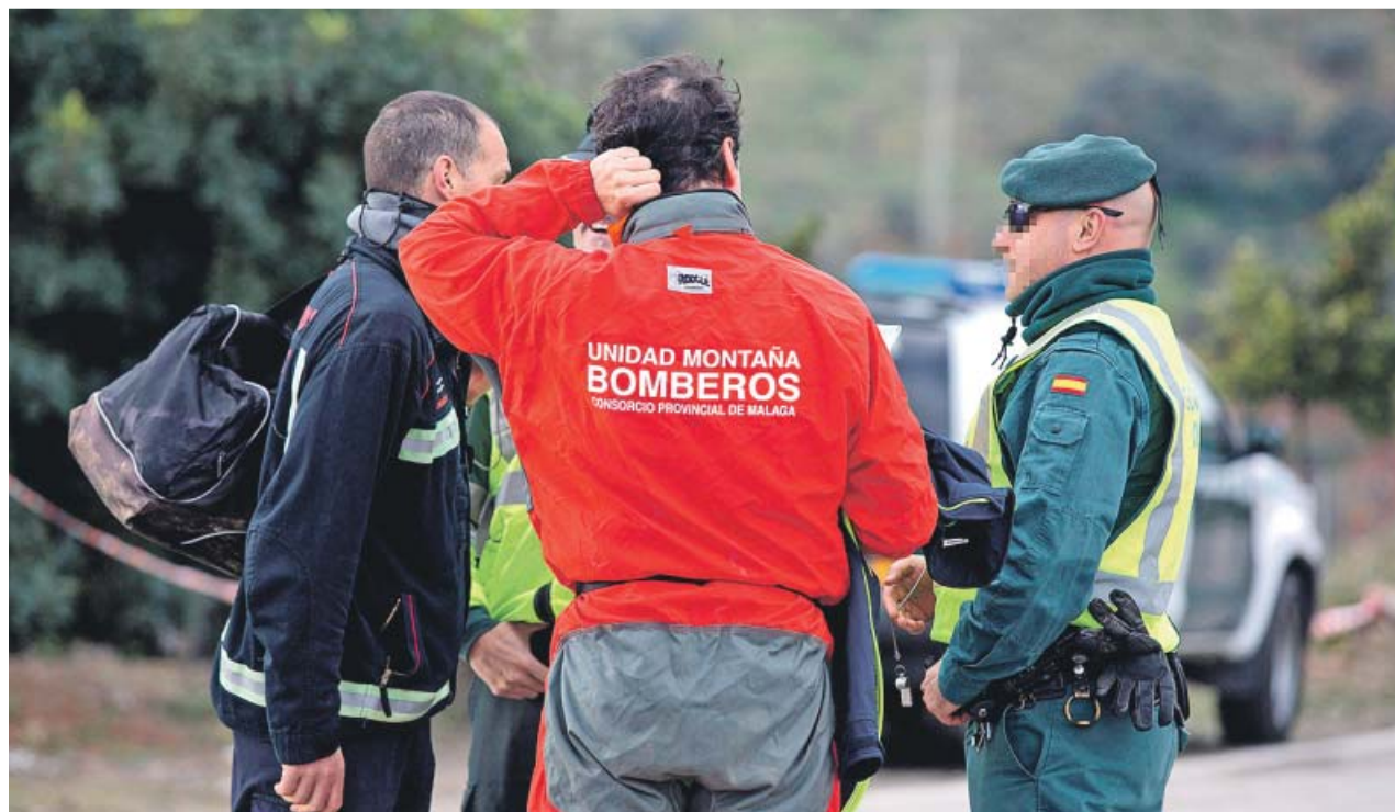
Miembros de los equipos de rescate conversan sobre el terreno, donde llevan a cabo las tareas de rescate.