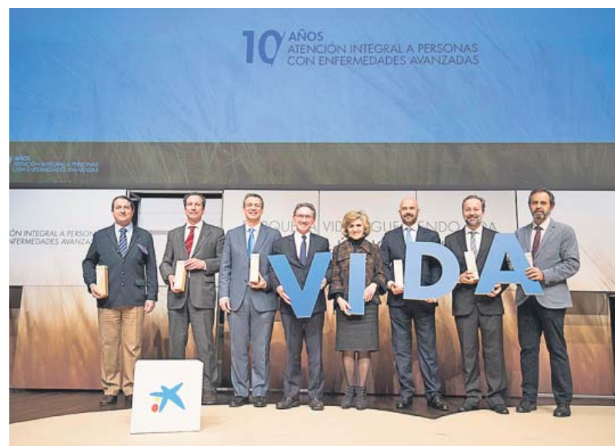
Carcedo (Ministra) y Giró (Fundación "la Caixa") con los directores del programa.

A pesar de todos los movimientos, Podemos aún no ha confirmado que finalmente vaya a presentar un candidato alternativo a Errejón. ●