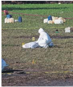
Imagen de la zona en la que se produjo la explosión.

tro mexicano de Salud, Jorge Alcocer, detalló que de las 81 personas que fueron hospitalizadas tras la explosión el viernes en la tarde, 66 continuaban en centros médicos, 12 fallecieron, dos fueron dados de alta y una persona decidió tomar el alta voluntaria. El recientemente nombrado fiscal general de México, Alejandro Gertz, señaló que de momento no se conocen las causas de la explosión y que se siguen investigando. ●