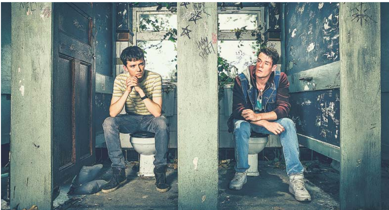
Otis (Asa Butterfield) y Adam (Connor Swindells) aprovechan los patios para hacer terapia.