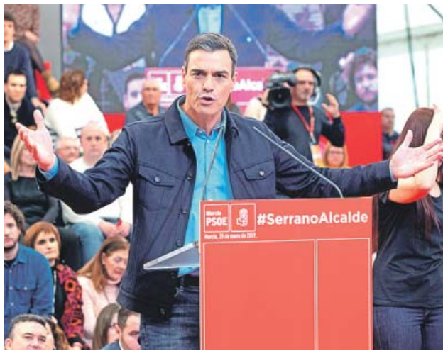
Pedro Sánchez, ayer, en Puente Tocinos (Murcia).