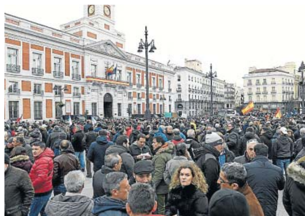
Taxistas concentrados ayer en la Puerta del Sol.