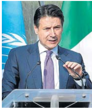
El primer ministro de Italia, Giuseppe Conte.

El Banco Central Europeo, máxima autoridad monetaria de la UE, intervino a principios de este mes Banca Carige, una de las mayores instituciones financieras del país, y ha advertido de la situación de capital de otra entidad, el banco Monte dei Paschi di Siena, dejando clara su preocupación por el momento que atraviesa Italia. ● R. A.