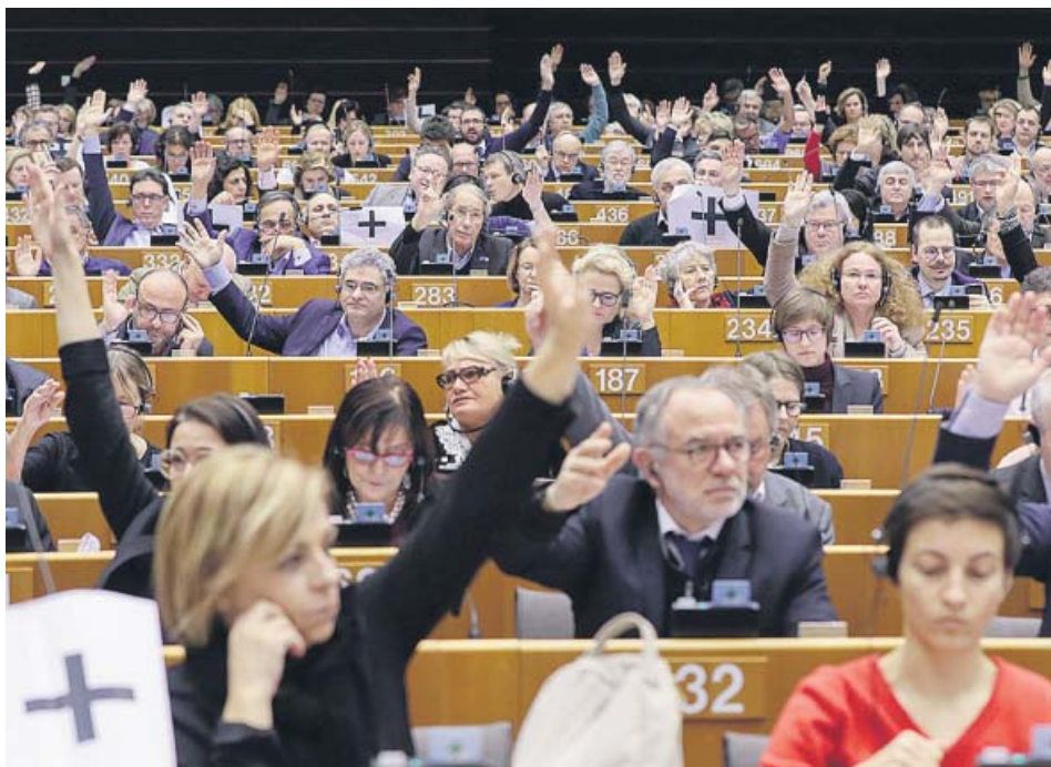
El hemicycle del Parlamento Europeo durante la votación sobre Venezuela.