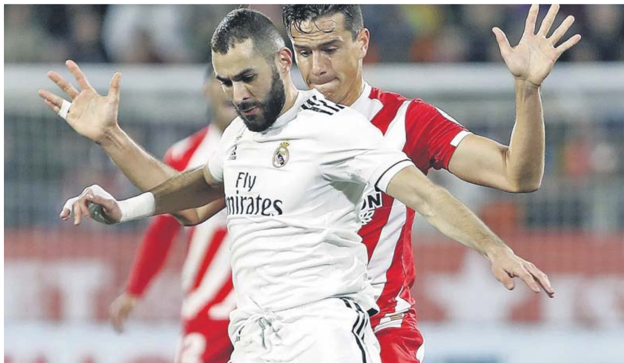
Karim Benzema presionado por Bernardo Espinosa en el partido de Montilivi.

«No me toquéis los cojones», espetó un Neymar visiblemente molesto cuando un periodista le preguntó por un posible regreso del brasileño al Barça cuando aterrizó en la Ciudad Condal para tratarse de su lesión, que le tendrá sin jugar unas diez semanas.