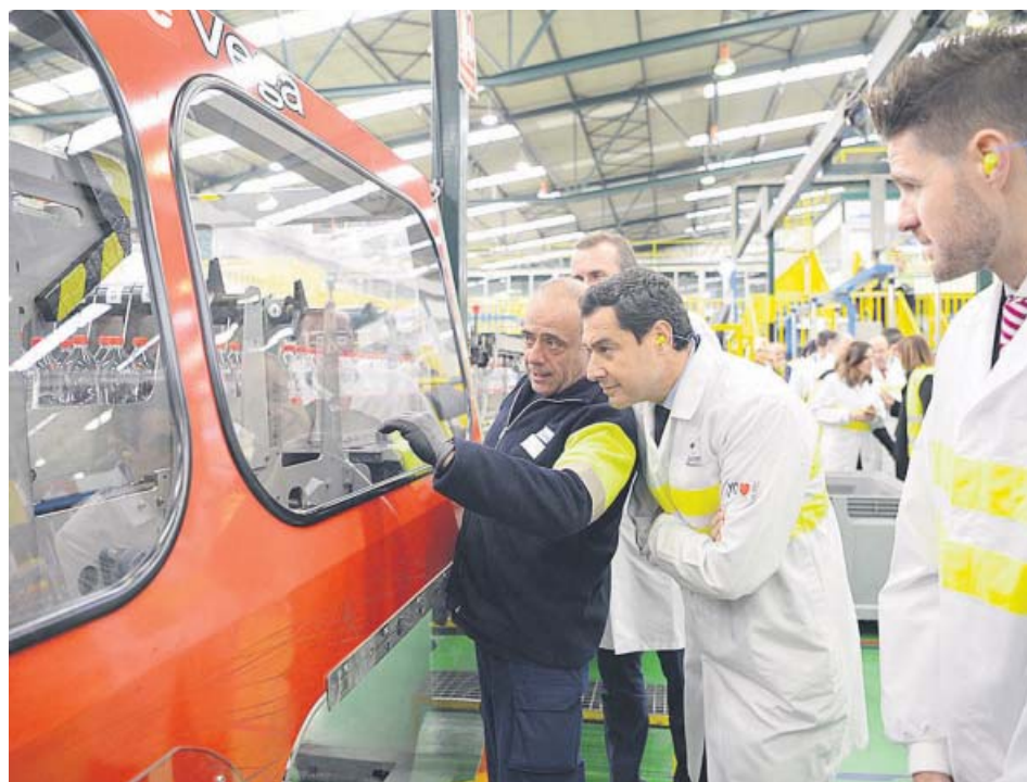
El presidente de la Junta, durante su visita a la planta de Lanjarón.

El presidente de la Junta, Juanma Moreno, visitó ayer la planta embotelladora de Aguas de Lanjarón, en la localidad que lleva el mismo nombre, en la Alpujarra de Granada. Esta ha sido la primera visita institucional que el popular realiza a la provincia como presidente autonómico. La fábrica de Lanjarón emplea de forma directa e indirecta a 200 personas y produce anualmente 305 millones de litros de agua mineral.