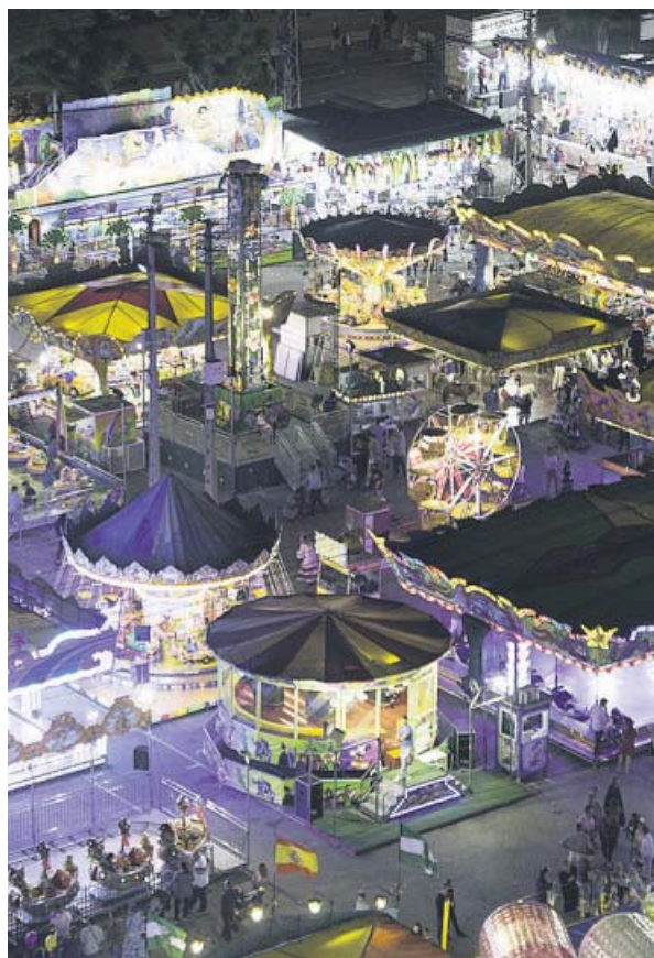
Calle del Infierno, en la Feria de Abril de Sevilla. PACO PUENTES

Esta iniciativa se suma a la instalación, por primera vez