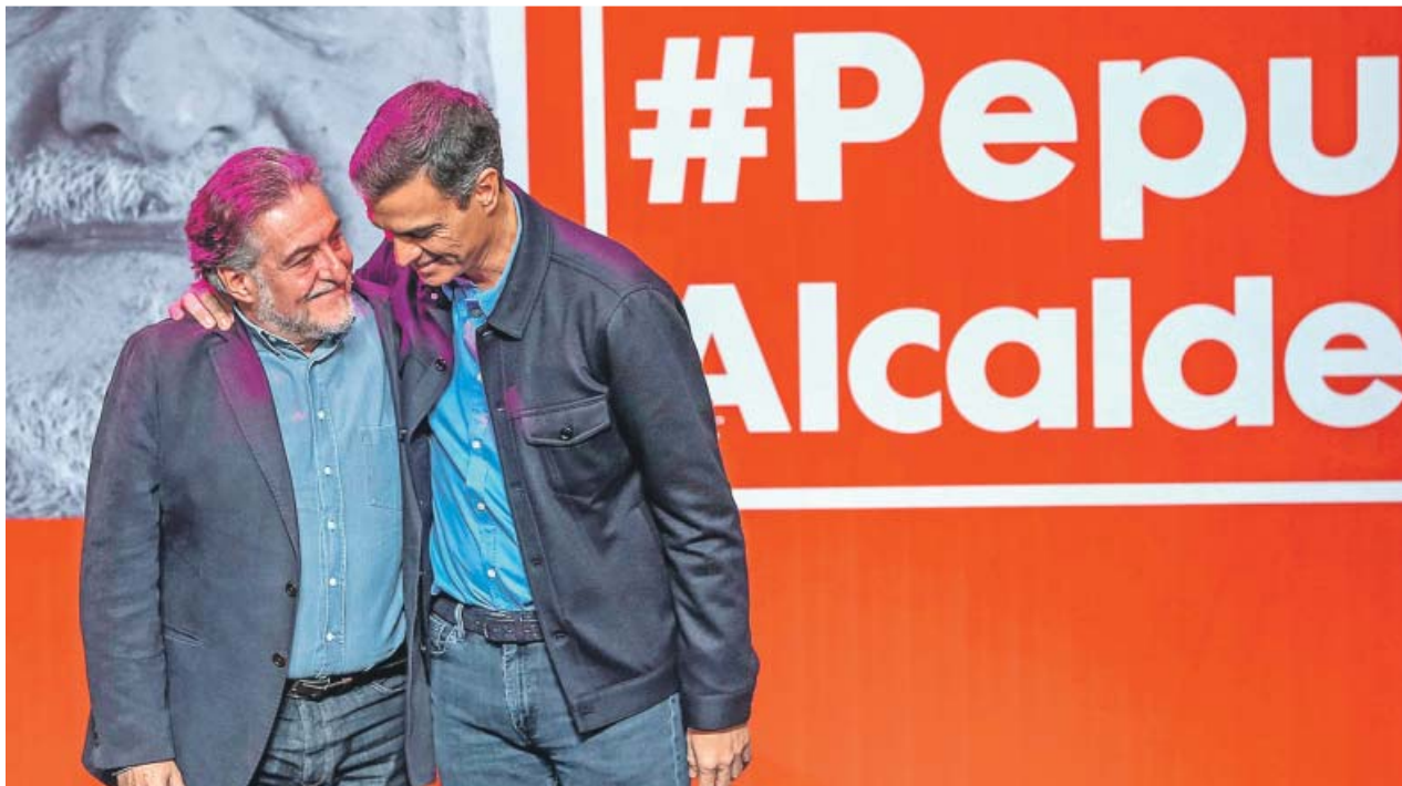
Pedro Sánchez presenta la precandidatura del exseleccionador de baloncesto Pepu Hernández en Madrid.