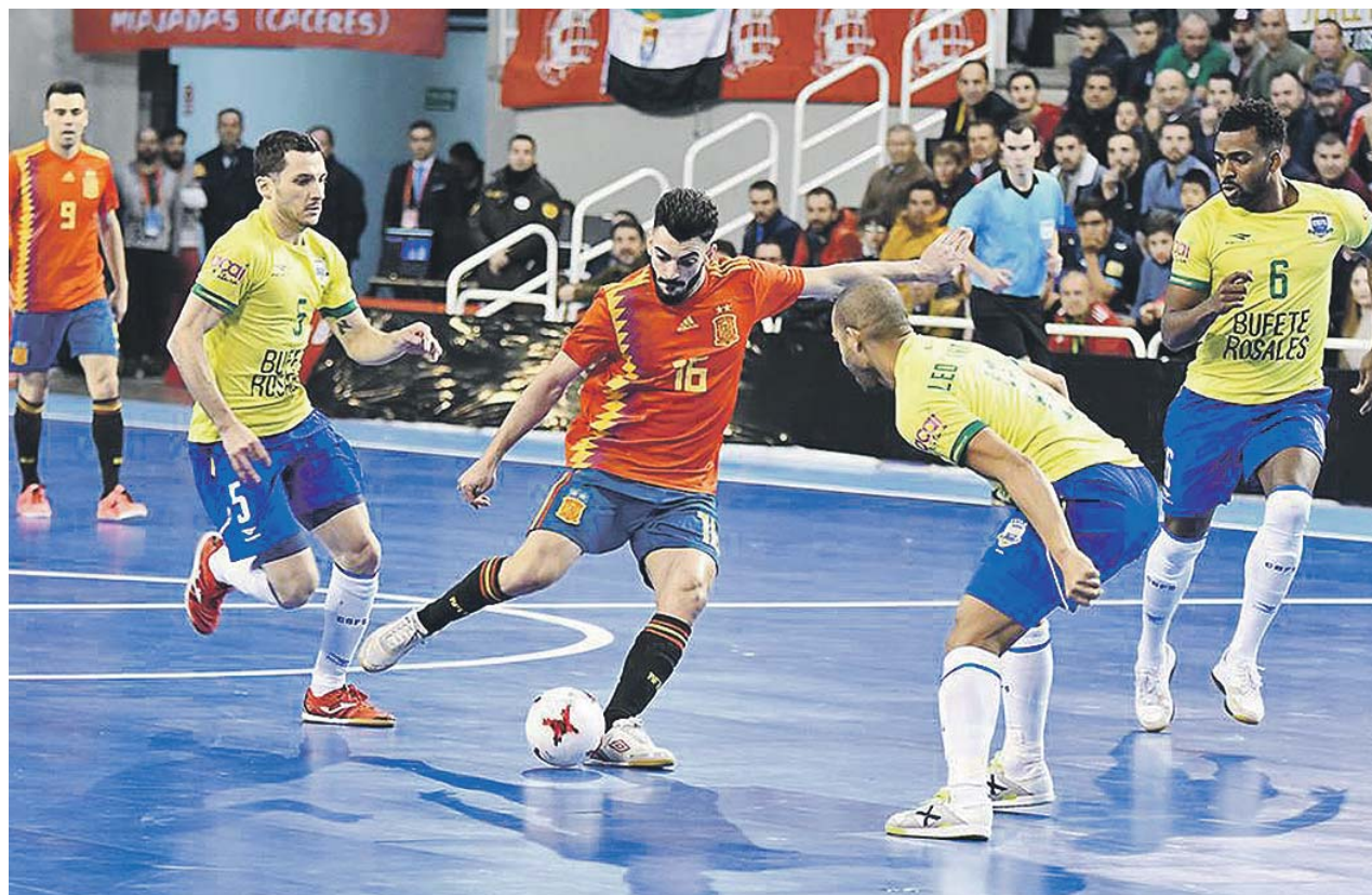
Un lance del partido amistoso de fútbol sala entre las selecciones de España y Brasil, en Cáceres.

«Esto es un claro ejemplo de alguien que no está cooperando con nuestros agentes. Como se ve en el vídeo, se le dan muchas oportunidades de abandonar el recinto», afirmó el portavoz de la Policía de Miami, Freddie Cruz. ●