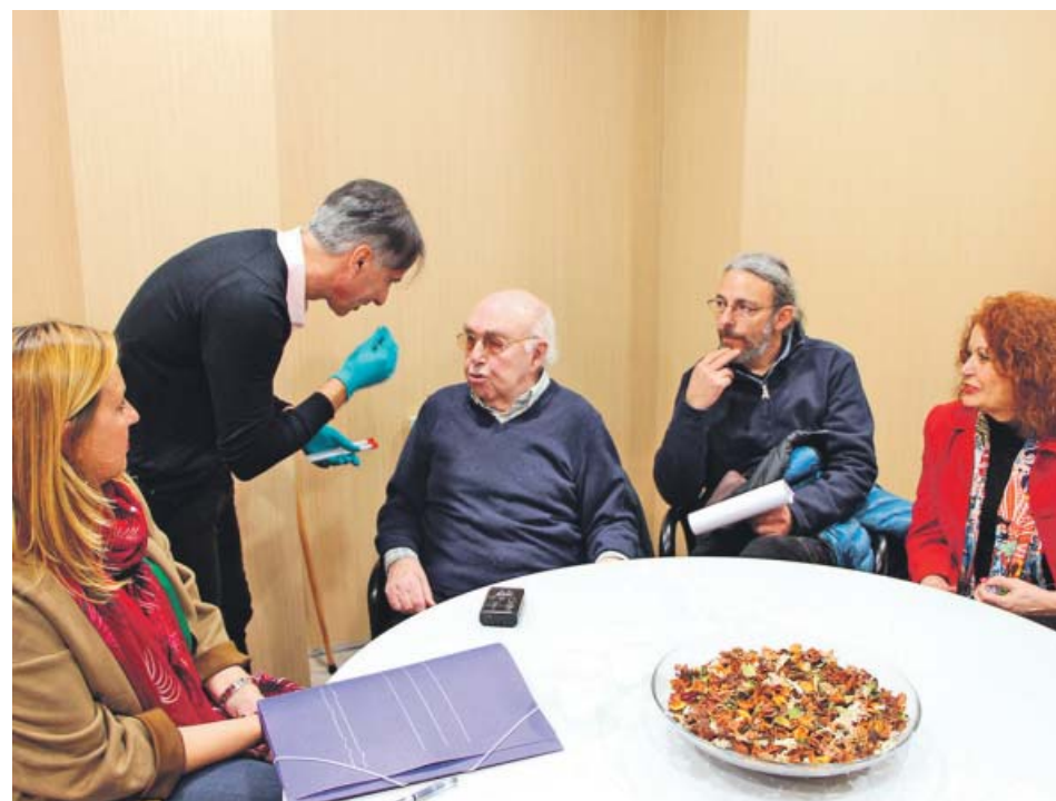
La recogida de muestras se seguirá practicando mientras haya peticiones.

El Ayuntamiento de Sevilla ha recogido ya 230 pruebas de ADN de familiares de víctimas de la Guerra Civil y de la dictadura franquista, cuyos restos permanecen aún en distintas fosas comunes del cementerio de San Fernando. Según informó ayer el Consistorio, este trabajo de identificación está siendo ejecutado por un grupo de especialistas, que comenzó a trabajar en mayo de 2018, está conformado por la Universidad de Granada y el Laboratorio Municipal de Sevilla. ●