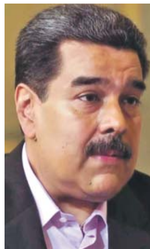
Nicolás Maduro, durante la entrevista con Évole.

En el momento más duro de su mandato, Maduro dejó claro que sigue teniendo «ases en la manga». «Nuestros oponentes