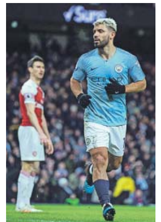
Agüero celebra uno de sus tres goles ante el Arsenal.

A los 10 minutos, el Arsenal hizo el 1-1. En un balón parado, Nacho Monreal peinó la pe-