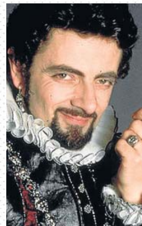
Edmund Blackadder (Rowan Atkinson). FILMIN

Pero la cosa salió tan bien que las dinastías de los Blackadder y los Baldrick —una conspiración sin descanso— fueron perpe-