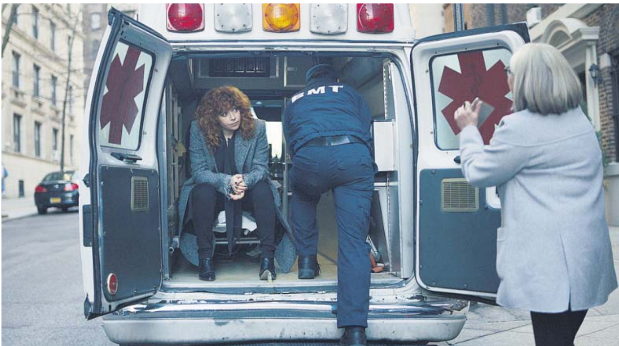
Nadia (Natasha Lyonne), una mujer en lucha constante contra la muerte absurda.