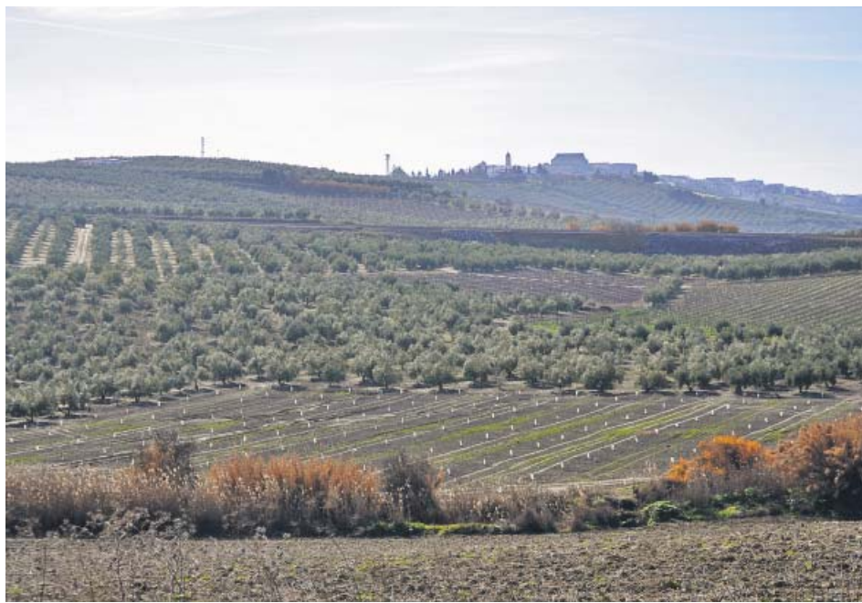
Vista de uno de los cultivos de olivar de Andalucía.

Para intentar frenar esta problemática nace Reutivar, un proyecto innovador y pionero en Europa que tiene como principal objetivo evaluar la aplicación de aguas regeneradas —residuales tratadas y recuperadas— al olivar. La iniciativa, puesta en marcha por la Asociación de Comunidades Regantes de Andalucía (Feragua), junto con el Centro de las Nuevas Tec-