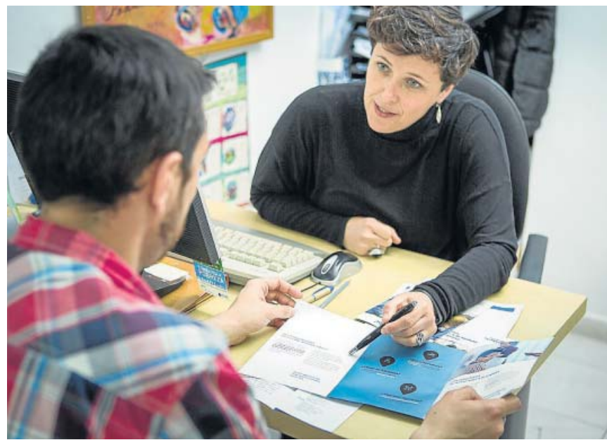
Una persona en riesgo de exclusión social se informa del programa Incorpora.

Tal y como adelantó su diputado Fernando Navarro, Cs pedirá la «derogación» del decreto en vigor y convocar una «Mesa de Movilidad» que estudie cuestiones como la «flexibilidad, apertura del sector, competencia leal e igualdad de condiciones», «medidas para la modernización del sector del taxi», «compensaciones» para reducir los costes «de transición» e «incentivos» para que en la ciudades se transite hacia un modelo «menos contaminante y más sostenible». Además, Cs pide «condenar la violencia y los problemas derivados de las protestas del taxi». ●