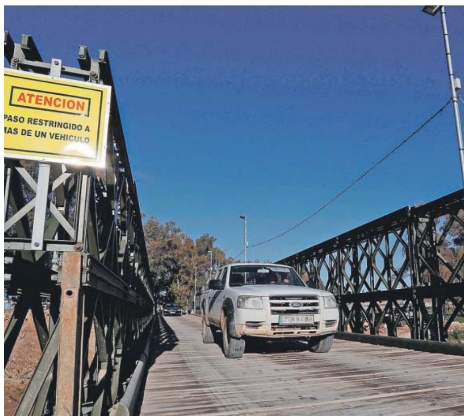
Un vehículo atraviesa uno de los puentes instalados por el Ejército de Tierra.

La Policía Nacional ha detenido en la zona Sur de la capital granadina a dos personas, un hombre y una mujer de 53 y 55 años, respectivamente, a los que se les atribuye la titularidad de un cultivo de marihuana con 959 plantas en una vivienda en la que se defraudaba el fluido eléctrico.