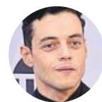
RAMÍ MALEK El actor, sobre el guitarrista de Queen

«Mi contacto con Bryan [Singer] no fue agradable, en absoluto. Eso es lo que puedo decir al respecto de momento»