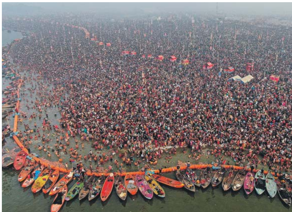
Miles de personas se reúnen en la India en una concentración religiosa.

El expresidente de Bankia, Rodrigo Rato, aseguró ayer ante la Audiencia Nacional que en su conciencia «no había ninguna sensación de que tuviéramos un problema de salvedades».