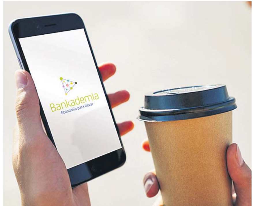
Los cursos de Bankademia son perfectos para aprender en cualquier lugar desde tu 'smartphone'.