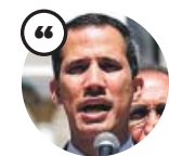
JUAN GUIDO Presidente de la Asamblea Nacional de Venezuela

«Mi profundo agradecimiento con el presidente Pedro Sánchez por la claridad que ha tenido»