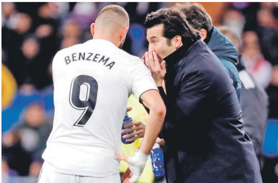
Solari y Benzema conversan durante el Real Madrid - Alavés.

El Rayo Vallecano cayó anoche en su estadio frente al Leganés (1-2) en el partido que cerró la jornada de Liga. Braithwaite y En Nesry marcaron para el Leganés; Álvaro García para el Rayo.