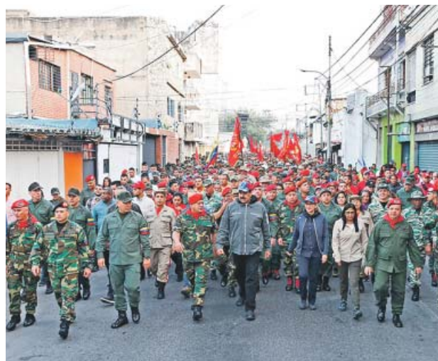
Maduro, en un acto con militares en el estado de Maracay.

El Ejecutivo español fue el primero en dar el paso, pero tras él llegó una cascada de reconocimientos por parte de otros Es-