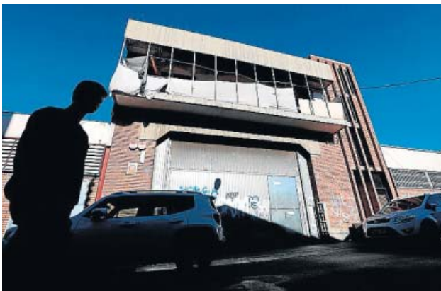
La nave donde supuestamente se produjo la violación.