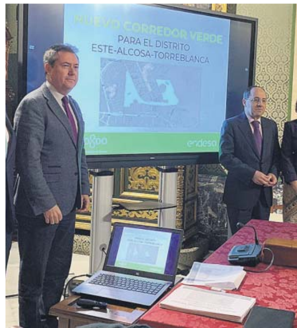
Espadas (izda.) presenta el nuevo corredor.