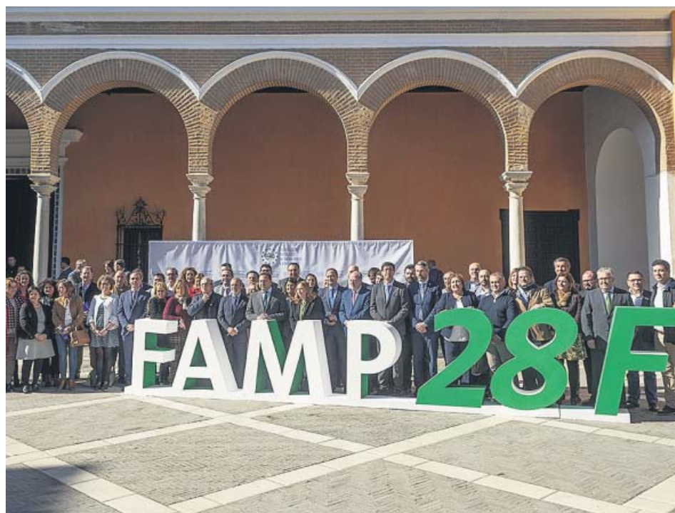
Foto de familia tras el acto celebrado en Sevilla por el Día de Andalucía, ayer.