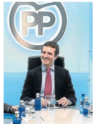
Pablo Casado, ayer.

Preguntado por un posible pacto con Vox tras las elecciones del 28-A, el candidato popular dijo estar dispuesto a repetir la fórmula aplicada en Andalucía. «Hay que juzgar la constitucionalidad de un partido por sus actos. Vox pide muchas cosas que son imposibles, pero en Andalucía hemos alcanzado un buen acuerdo para mejorar la vida de la gente. Cuando Vox proponga algo inconstitucional, nos tendrá en contra», dijo.