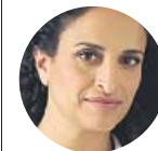
NOA La cantante, sobre su disco Letters to Bach

«Bach no nos necesita, él ya es extraordinario. Si lo utilizamos, tenemos que justificar por qué»