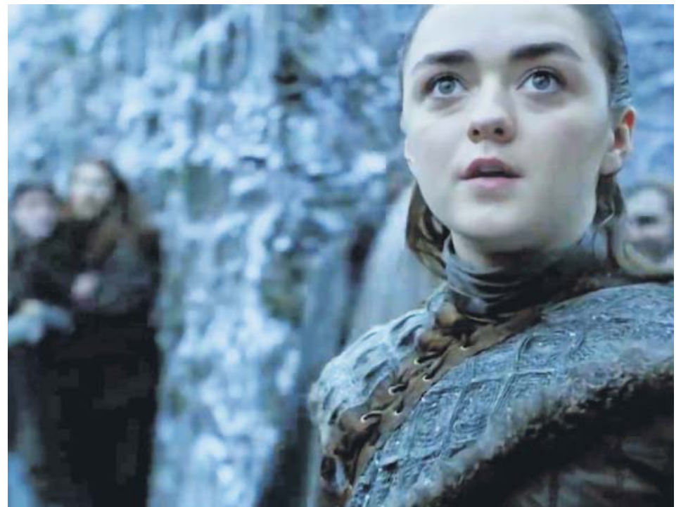
La cara de Arya Stark al ver por primera vez un dragón surcando el cielo.