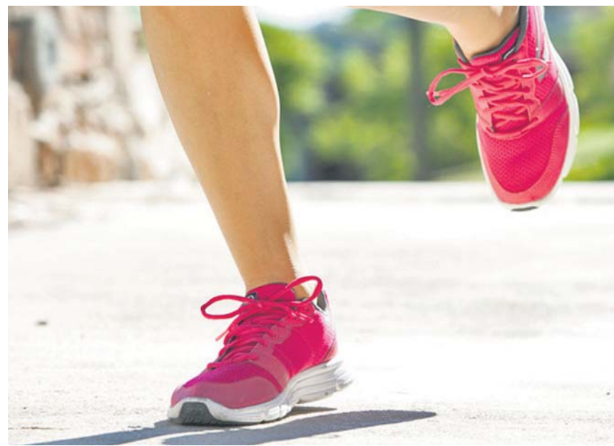
Ejercitarse en superficies duras y no entrenar gradualmente son factores de riesgo.