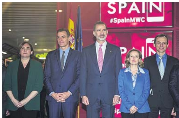
El posado de autoridades, sin el president .

Fuentes del Govern explicaron ayer que habían avisado hace días tanto a Casa Real como al Gobierno de que Torra y el conseller de Políticas Digitales, Jordi Puigneró, finalizarían su paseo justo antes de llegar al pabellón de España porque, en ese momento, debían mantener una reunión con un grupo de empresarios. De hecho, las mismas fuentes apoyaron su argumento en que tampoco estuvieron presentes en el posado previsto frente al es-