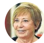
Celia Villalobos Diputada histórica, fue una de las principales valedoras de Soraya Sáenz de Santamaría