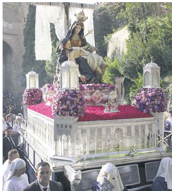
Virgen de la Alhambra Coronada, en Granada.