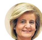
Fátima Báñez Exministra de Empleo, habría sido secretaria general del partido con Santamaría