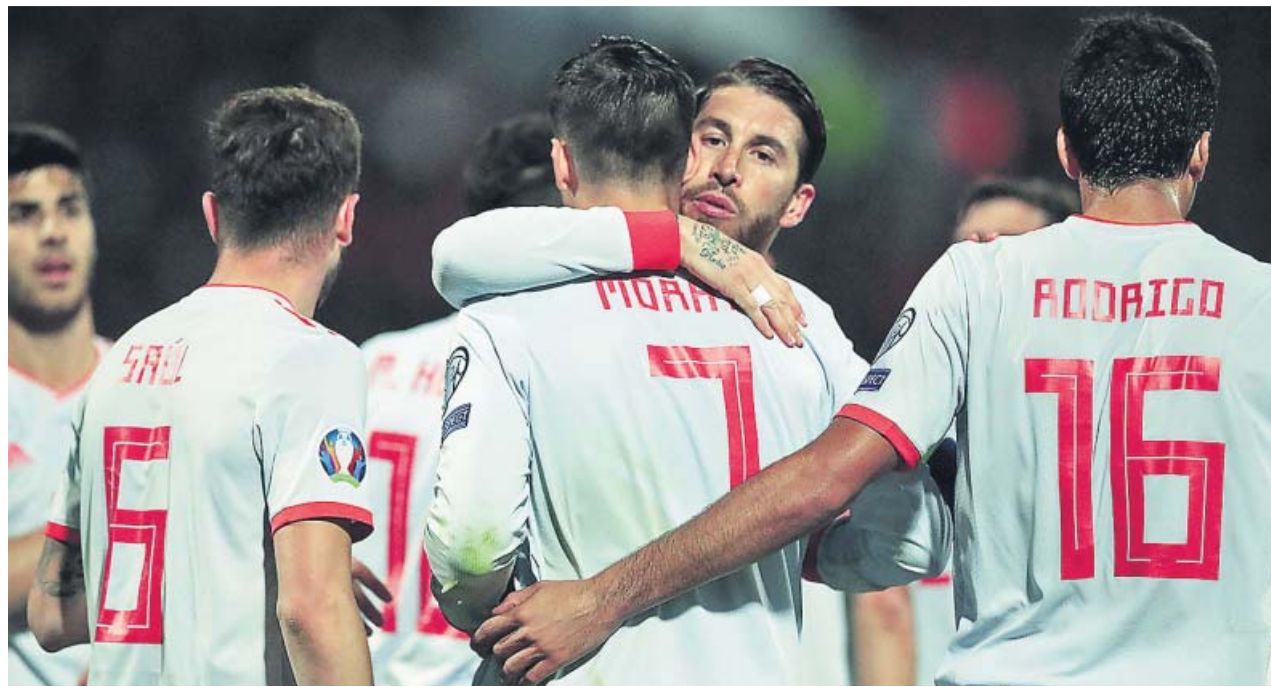
Sergio Ramos y el resto de los jugadores españoles felicitan a Álvaro Morata tras uno de sus goles en Malta.

DOS GOLES del delantero del Atlético le dieron una victoria cómoda a España en su visita a Malta ESPAÑA DOMINÓ de manera absoluta el partido ante un equipo que solo quiso encajar pocos goles