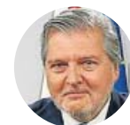
Íñigo Méndez de Vigo Portavoz del Gobierno con Rajoy, destacó por su apoyo a Santamaría