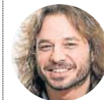
Miguel Vila Exdiputado, vinculado a la corriente de Íñigo Errejón frente a la de Iglesias