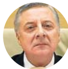
José Blanco Exsecretario de Organización y padrino político de Sánchez, apoyó a Díaz