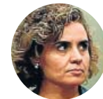
Dolors Montserrat Cuestionada como portavoz en el Congreso, apoyó a Cospedal en las primarias