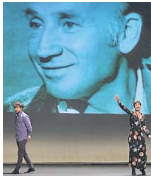
Un momento en el Teatro Caja Granada. VARELA PRODUCCIONES

Enamórate de Lope y Una noche blanca con los clásicos se interpretaron ayer en la sede del Teatro Caja Granada, dentro del programa de teatro social educativo que la Compañía de Blanca Marsillach lleva desarrollando desde hace más de diez años como homenaje a su padre, Adolfo Marsillach. Su objetivo: acercar el Siglo de Oro a estudiantes de secundaria y bachillerato de una forma diferente: dándoles la oportunidad de subir ellos mismos al escenario. ●