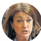
Soraya Rodríguez Exportavoz en el Congreso, criticó la propuesta del relator para Cataluña