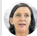
Carolina Bescansa Fundadora de Podemos, se desmarcó de las decisiones tomadas por Iglesias