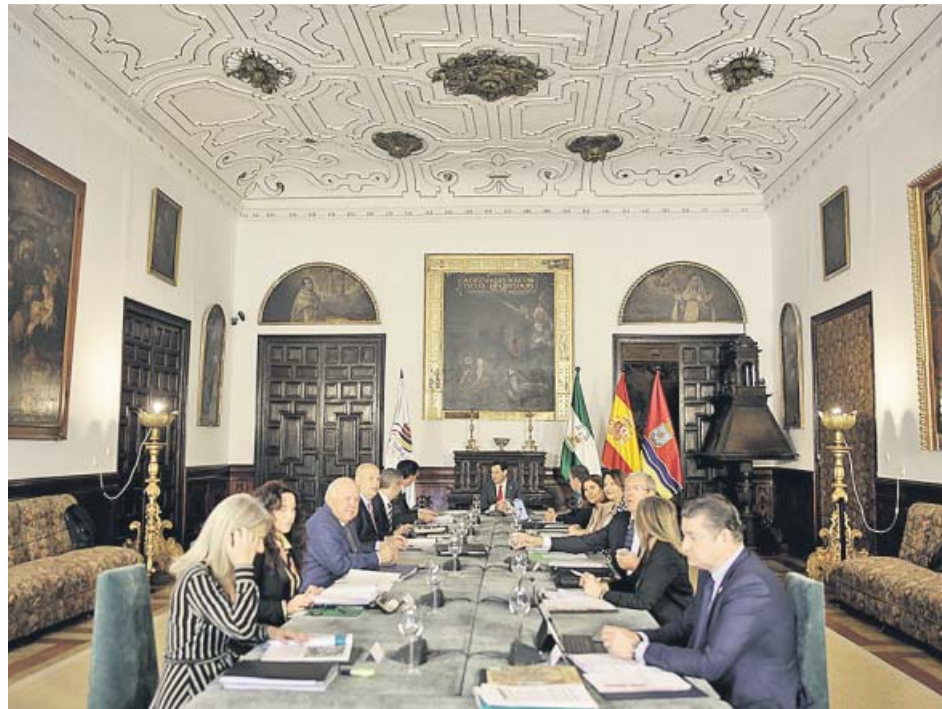
Reunión del Consejo de Gobierno en el palacio de los Guzmán, en Sanlúcar de Barrameda. J. A.

El vicepresidente pidió además a los socialistas andaluces que «dejen de marear la perdiz» remitiéndose en esta materia a un acuerdo na-