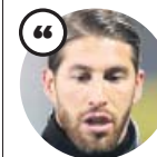
SERGIO RAMOS Capitán de la selección española

«Míster, esperamos que todo salga lo mejor posible. El equipo está contigo a muerte. La familia es sagrada»