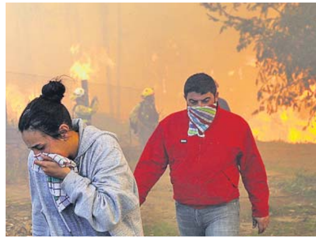
Bomberos y vecinos de Rianxo, en el incendio.

Las llamas, originadas en Dodro, avanzaron hacia Rianxo y han arrasado más de 850 hectáreas