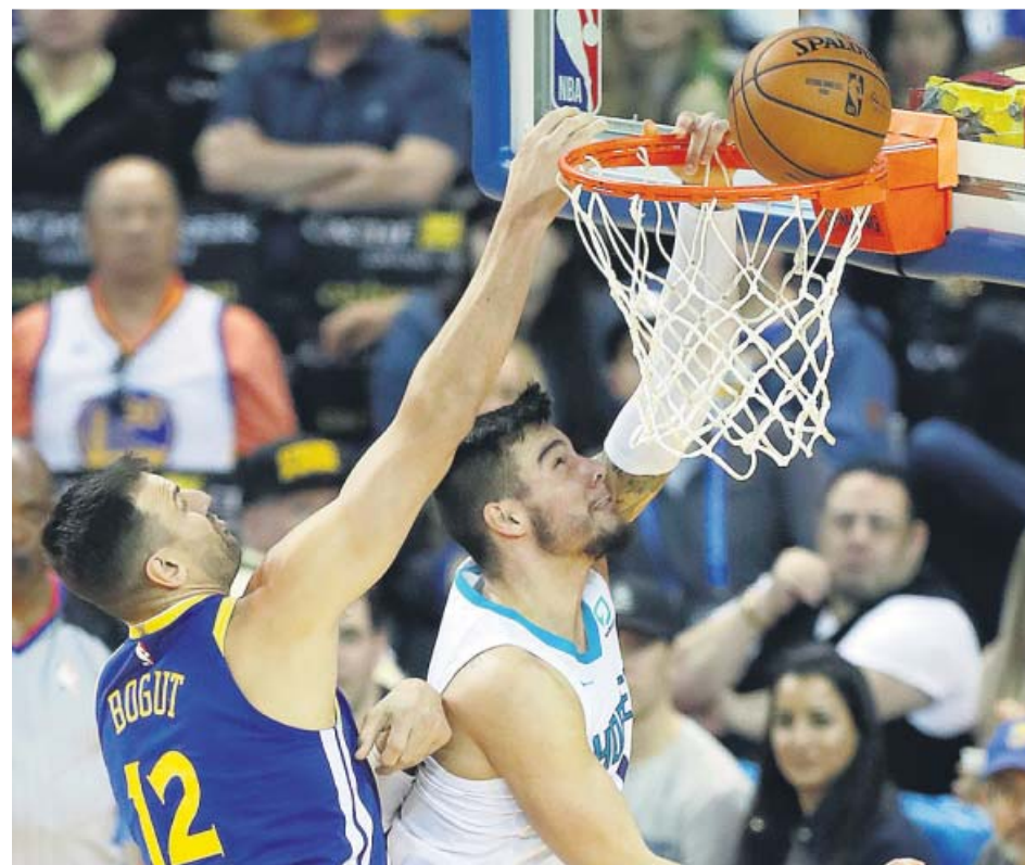
Willy Hernangómez anota ante Andrew Bogut en el Warriors -Hornets.

Esta semana, varios duelos directos apuntan a clave en la lucha por la salvación. Además de los citados Huesca-Celta y Levante-Huesca, el Leganés recibe el jueves al Valladolid, el sábado se juega un derbi catalán entre Espanyol y Girona con ambos tratando de poner tierra de por medio, y el domingo hay un Balaidos un Celta-Real Sociedad con los vigueses tratando de seguir con su escalada desde la vuelta de Iago Aspas y los donostiarres queriendo alejar posibles fantasmas. ●