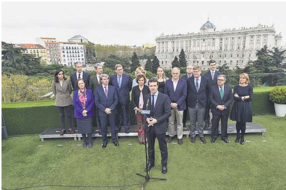
Pablo Casado durante la presentación de la lista del PP a las elecciones europeas.

CANDIDATA La portavoz en el Congreso irá acompañada por Garrido, Pons, Istúriz, Zoido o Margallo