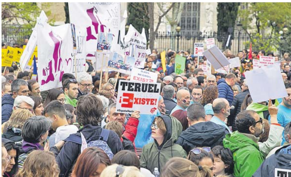
Un momento de la manifestación de la «España vaciada» celebrada en Madrid. ELENA BUENAVISTA

Mejorar el acceso a servicios básicos; políticas de empleo, sobre todo para jóvenes y mujeres, o modernizar las comunicaciones, entre las medidas más urgentes