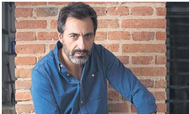
El autor Juan del Val presenta su cuarto libro.

Sin embargo, no se trata de una novela de humor. Tampoco de una tragedia o una comedia surrealista, pero posee «todas esas cosas». Lo que sí promete es una historia con la que cualquier española del siglo XXI, «tenga 20 o 60 años», se sentirá identificada: «Candela es tan normal y tan extraordinaria como son todas las mujeres. Bueno, como la mayoría», rectifica Del Val. Y aprovecha el micrófono que tiene delante para confesar su amor por las mujeres: «Me fascinan, me inter-