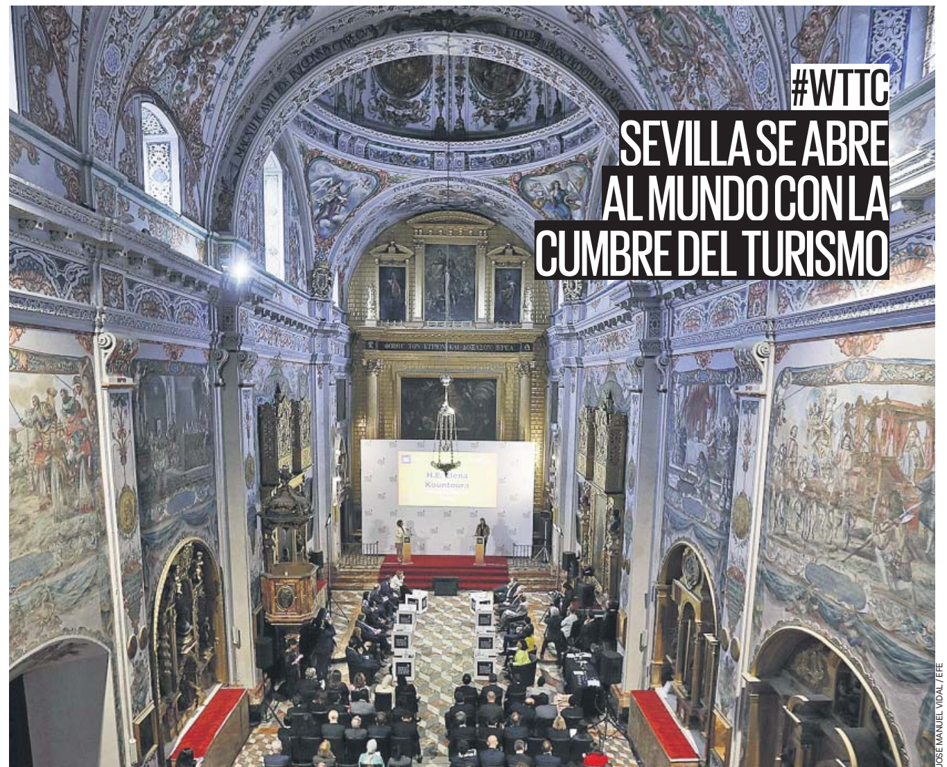
#WTTTC SEVILLA SE ABRE AL MUNDO CON LA CUMBRE DEL TURISMO

Más de 1.650 personas participarán hasta mañana en la Cumbre Internacional de Turismo (WTTTC) que se celebra en Sevilla. La inaugura hoy Pedro Sánchez, que mantendrá un encuentro con el ponente principal, Barack Obama. PÁGINA 4 Y 6