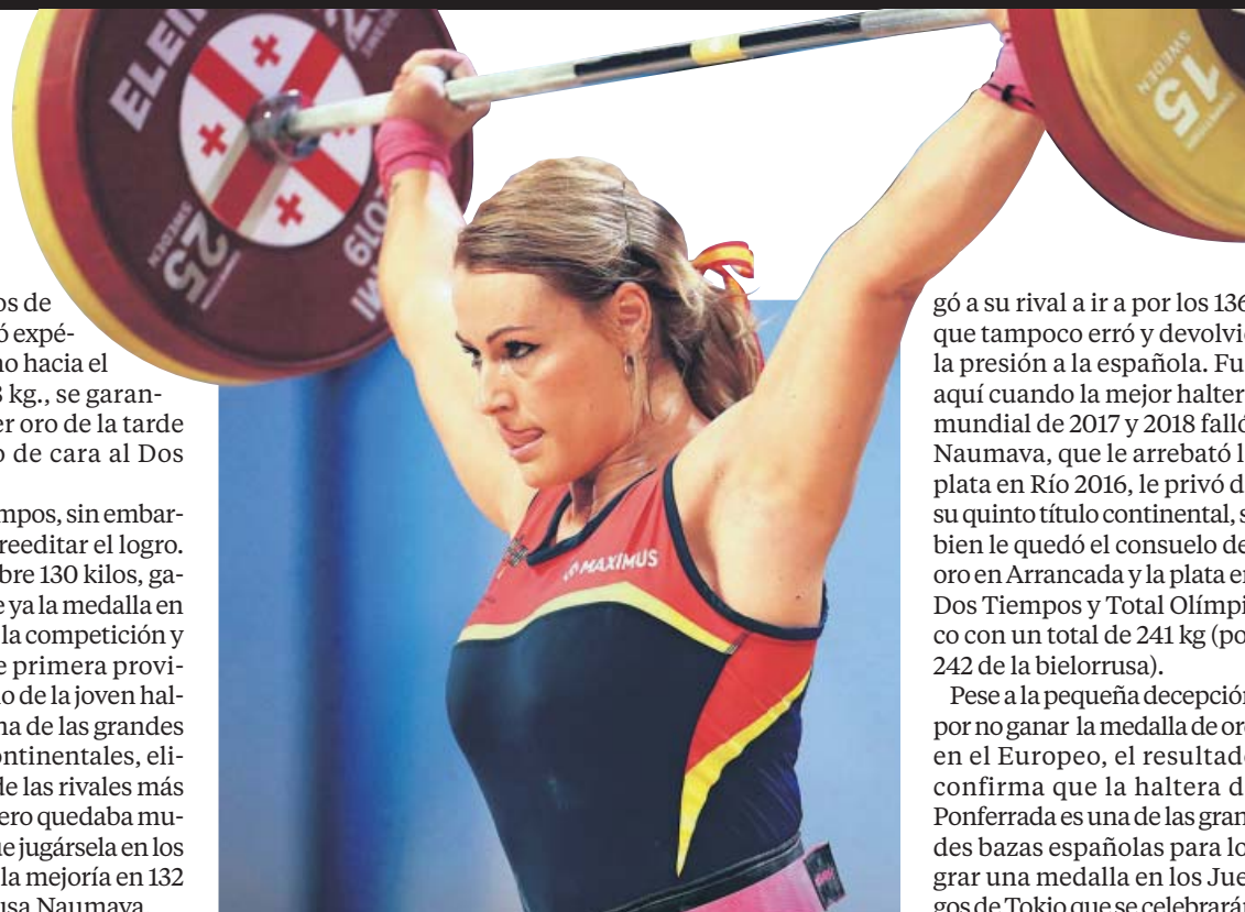
La berciana durante el torneo continental.