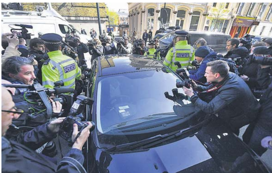
Periodistas se agolpan alrededor del coche en que Assange llegó al Tribunal de Westminster.

SIN ASILO El creador de WikiLeaks llevaba siete años viviendo en la embajada de Ecuador en Londres ARRESTO Scotland Yard sacó al periodista de la sede diplomática en volandas ACUSACIÓN EE UU pide su extradición por conspirar para acceder a documentos secretos