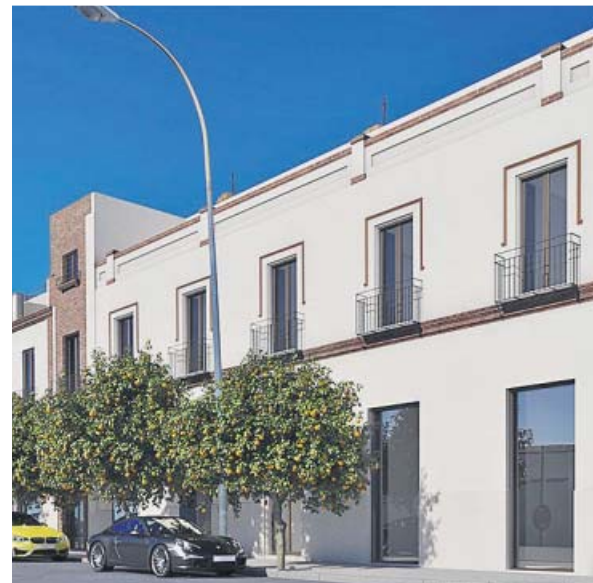
Recreación de la fachada del edificio de La Barqueta.

En un comunicado, el Ayuntamiento indicó que con esta acción se desbloquea un proyecto «enquistado desde hace más de una década», concretamente trece años, dotando de uso residencial a un edificio hasta ahora degradado a las puertas del barrio de la Macarena.