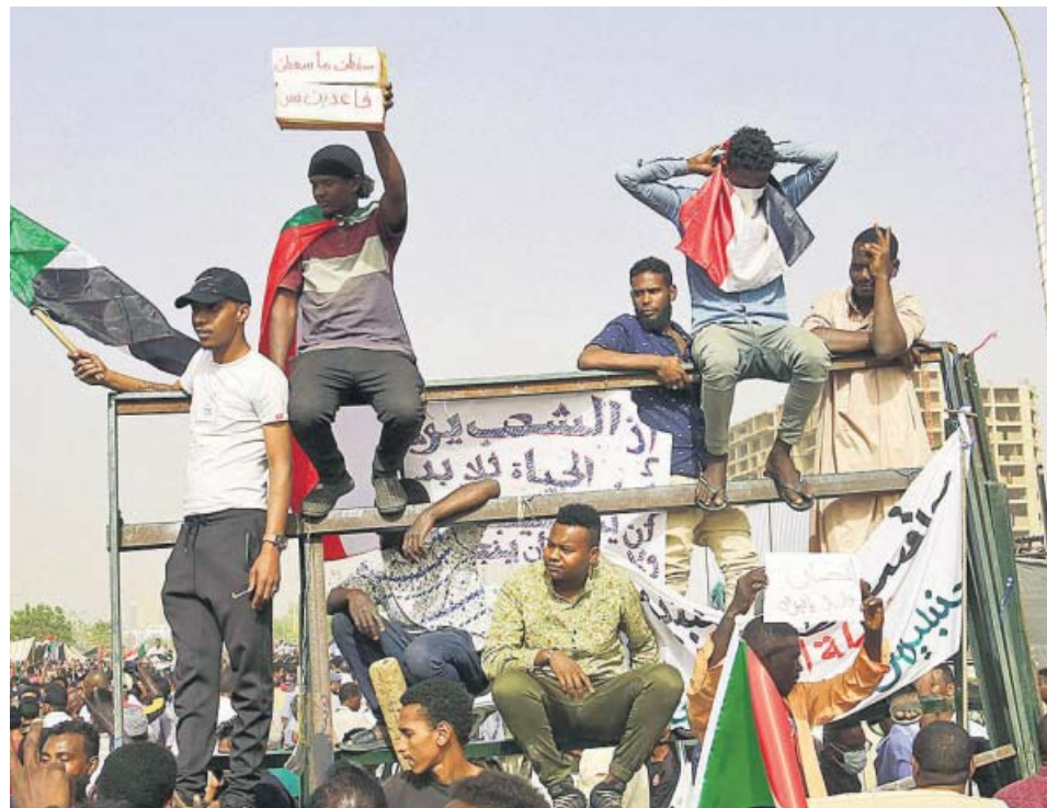
Varios activistas celebran la salida de Omar al Bashir del Gobierno en Jartum (Sudán).

Una mujer embarazada fue evacuada ayer a Malta desde el barco humanitario Alan Kurdi en el que se encontraba junto a otros 61 migrantes y que espera desde hace 8 días la concesión de un puerto para atracar. El barco sigue frente a Malta después de que Italia les impidiese acercarse a Lampedusa.