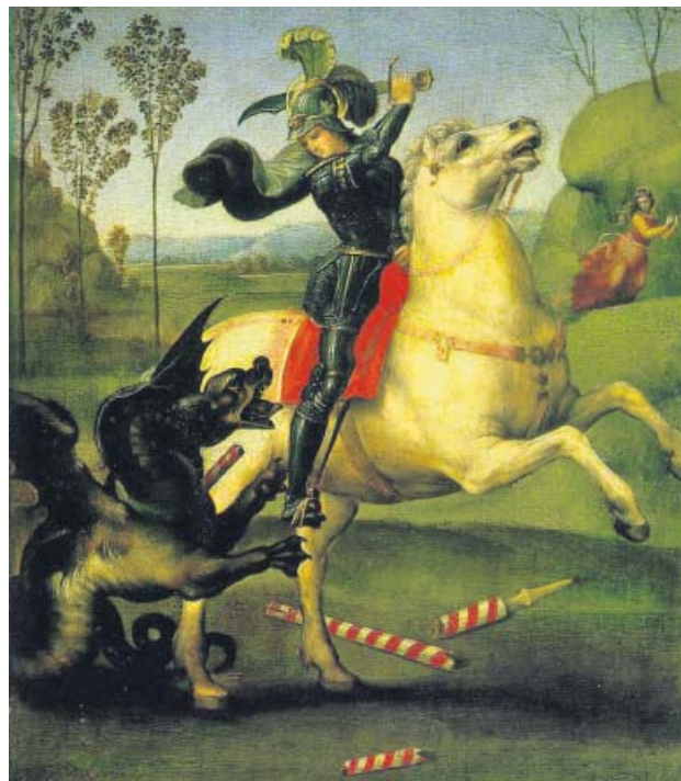
San Jorge y el dragón, óleo de Rafael Sanzio.

Tres de las cuatro fechas están forzadas. El día del martirio de Jorge no consta.