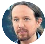
Pablo Iglesias Candidato de Unidas Podemos

«Me conformaría con que se cumpliera la Constitución»