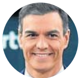
Pedro Sánchez Candidato del PSOE

«Apostamos por la justicia social y el PP por los corruptos»