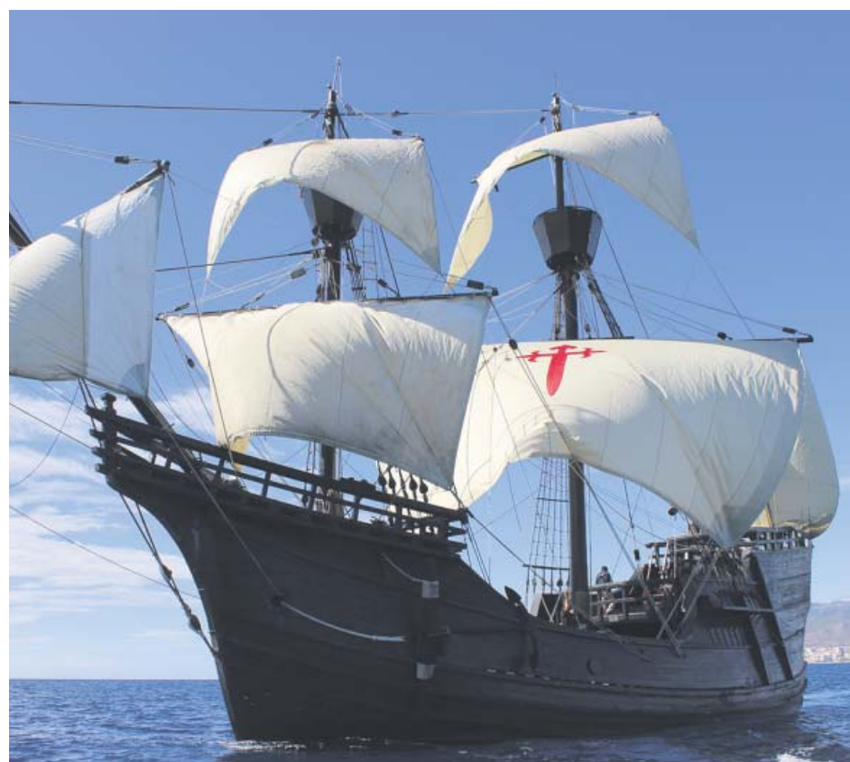
La Nao Victoria, en su camino hacia Sevilla a principios de este año.

La Policía Nacional ha denunciado en Granada a dos hombres y a una mujer por los presuntos insultos y amenazas que dirigieron al personal del servicio de Urgencias del Materno Infantil que atendió a un bebé enfermo de unos ocho meses con el que acudieron al hospital.