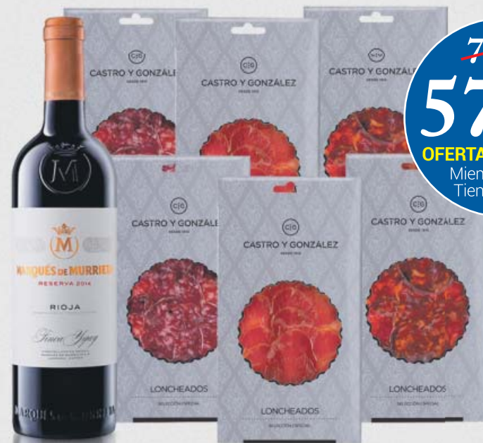
SELECCIÓN CASTRO Y GONZÁLEZ

72'18€ 57'81€ I.V.A. INCL. OFERTA EXCLUSIVA Miembros Club Tienda Gastro