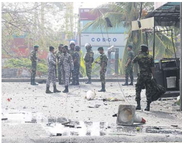
Soldados, ayer, tras la detonación de los explosivos.

Lo confirmó el alcalde de Pontecesures, municipio en el que residía la pareja. Ayer hubo otra explosión que no dejó víctimas