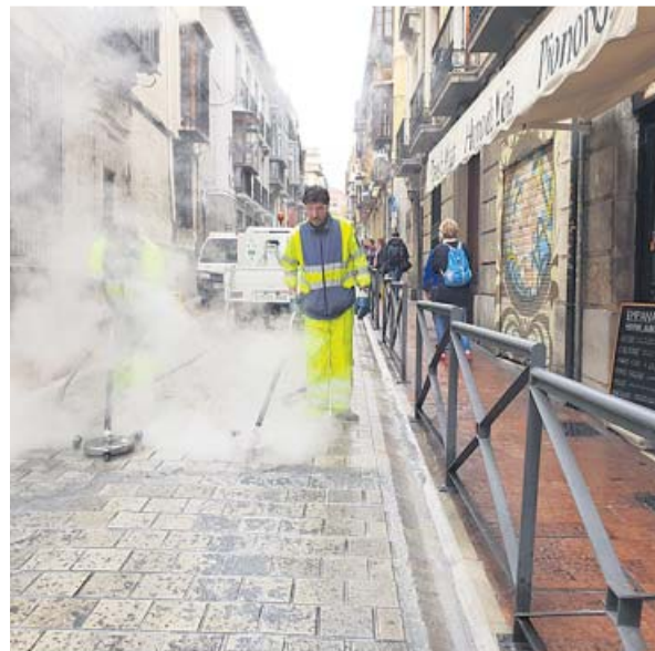
Operarios limpian la cera en una calle de la ciudad.