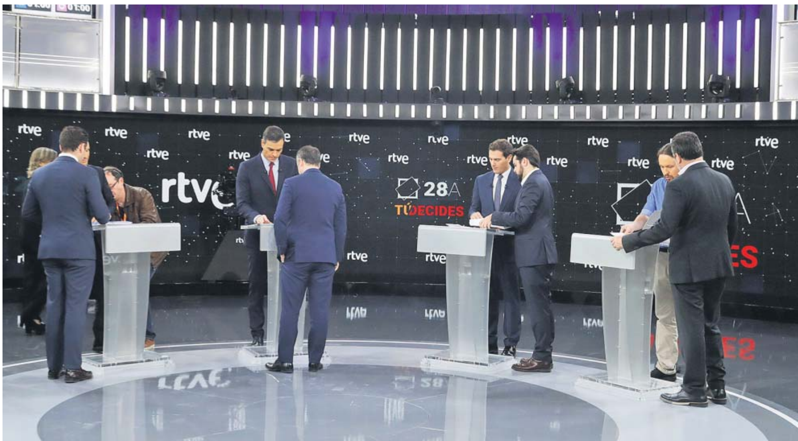
El orden de ubicación en el plató se decidió por sorteo. De izquierda a derecha, Casado, Sánchez, Rivera e Iglesias, con sus asesores antes del debate. EFE