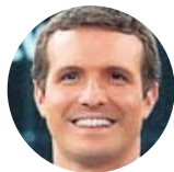
Pablo Casado Candidato del Partido Popular

«Sánchez es el favorito de quienes rompen España»