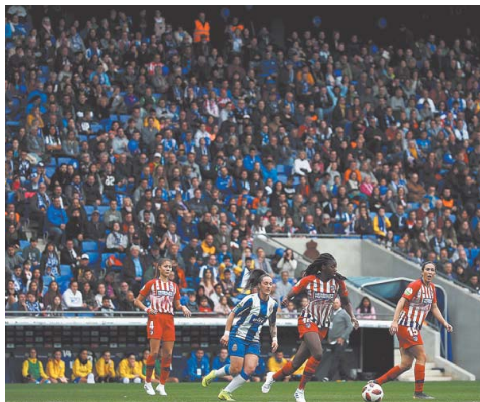
El RCDE Stadium, con gran afluencia de público para el Espanyol - Atlético.

En Mestalla, las malas condiciones meteorológicas estropearon en parte la fiesta. Y, pese a la amenaza de lluvia constante, casi 10.000 personas fueron a Mestalla para ver el derbi entre Valencia y Levante, que acabó con victoria visitante por 1-3. Banini adelantó a las levantistas, Jucinara empató, y Charlyn y Eva Navarro sentenciaron. ● R. R. Z.