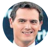
Albert Rivera Candidato de Ciudadanos

«Señor Sánchez, baje del Falcon, baje del avión. Aterrice»