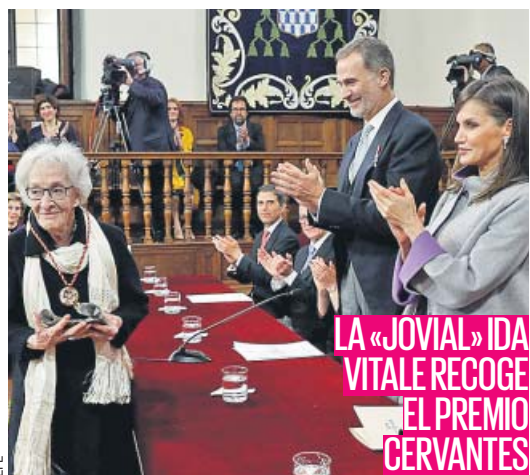
LA «JOVIAL» IDA VITALE RECIBE EL PREMIO CERVANTES

El presidente y el vicepresidente de la Junta hicieron ayer balance, aunque los primeros 100 días no se cumplen hasta el 2 de mayo. Ambos negaron que este adelanto tuviera tintes electoralistas y defendieron que ayer mismo se terminaron de aprobar las 21 medidas que pactaron para este periodo. Entre ellas, la limitación de mandatos a 8 años. PÁGINA 2