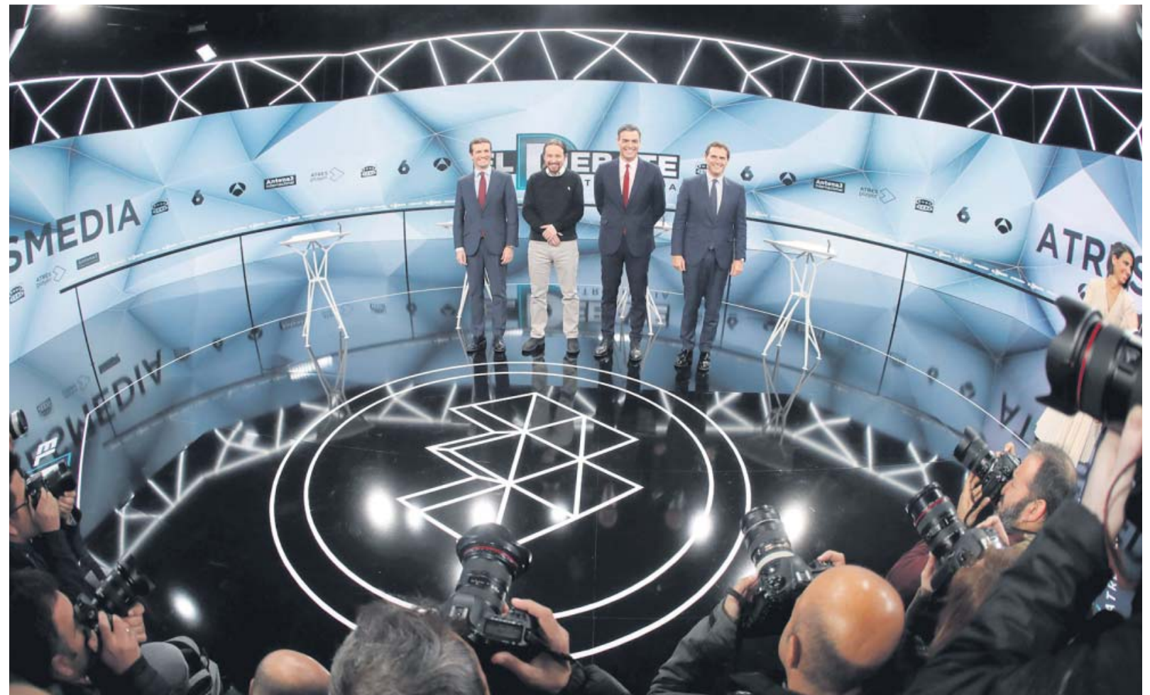
Casado, Iglesias, Sánchez y Rivera, anoche, posan al inicio del debate en el plató de Atresmedia.

En materia fiscal, el líder del PP insistió en su plan de relax fiscal, que cifró en 700 euros al año por contribuyente. «El debate no es bajar los impuestos, sino a quién», replicó Sánchez, que se comprometió a perseguir el fraude. Iglesias apostilló que él elevaría la presión sobre la