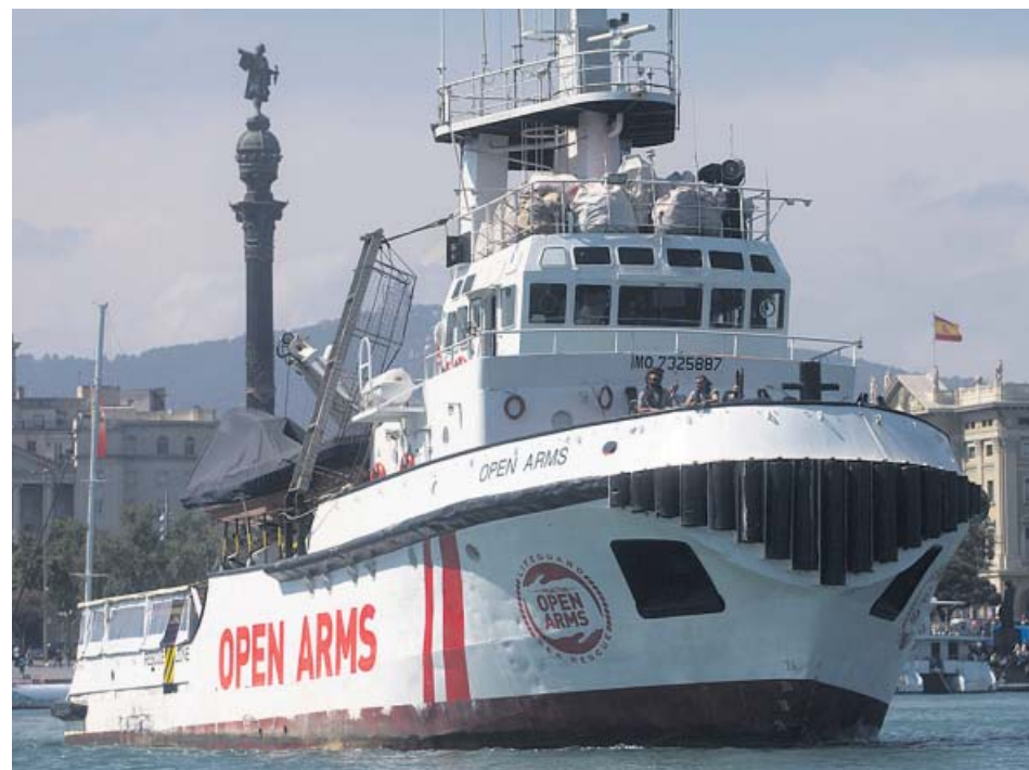
Fotografía del buque Open Arms ayer, a su salida del puerto de Barcelona.

El buque de la ONG Proactiva Open Arms zarpó ayer desde el puerto de Barcelona, donde llevaba bloqueado más de cien días, para llevar ayuda humanitaria a las islas griegas de Samos y Lesbos, pero no para participar en tareas de rescate de inmigrantes en el Mediterráneo central, aunque el jefe de operaciones aseguró a Efe que, si se encuentran una situación de emergencia, ayudarán como hacen «siempre». El buque traslada 20 toneladas de material humanitario entre ropa, comida, productos de higiene y material escolar. ●