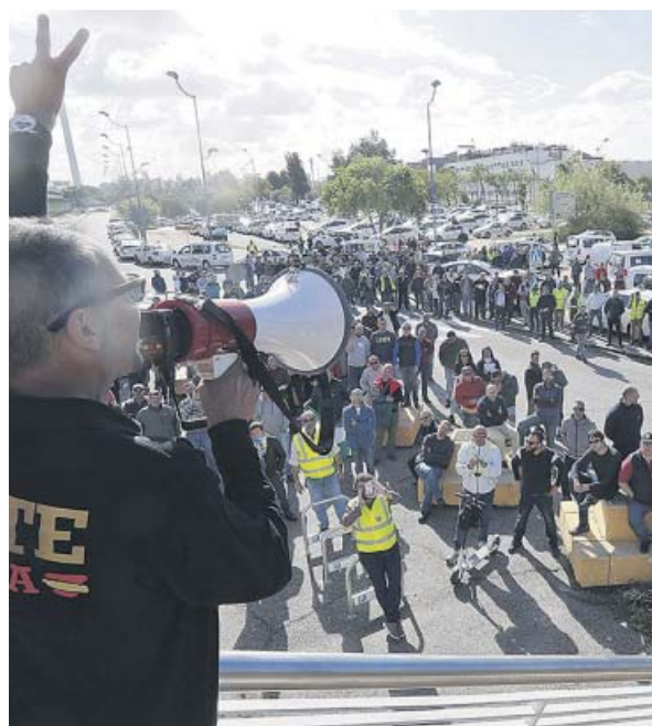
Taxistas en el inicio de la caravana, ayer.

Frente a la caravana de taxis, el viceconsejero de Fo-