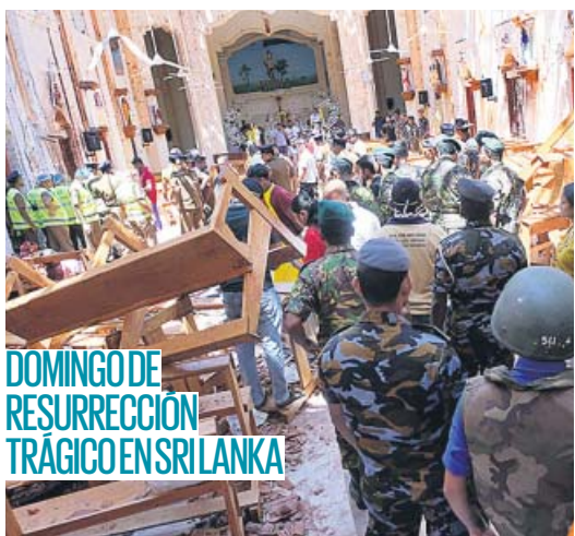
DOMINGO DE RESURRECCIÓN TRÁGICO EN SRI LANKA

La Federación Andaluza de Empresarios de Playa espera las nuevas licencias desde hace 15 años, cuando cumplieron las antiguas concesiones. Andalucía cuenta con un millar de chiringuitos, el 40% de ellos en la provincia de Málaga. Los establecimientos de playa dan trabajo a cerca de 30.000 personas, una cifra «estancada» desde hace varios años. PÁGINA 2