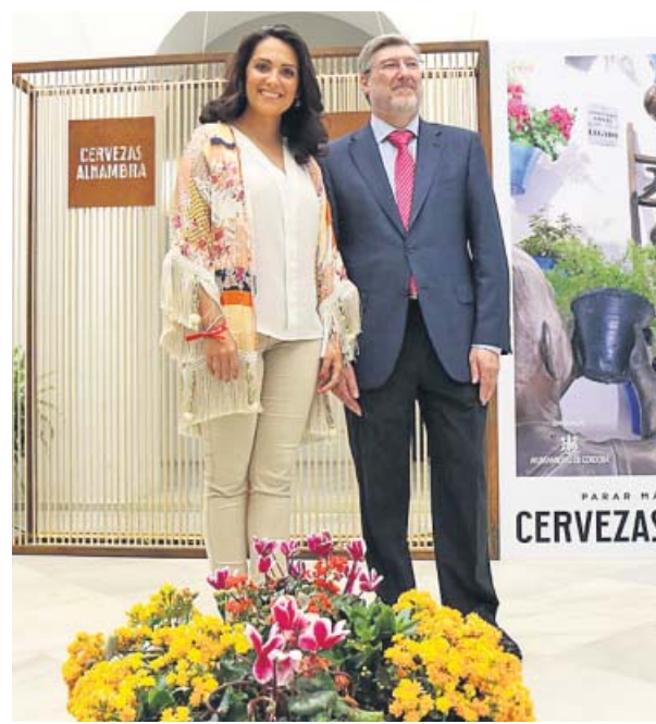
Presentación del Festival de los Patios, ayer.