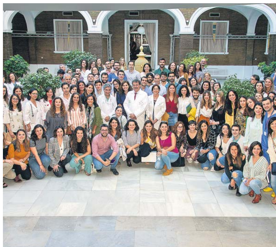
Foto de familia de los especialistas residentes del Virgen del Rocío de Sevilla. H.U.V.R.

Un juzgado de Sevilla ha condenado al responsable de una panadería a 1.080 euros de multa, tres meses de cárcel que quedan suspendidos, nueve meses de inhabilitación y una indemnización de 12.000 euros por causar ruidos que «por su frecuencia, intensidad y horario afectaron gravemente al descanso nocturno y tranquilidad» de una familia.