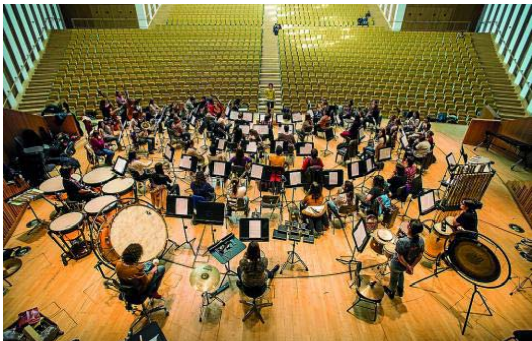
Ensayo de la orquesta de mujeres para el concierto del pasado 8 de marzo, por el Día de la Mujer.