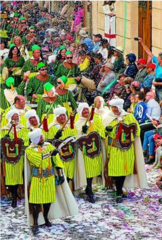
de Interés Turístico Internacional.