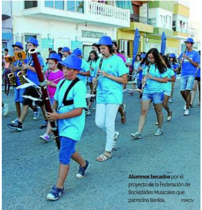
Alumnos becados por el proyecto de la Federación de Sociedades Musicales que patrocina Bankia. FSMCV

Musicales de la Comunitat Valenciana y sus 545 agrupaciones, en colaboración con la Generalitat Valenciana y CulturArts, con los que se han firmado dos convenios.