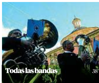
Todas las bandas