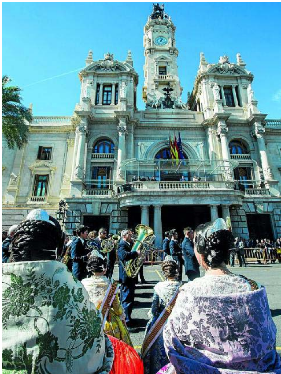
Falleras y músicos , en uno de los primeros actos falleros de este 2015, bajo el balcón del Ayuntamiento de Valencia.