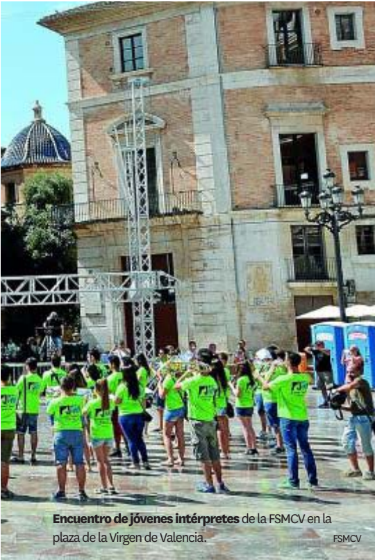
Encuentro de jóvenes intérpretes de la FSMCV en la plaza de la Virgen de Valencia.