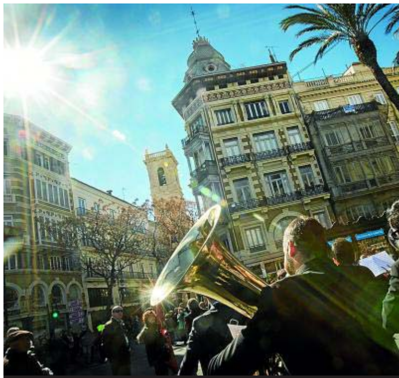
Sección de viento-metal de una de las bandas que participó en el encuentro entrando en la calle San

• Villahermosa del Río. Tel.: 964 382 541. snjpradasvillahermosa@fsmcv.org