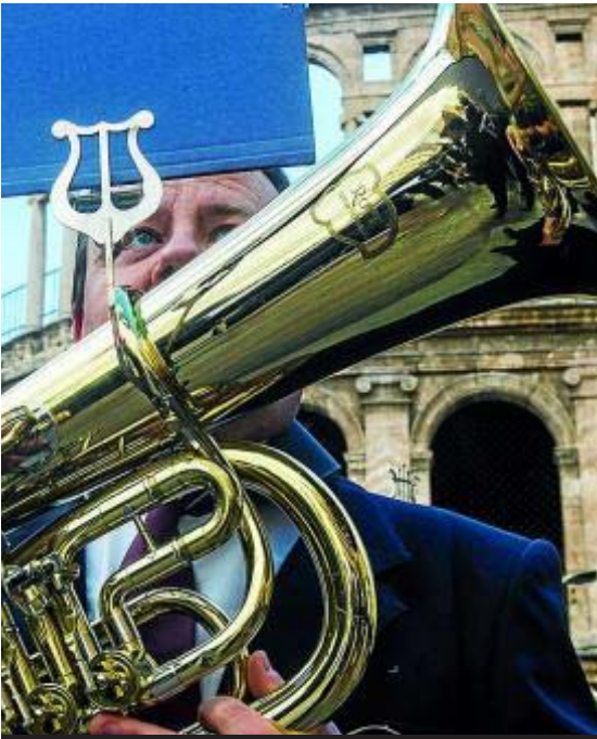
participaron en el encuentro de bandas de música, en la plaza de la Virgen.

Sociedad Unión Musical Alqueriense • Alquerías del Niño Perdido. Tel.: 964 511 617 y 678 383 628. unionmusicalalqueriense@gmail.com