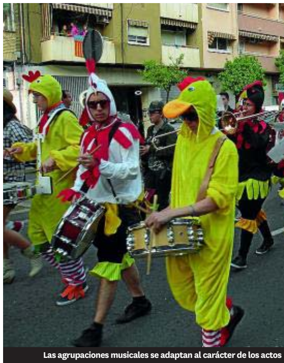
Las agrupaciones musicales se adaptan al carácter de los actos

Societat Musical l'Om de Picassent • Picassent. Tel.: 662 308 140, 647 748 226 y 662 308 170. societatmusical_om@hotmail.com, smlompicassent@fsmcv.org