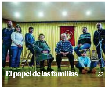
El papel de las familias