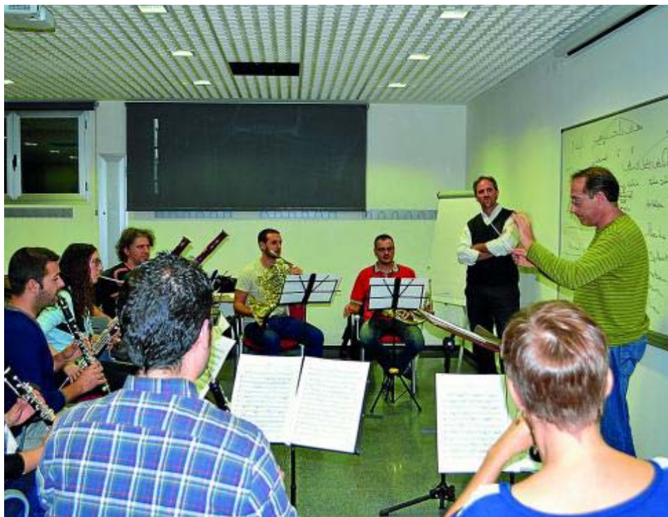
La educación musical mejora la adquisición de competencias básicas de los estudiantes.