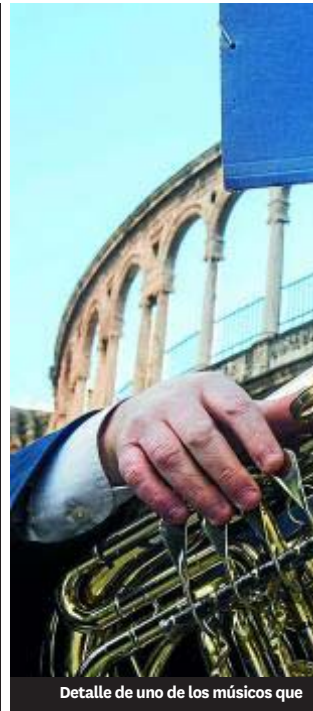
Detalle de uno de los músicos que

Agrupació Artístico Musical El Trabajo de Xixona • Xixona. Tel.: 965 611 953. bandadexixona@gmail.com