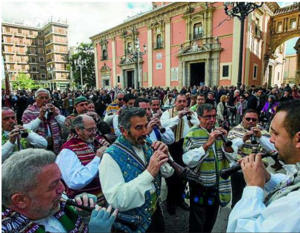
Grupo de tabal y dulzaina, durante la XII Entrada de Bandas de Música de Valencia, celebrada el pasado 22 de febrero.

Escuela de Música Ciudad de Elche • Elche. Tel.: 659 437 824. academiademusicaciudaddeelche@hotmail.com