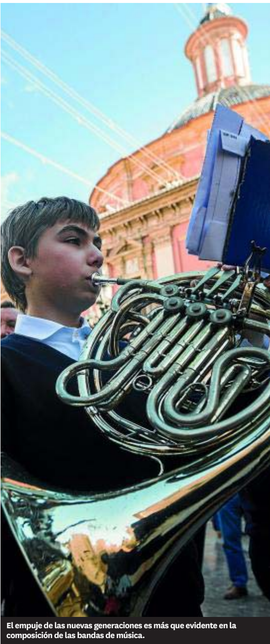
El empuje de las nuevas generaciones es más que evidente en la composición de las bandas de música.

Granja de la Costera. Tel.: 625 027 794. tonigil@hotmail.com