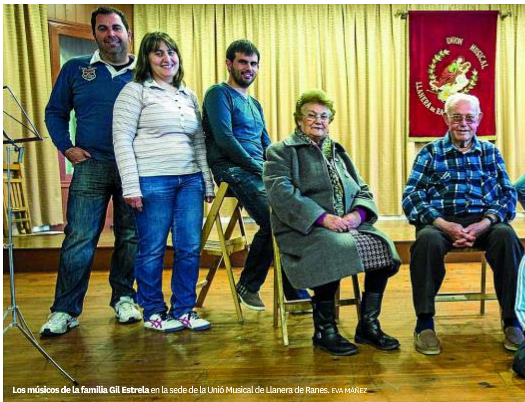
Los músicos de la familia Gil Estrela en la sede de la Unió Musical de Llanera de Ranes. EVA MÁNEZ