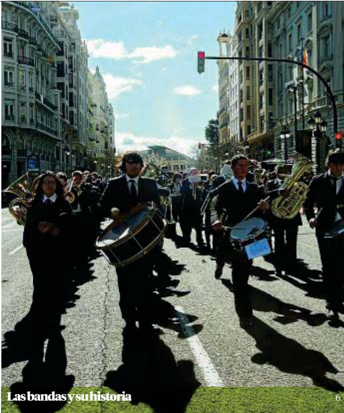
Las bandas y su historia