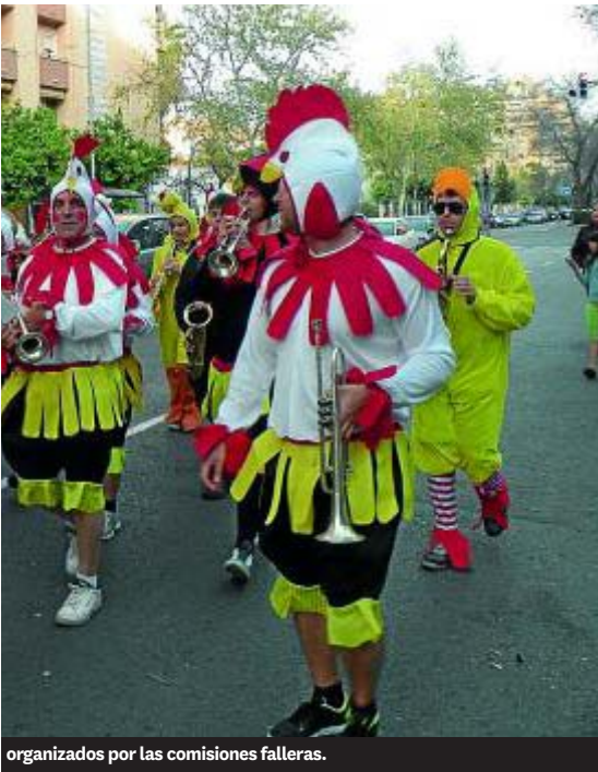
organizados por las comisiones falleras.