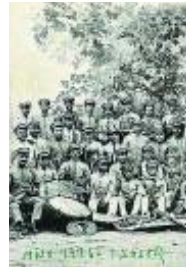
Imágenes históricas de El Clarín, nombre popular de la Banda Primitiva de Lliria.

A mediados del siglo XIX, después de una dura jornada en el campo o en la fábrica, la pertenencia a una banda suponía prácticamente la única opción de ocio y, además, una alternativa a otro tipo de entretenimientos menos constructivos. Los casinos, pero también las iglesias, eran un escenario