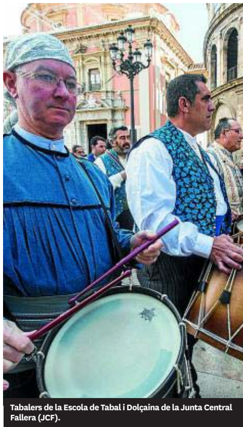
Tabaleros de la Escuela de Tabal i Dolçaina de la Junta Central Fallera (JCF).

Sociedad Musical Unión de Pescadores • Valencia. Tel.: 963 728 360. elcasi.net@hotmail.com