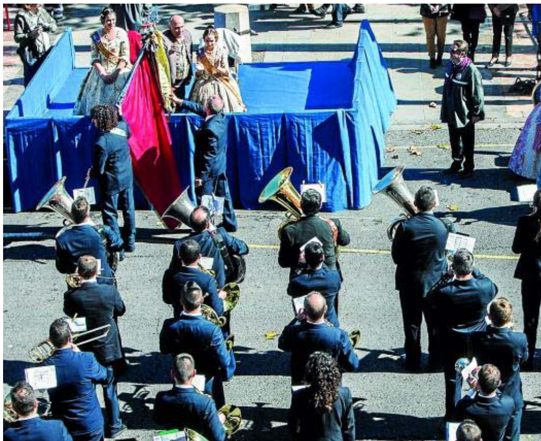
Las fiestas falleras de este 2015 se abrieron, el pasado 22 de febrero, con un pasacalles de bandas que recorrió las principales vías

>>> bandas de música solo supone una inversión del 1,45% del total del gasto que se realiza en Fallas. Las formaciones que desfilarán estos días por la capital y también por las calles de numerosas poblaciones de Alicante, Castellón y Valencia son cada vez menos y las que resisten han visto muy diezmados sus componentes.