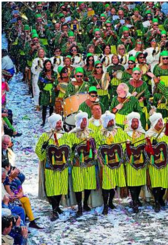
Los Moros y Cristianos de Alcoy están reconocidos como Fiestas

Por otro lado, los pasodobles, que también están muy extendidos en estas celebraciones, son marchas ligeras, adaptadas al paso