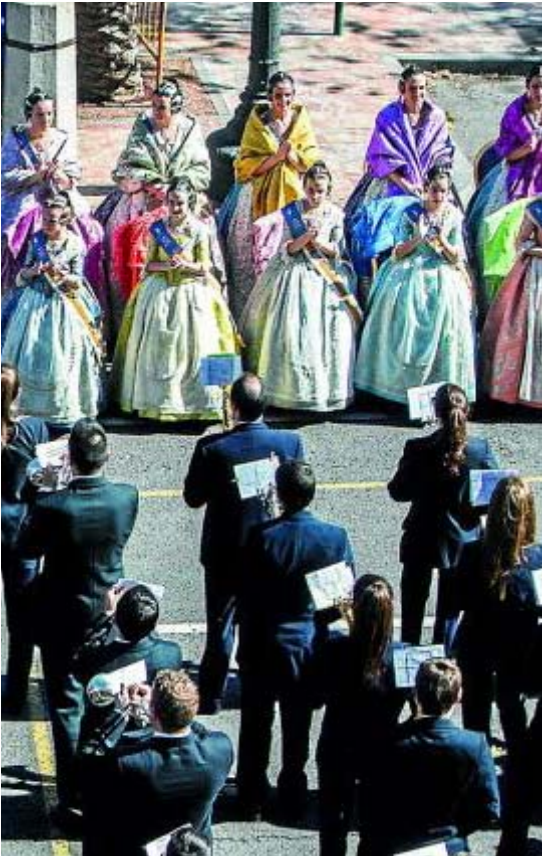
de la ciudad antes de la Crida.