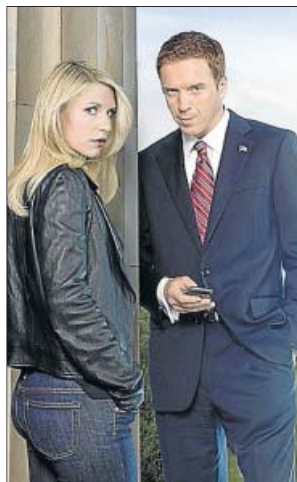
Claire Danes y Damian Lewis protagonizan Homeland . CUATRO

La irrupción de Homeland en Cuatro ha supuesto una mejora sensible de su audiencia el miércoles por la noche, aunque en comparación con el resto de las cadenas, su seguimiento sigue siendo minoritario. La serie alcanzó en su estreno un 12,6% de share (2,1 millones de televidentes). Actualmente se mueve en una horquilla de entre el 8,1 y el 10,7% de cuota de pantalla, muy lejos de Con el culo al aire (Antena 3) y Hay una cosa que te quiero decir (Telecinco), sus rivales la noche de los miércoles.