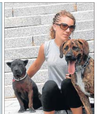
Fosco, Pelusa, Gandúl, Brando y Brenda, Sugar, Eddi... Son solo algunos de los perros que podrás encontrar en nuestras fotogalerías.