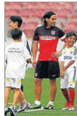
Falcao hizo ayer de profesor para los niños en Singapur.

La plantilla del Atlético de Madrid completó ayer su primer entrenamiento en Singapur e impartió un clínic a 118 niños en su segundo día de estancia en el país asiático, donde hoy disputará un partido amistoso contra una se-