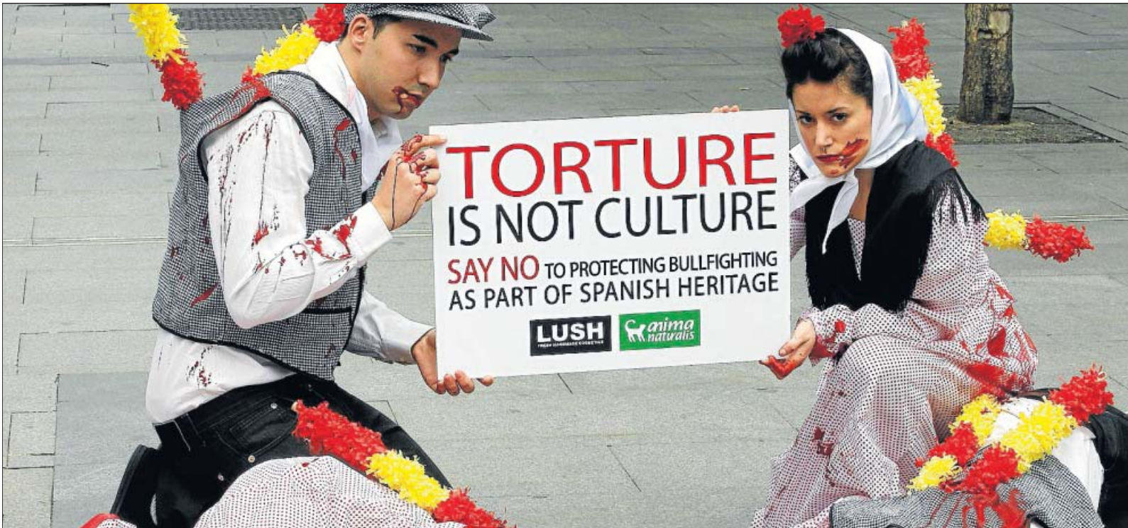
CHULAPOS CONTRA LAS CORRIDAS DE TOROS. Miembros de Anima Naturalis vestidos de chulapos celebraron ayer una protesta en la que fueron «banderilleados» para pedir un San Isidro libre de crueldad animal y exigir al Gobierno que los toros no sean Bien de Interés Cultural.

ALCORCÓN Memorial de Bomberos. El 9 de junio se disputará la XXVI edición del Memorial de Bomberos. La convocatoria se verá reforzada con un fin solidario, como es la recogida de alimentos para familias necesitadas.