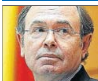
Pío García Escudero

Presidente Senado ▶ Cobró sobresueldos de 4.200 €/mes entre 1999 y 2003. Negó que fuera una práctica generalizada.