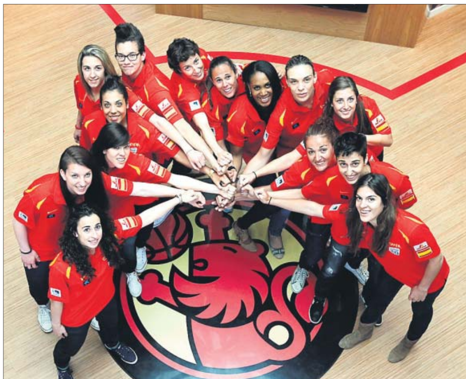
La selección femenina de baloncesto que participará en el Europeo de Francia.