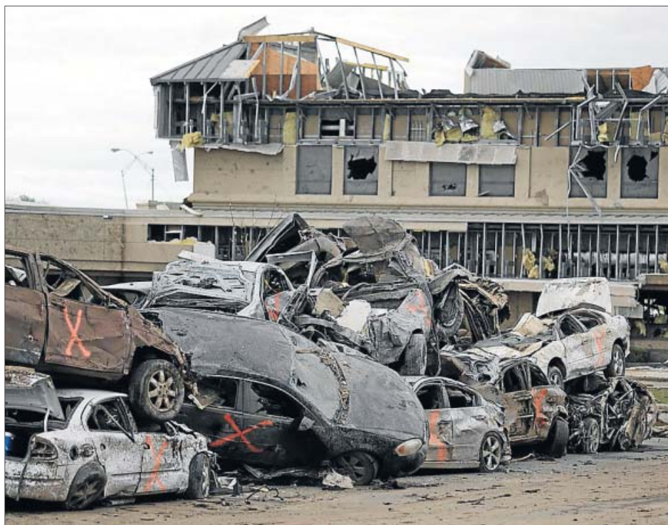
Coches y edificios arrasados por el tornado, en los barrios del sur de la ciudad de Oklahoma.

... en Madrid hubo 47 muertos en 1886 por un tornado de categoría EF3?