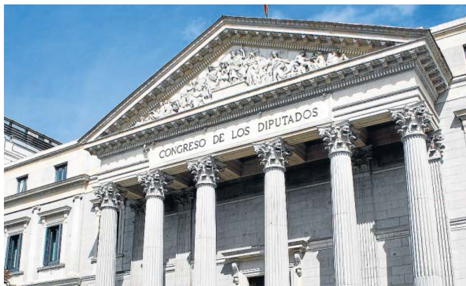
El Congreso de los Diputados debate hoy la modificación de la Ley de Propiedad Horizontal.