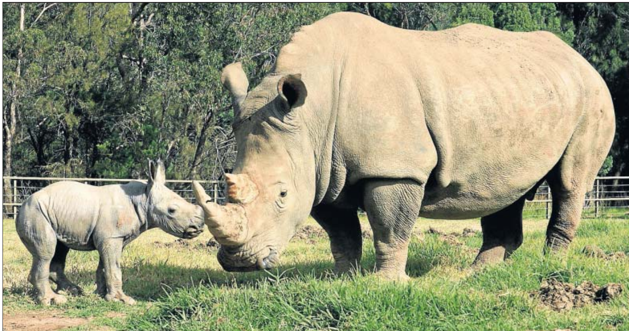
'MOPANI' YA JUEGA CON SU CRÍA. Una cría de rinoceronte blanco, todavía sin nombre, que nació la semana pasada en cautividad, juega junto a su madre, Mopani, en el zoológico Taronga Western Plains, a unos 400 kilómetros al noroeste de Sídney (Australia). En un año han sido asesinados 300 especímenes de esta especie por cazadores furtivos.