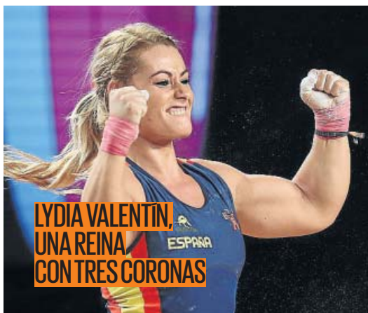
LYDIA VALENTÍN UNA REINA CON TRES CORONAS

MADRID MARTES, 5 DE DICIEMBRE DE 2017. AÑO XVIII, Nº 4070 www.20minutos.es