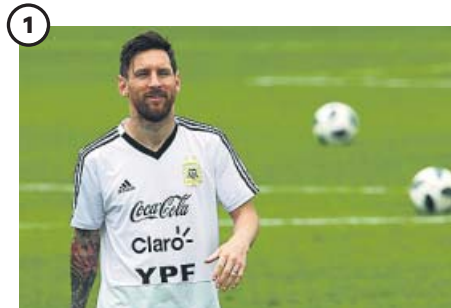
1 Leo Messi Su último tren para ser campeón con Argentina, que se entrena en Bronnitsy, un pueblo cerca de Moscú. Debuta el sábado ante Islandia.