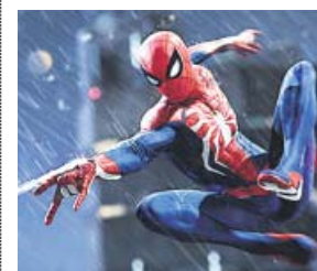
Spider-Man Insomniac Games / Sony Plataforma: PlayStation 4

Más de una década han esperado los fans de este universo, que mezcla la magia de Final Fantasy con la de Disney, para descubrir cómo continúan las aventuras de Sora, Goofy y Donald. En esta nueva epopeya de rol y acción, los héroes visitarán, entre otros, los mundos de Frozen , Toy Story , Hércules , Piratas del Caribe y Monstruos S. A. El juego, en desarrollo desde 2006, saldrá por fin el 29 de enero de 2019.