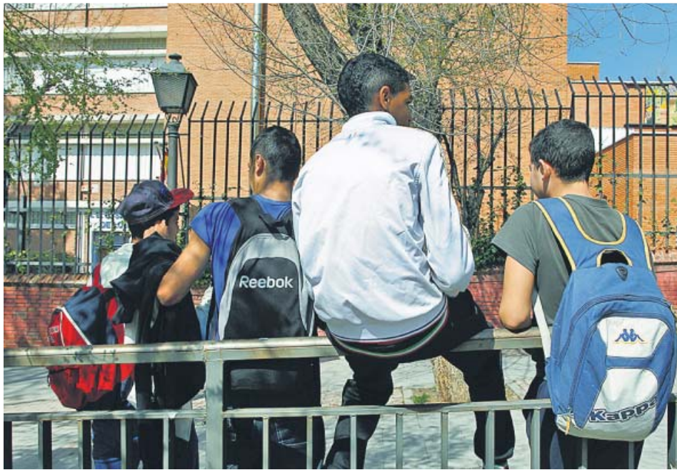
Alumnos en la puerta de un instituto.

Las familias piden revisar el adelanto de las recuperaciones de exámenes a junio, porque deja a miles de estudiantes de la ESO y Bachillerato sin actividad lectiva