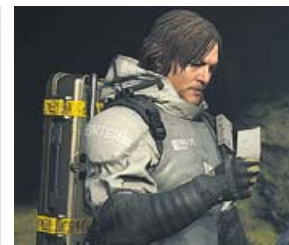
Death Stranding (2019) Kojima Productions / Sony Plataforma: PlayStation 4

Microsoft recupera su franquicia más icónica con tres nuevos lanzamientos: el juego de estrategia por turnos Gears Tactics ; el título para móviles Gears Pop , protagonizado por las versiones de muñecos Funko de los héroes; y esta quinta entrega, una historia de acción que destaca por el cambio en el diseño artístico, la introducción de características de mundo abierto y Kait Díaz de protagonista.