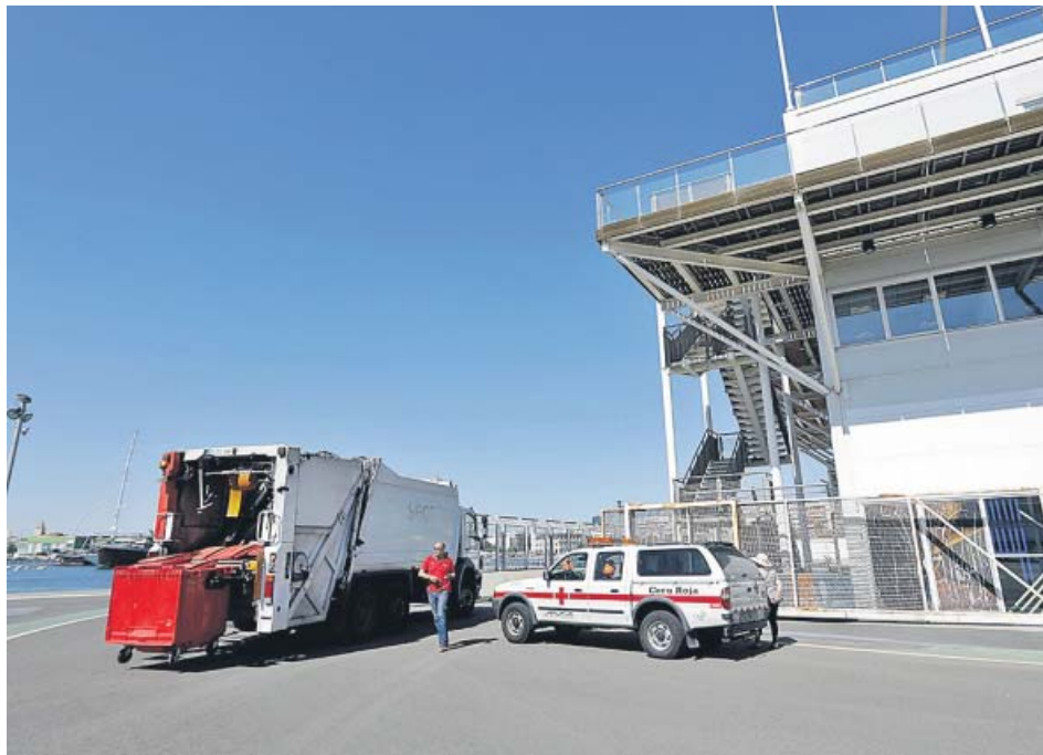
Un equipo de la Cruz Roja se traslada a la antigua base del equipo de Copa América Alinghi.