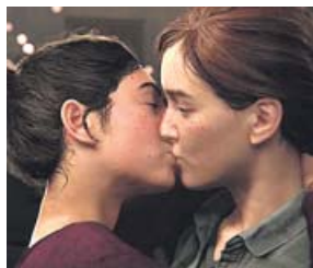
Last of Us 2 (2019) Naughty Dog / Sony Plataforma: PlayStation 4

La secuela de Last of Us , uno de los juegos más aclamados de PS3, repite fórmula. Esto es, una aventura de acción, sigilo y supervivencia, con desarrollo cinematográfico, en un mundo posapocalíptico. Ha acaparado la atención la escena del beso entre Ellie, la protagonista, y otra chica. Muchos ya lo consideran el mejor beso jamás visto en un videojuego, pero no han faltado los comentarios homófobos.