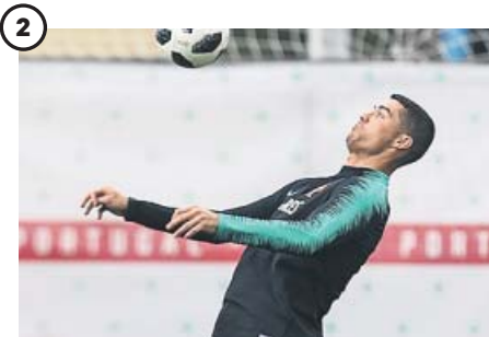
2 Cristiano Ronaldo También puede ser la última oportunidad para el portugués, rival mañana de España. Los lusos están concentrados al lado de Moscú.