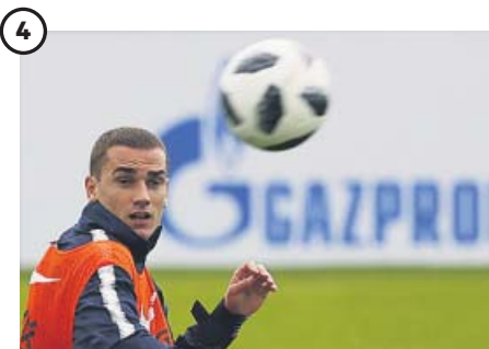
4 Antoine Griezmann El hasta la fecha delantero del Atlético se ha convertido en el líder de la Francia de Deschamps, que debuta el sábado con Australia.