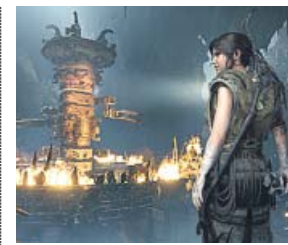
Shadow of the Tomb Raider Eidos Montreal / Square Enix Plataformas: PS4, Xbox One y PC

Este videojuego protagonizado por Norman Reedus (Daryl en The Walking Dead ), Mads Mikkelsen y Léa Seydoux es el primero que hace Hideo Kojima, el prestigioso creador de Metal Gear Solid , al margen de la compañía Konami. En este E3 se ha mostrado su jugabilidad por primera vez. Parece una aventura de exploración con tintes de terror, pero es tan extraño que nadie parece tener claro de qué va.