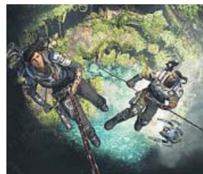
Gears of War 5 (2019) The Coalition / Microsoft Plataformas: Xbox One y PC

La secuela de Last of Us , uno de los juegos más aclamados de PS3, repite fórmula. Esto es, una aventura de acción, sigilo y supervivencia, con desarrollo cinematográfico, en un mundo posapocalíptico. Ha acaparado la atención la escena del beso entre Ellie, la protagonista, y otra chica. Muchos ya lo consideran el mejor beso jamás visto en un videojuego, pero no han faltado los comentarios homófobos.