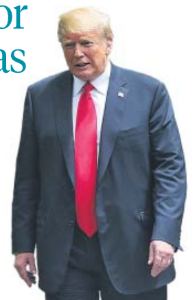
DONALD TRUMP Presidente de Estados Unidos

«Nuestro mayor enemigo son las noticias falsas proclamadas por tontos»