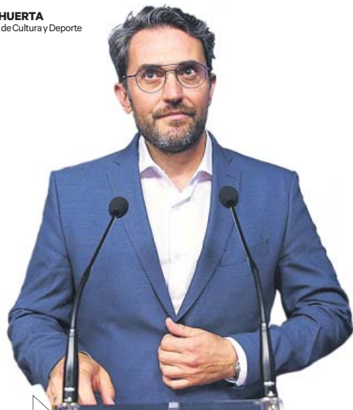
MÁXIM HUERTA Exministro de Cultura y Deporte

«Me voy para que el ruido de toda esa jauría no parta el proyecto que ha ilusionado al país»