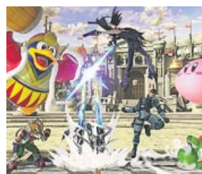
Super Smash Bros. Ultimate Nintendo, Sora y Bandai Namco Plataforma: Nintendo Switch

La prolífica saga viaja a la Antigua Grecia, concretamente a la Guerra del Peloponeso, que enfrentó a Esparta y Atenas en el siglo V a. de C. El jugador, que se encontrará con personajes de la época como Sócrates, podrá ahora tomar decisiones durante los diálogos, que llevarán la historia en una dirección u otra. Habrá más elementos de RPG y mejoras en los combates y la navegación. Saldrá el 5 de octubre.