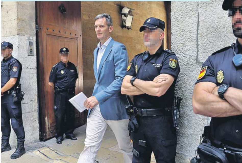
Iñaki Urdangarin sale de la Audiencia de Palma con la orden de ingreso en prisión.

El tribunal le dio ayer la orden de ingreso en cinco días, que le deja viajar hasta entonces. Matas se presentó en una cárcel de Madrid