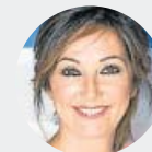
CRISTINA CIFUENTES Expresidenta de la Comunidad de Madrid