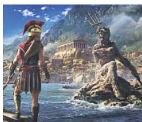
Assassin's Creed Odyssey Ubisoft Plataformas: PS4, Xbox One y PC

Cierre de la trilogía sobre los inicios de Lara Croft como aventurera. En esta ocasión, la joven recorrerá países como México y Perú en su búsqueda de los secretos ocultos en las leyendas del apocalipsis maya. Eso conllevará, claro, peleas, tiroteos, saltos, persecuciones, momentos de sigilo, resolución de rompecabezas, rastreo de cada palmo de los escenarios... Verá la luz el 14 de septiembre de este año.