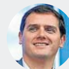
PABLO IGLESIAS Secretario General de Podemos

«En seis días le dimite un ministro a Sánchez. Llegar a la Presidencia a cualquier precio fue una mala decisión»