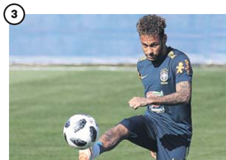
3 Neymar Brasil deposita todas sus esperanzas en la estrella del PSG, ya recuperado de su lesión. La Canarinha se estrena el domingo ante Suiza.