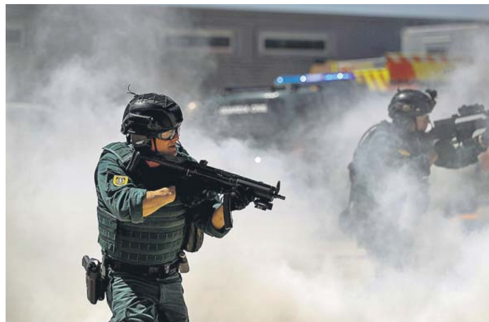
Más de 300 personas participaron en el simulacro de emergencias y atención sanitaria.

Agentes de la Policía Nacional han detenido al encargado de una discoteca como presunto autor de un delito de detención ilegal tras retener a una treintena de menores de edad en el interior de la misma cuando se estaba celebrando una fiesta privada, informó la Jefatura Superior de Policía de Madrid. Fuentes de la investigación señalaron que la discoteca donde se estaba celebrando esta fiesta es 'Rosa Blue', en Moratalaz, y que su responsable está acusado de haber cerrado las puertas del local para evitar que los agentes que patrullaban por la zona observaran a los menores en el interior del establecimiento. Los hechos ocurrieron durante el pasado fin de semana, cuando un grupo de jóvenes estaba celebrando una fiesta privada. ●