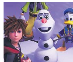
Kingdom Hearts III Square Enix Plataformas: PS4 y Xbox One

La mitad de la presentación de Nintendo se centró en este alocado crossover de lucha que enfrenta a figuras tan populares como Mario, Sonic, Pac-Man, Zelda, Bayonetta, Pikachu o Ryu, entre otros. Esta vez, la compañía ha logrado incluir a todos los personajes que han aparecido alguna vez en la saga, con alguna nueva incorporación. En total habrá más de 65 combatientes. Llegará el 7 de diciembre.