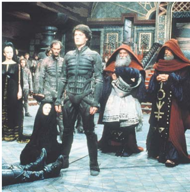
Fotograma de la película Dune, de David Lynch (1984).

Teniendo en cuenta la densidad de la obra y los numerosos fans que ha ido atrayendo, Denis Villeneuve no lo tiene fácil, aunque ha estado a la altura en los dos recientes largometrajes de ciencia ficción que ha dirigido: La llegada y la secuela de Blade Runner ( Blade Runner 2049 ). El rodaje está previsto que empiece en febrero de 2019