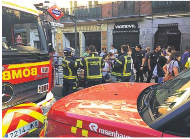
Bomberos en la boca de metro de Príncipe de Vergara. EMERGENCIAS

Como consecuencia del incidente se generó gran cantidad de humo en los vagones y el tren al completo tuvo que ser evacuado entre los nervios ante un posible atentado. A pesar de las escenas de tensión y des-