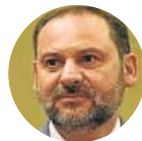
José Luis Ábalos Ministro de Fomento

«Si todo el diálogo queda dentro de la legalidad, evidentemente el diálogo hay que seguirlo»