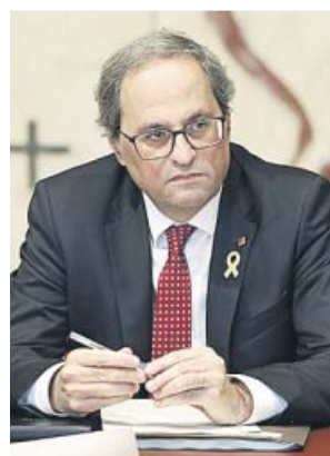
Torra a su llegada ayer a la reunión del Govern.

más de lo previsto. No habría superdomingo electoral el 26 de mayo y los barones socialistas, algunos de los cuales se levantaron la semana pasada