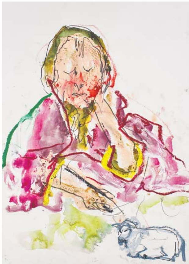
Obra inspirada en Meditaciones de S. Juan Bautista , del Bosco.

Armado sencillamente con lápices, pinturas pastel y acuarelas sobre papel de 70 x 50 cm, el autor devuelve al museo su sentido primigenio: el de ese lugar mágico donde las musas campan a sus anchas y donde, ahora, el pasado dialoga con el presente a través de