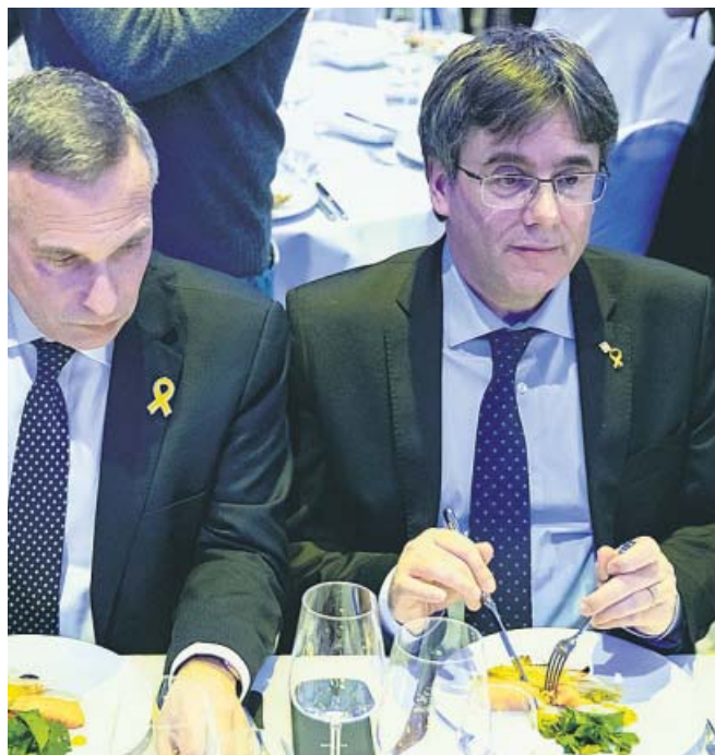
Carles Puigdemont, ayer, en la cena Cinema for Peace .

Mientras los líderes independentistas se preparan para iniciar hoy el juicio del procés , Carles Puigdemont, huido de la justicia española, estuvo ayer en Berlín en una cena de gala organizada por la fundación Cinema for Peace , paralela a la Berlinale, el festival de cine de la capital alemana. Puigdemont explicó que acudió a ese evento para «dar voz» a sus compañeros «que se enfrentan a un juicio completamente injusto» y para «denunciar su situación». ●