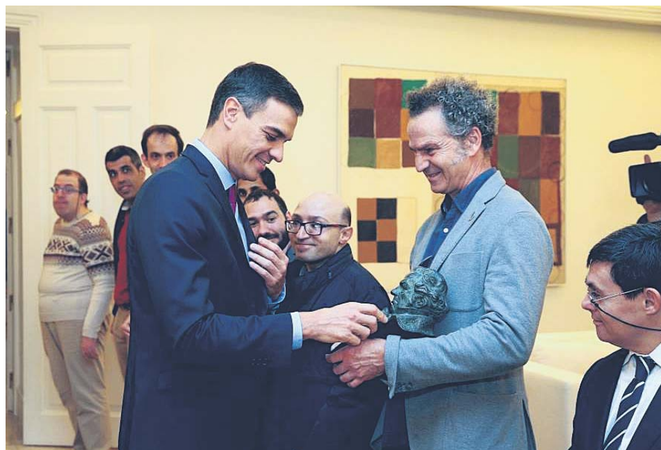
Pedro Sánchez recibió ayer en Moncloa al equipo de la película Campeones.