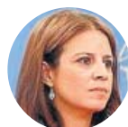
Adriana Lastra Portavoz del PSOE en el Congreso «Espero altura de miras, que al menos la mayoría de 350 diputados apoyen los Presupuestos»

«Si todo el diálogo queda dentro de la legalidad, evidentemente el diálogo hay que seguirlo»