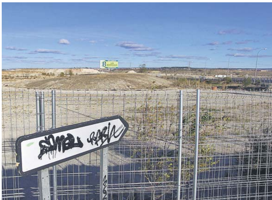
Las primeras viviendas podrían empezar a construirse en Los Berrocales en 2020.

La mayor parte de las viviendas se desarrollarán en el ámbito de Los Berrocales, en el distrito de Vicálvaro, donde se concentra la mayor bolsa de pisos del sur de la ciudad. En total, en el convenio entre el Ayunta-