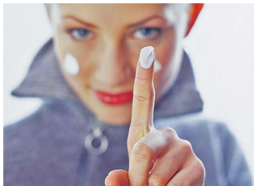
En esta época podemos notar la piel más seca, que se desescama y con dermatitis.

Puedes consultar más información sobre la eutanasia a través de nuestra página web 20minutos.es