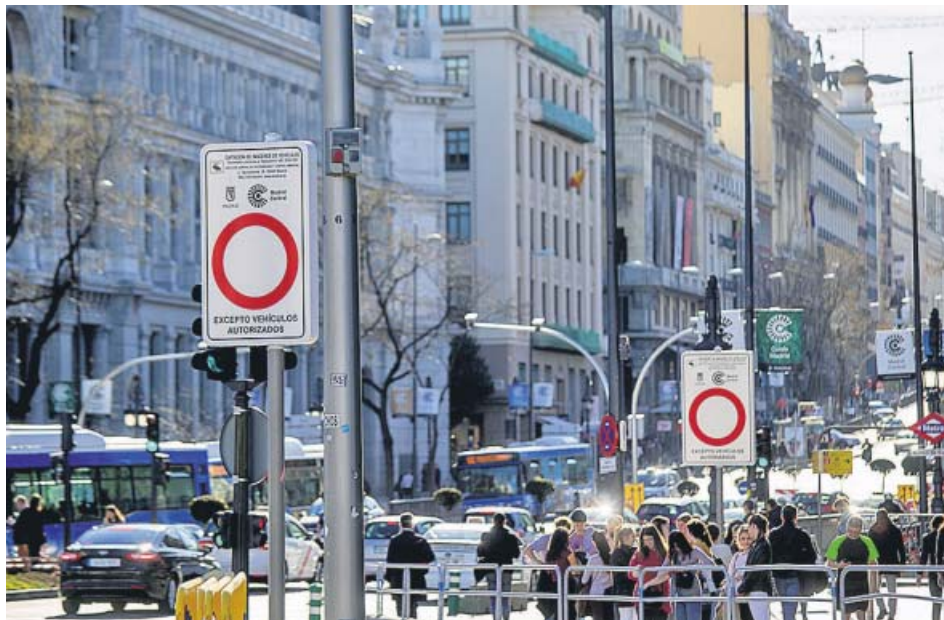
Entrada al área de Madrid Central en la plaza de Cibeles, ayer. ELENA BUENAVISTA

El Ayuntamiento de Madrid comenzará mañana a multar a los conductores que accedan sin tener autorización a Madrid Central, la gran área de prioridad residencial del distrito Centro. El incumplimiento conllevará una multa por infracción leve como las que se aplicaban en las antiguas APR (Área de Prioridad Residencial). Por tanto, la sanción será de 90 euros, aplicando una reducción hasta los 45 euros si hay pronto pago. La medida para intentar mejorar la calidad del aire de la ciudad se puso en marcha el pasado 30 noviembre en fase de pruebas, por lo que hasta ahora las personas que accediese con su coche al centro no era sancionadas, aunque sí han recibido una carta en sus domicilios informándoles de que había cometido una infracción. Hasta finales del pasado mes de febrero, unas 14.000 personas habían entrado sin permiso en el área de Madrid Central sin que el Consistorio les hubiese impuesto sanciones económicas. ●