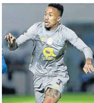
Éder Militao, en un partido con el Oporto este año.

El Real Madrid no quiere dejarlo todo para el verano, y sigue reconstruyendo el equipo para la próxima temporada. Si el lunes se presentó el encargo de comandar el nuevo proyecto con el regreso de Zinedine Zidane, ayer se hizo oficial el primer fichaje, Eder Militao, un joven central brasileño que llega del Oporto a cambio de 50 millones de euros.