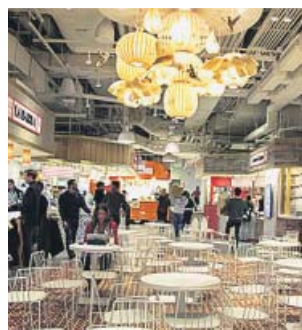
Así es el nuevo Mercado Little Spain.

«[Queremos] vender España a través de su cultura» y «mostrar nuestra manera de vivir», puntualiza Adrià, que junto con José Andrés se encuentra en Nueva York para asegurarse de que todo esté a punto antes de la apertura.