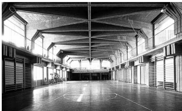
Corona de Espinas de Ciudad Universitaria (Madrid), 1965-85. Debajo, Higuera en el Hotel Las Salinas de Costa Teguiise (Lanzarote, 1973-77) y Colegio Estudio de Aravaca, 1962-64.