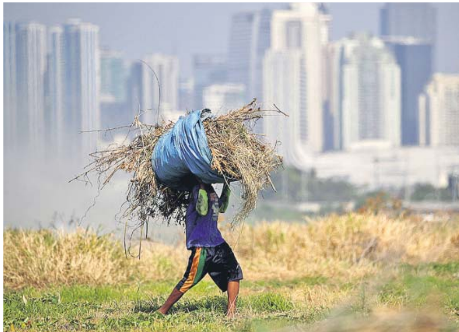
Un agricultor carga con hierba seca en Filipinas.

Los efectos de la sequía también se sienten en áreas urbanas, especialmente en Manila, donde más de 1,2 millones de viviendas sufren cortes de agua de hasta 20 horas. Hay distritos donde no tienen agua durante cuatro días. ●