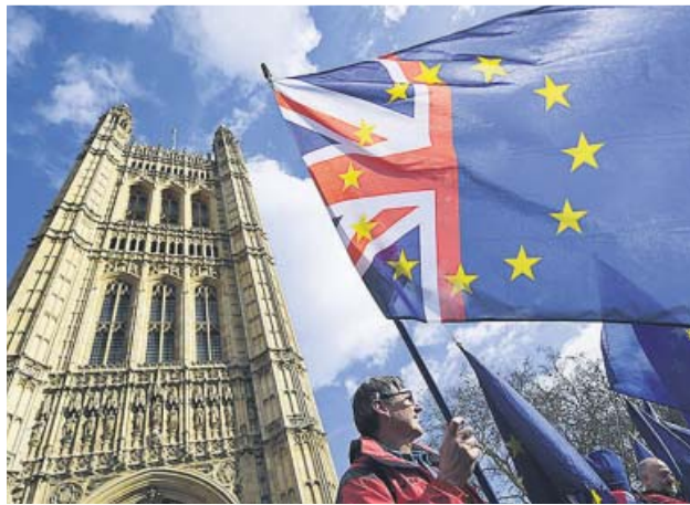
Un manifestante antibrexit , fuera del Parlamento.

El texto en el que Theresa May solicitaba a la UE una extensión de tres meses —siempre y cuando el 20 de marzo el Par-