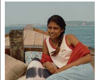
Hansen-Løve cambia París por la luz de la India. GOLEM

Tras hacer una película sobre una mujer que se encuentra a sí misma al liberarse de las ataduras del romance ( El porvenir ), a Hansen-Løve le apetecía retratar a alguien con los