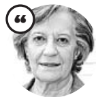
VICTORIA CAMPS Filósofa y escritora

«Los bienes materiales son precarios y, por lo tanto, no son la mejor manera para acercarse a la felicidad»