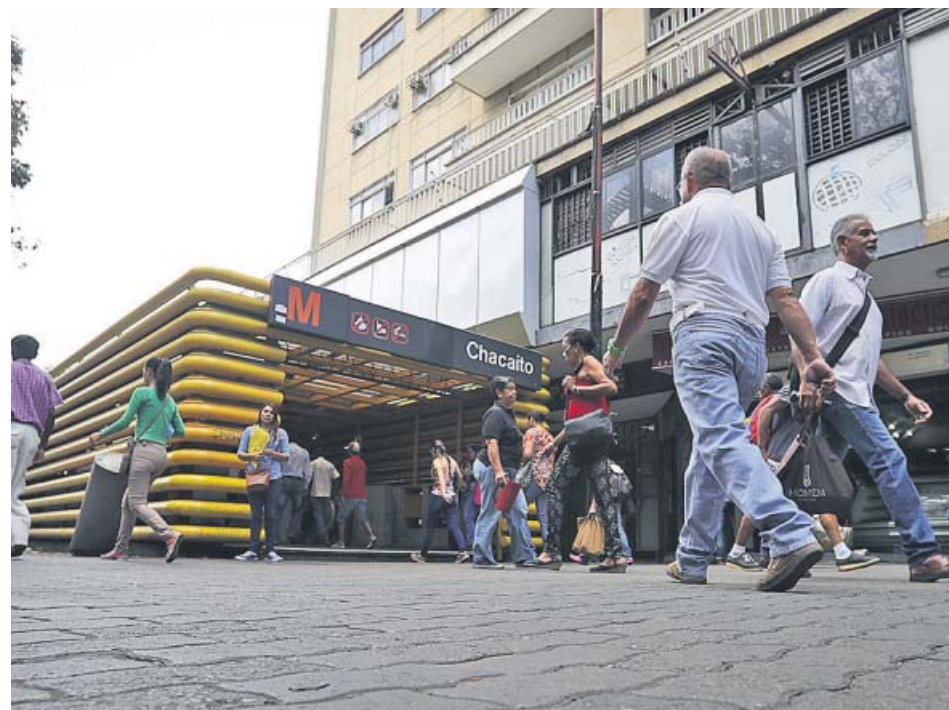
Un grupo de venezolanos camina cerca de una estación del metro de Caracas.

El servicio eléctrico en Venezuela ya está restablecido y el 80% del territorio ya recibe agua potable, según anunció el Gobierno de Maduro. Después del apagón que duró una semana, los venezolanos comenzaron ayer a reanudar sus actividades laborales. El principal productor de alimentos de Venezuela, Polar, ha declarado pérdidas superiores a los cinco millones de dólares por saqueos y el gremio de los ganaderos registró también la misma cantidad de pérdidas. ●