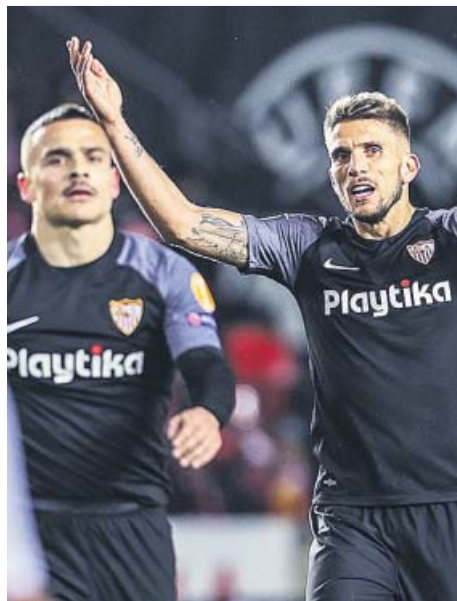
Celebraciones de Valencia y Villarreal; decepción en el Sevilla.