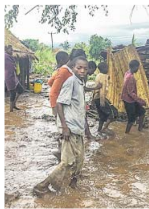
Chiluvi (Mozambique), tras el paso del ciclón Idai.

Se espera que estos números suban en los tres países, donde 1,6 millones de personas vi-