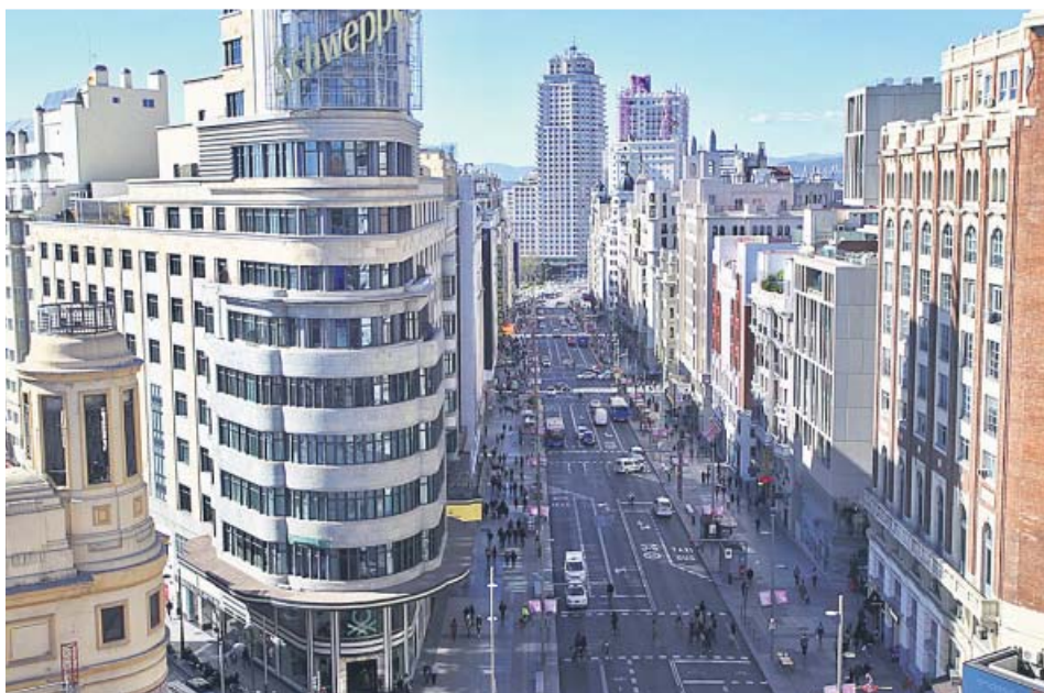
Tramo de la Gran Vía entre Callao y Plaza de España, en la tarde de ayer.

EL 71,6% de los madrileños asegura que no irá al centro en coche para evitar sanciones AGENTES de movilidad dicen que los ciudadanos tienen aún dudas con Madrid Central