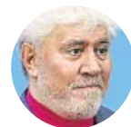
PEDRO ALMODÓVAR Sobre su película Dolor y gloria

«Yo no estoy tan mal como el protagonista (...). Nunca he tomado caballo, ni ahora ni en su momento»