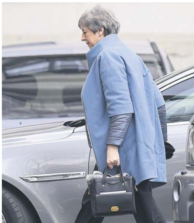
La premier británica, Theresa May, ayer junto a su residencia.