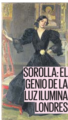
SOROLLA: EL GENIO DE LA LUZ ILUMINA LONDRES

El organismo ha dado otras 24 horas al presidente del Govern antes de tomar medidas en caso de una nueva desobediencia. PÁGINA 4