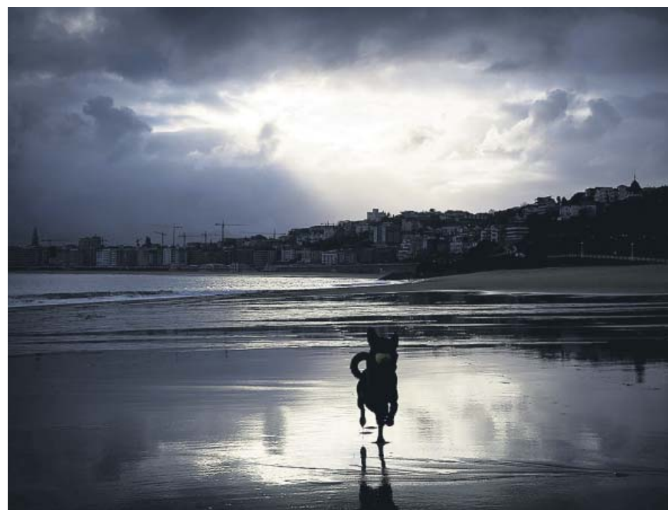
Un perro, ayer, corriendo por una playa de San Sebastián, con el cielo nuboso.