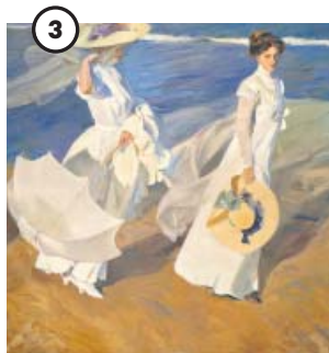
FUNDACION MUSEO SOROLLA, MADRID