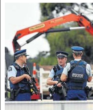
Policías en el Cementerio Memorial de la ciudad.

La primera ministra de Nueva Zelanda, Jacinda Ardern, aseguró que su gabinete está «completamente unido» respecto a la reforma legal acor-