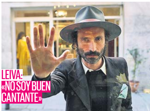
LEIVA: «NO SOY BUEN CANTANTE»