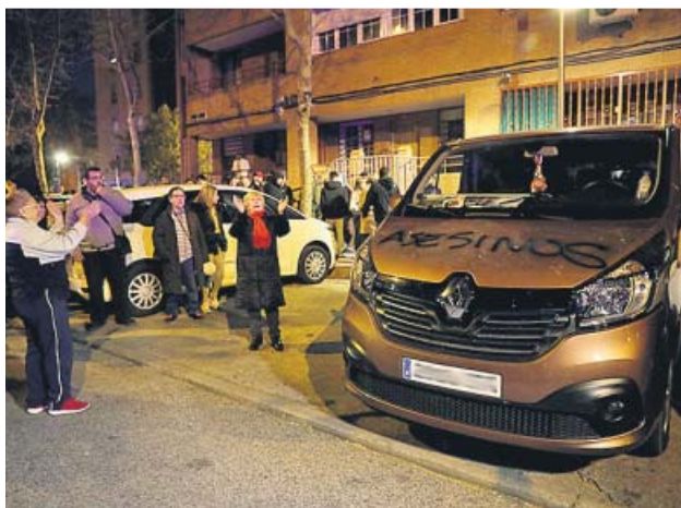
Los vecinos, frente a la casa y la furgoneta del clan implicado.

ocurrió el domingo en el Pozo del Tío Raimundo tras una reyerta multitudinaria