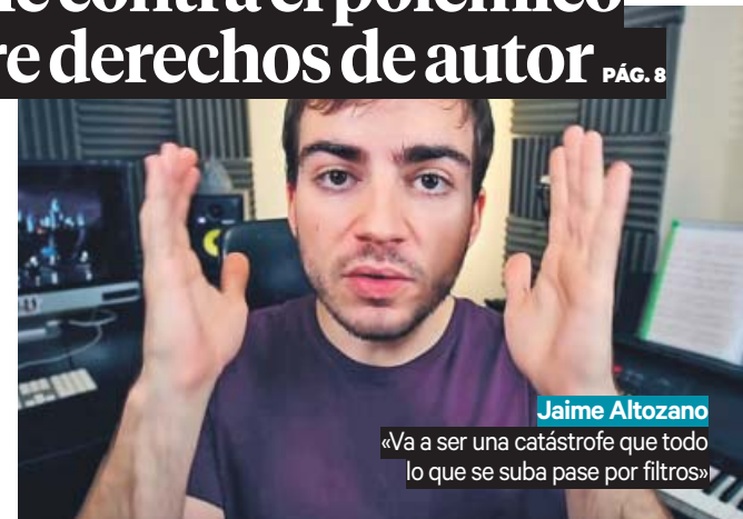
Jaime Altozano «Va a ser una catástrofe que todo lo que se suba pase por filtros»