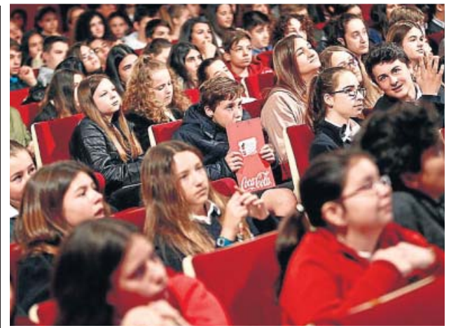
Los concursantes, preparados para escribir.

Si les buscas, nos les encontrarás allí. Ángel León se lo quitó en 2015, Rodrigo de la Calle en 2016, Eneko Atxa prescindió también de este sistema invasivo de comunicación... Uno de los últimos en unirse a esta tendencia «saludable» es Ricard Camarena. «El año pasado pasé dos días sin móvil y, cuando lo volví a encender, tenía 450 mensajes y dos llamadas perdidas. Ese día borré la aplicación y desde entonces siento que tengo más tiempo para atender a mi gente». ●