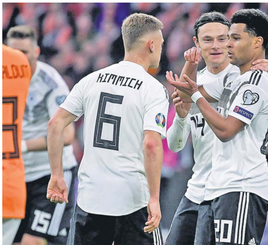
Serge Gnabry celebra su gol a Holanda junto a Joshua Kimmich y Nico Schulz.