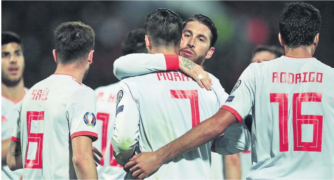
Sergio Ramos y el resto de los jugadores españoles felicitan a Álvaro Morata tras uno de sus goles en Malta.

DOS GOLES del delantero del Atlético le dieron una victoria cómoda a España en su visita a Malta ESPAÑA DOMINÓ de manera absoluta el partido ante un equipo que solo quiso encajar pocos goles