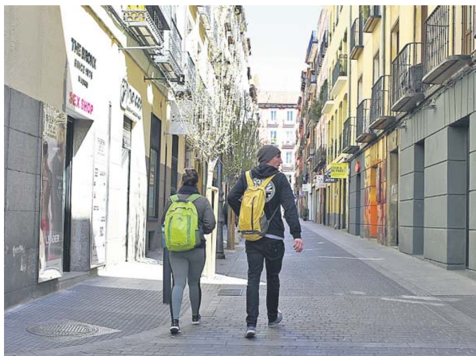
Dos turistas pasean por el céntrico barrio de Chueca.

No. Solo afectará a los distritos que están dentro de la M-30. Este Plan Especial divide la almendra central en tres anillos concéntricos establecidos en función de la saturación de alojamientos turísticos en cada zona. El primer anillo coincide con los límites del distrito de Centro; el anillo 2 comprende el distrito de Chamberí completo y parte de los distritos de Chamartín, Salamanca, Retiro, Arganzuela y Moncloa-Aravaca. El tercer anillo se extiende a barrios de los anteriores distritos, a los que se su-