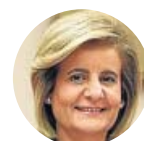
Fátima Báñez Exministra de Empleo, habría sido secretaria general del partido con Santamaría