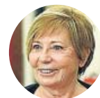
Celia Villalobos Diputada histórica, fue una de las principales valedoras de Soraya Sáenz de Santamaría