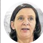
Carolina Bescansa Fundadora de Podemos, se desmarcó de las decisiones tomadas por Iglesias