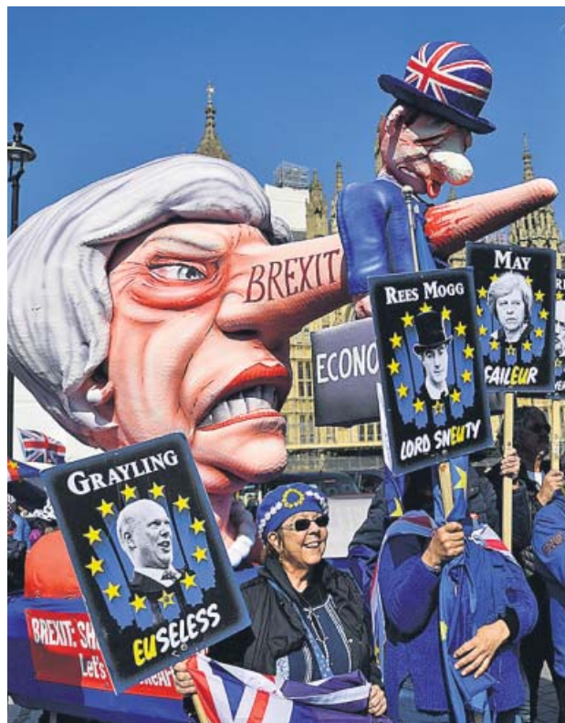
Manifestantes proeuropeos caricaturizan a May.