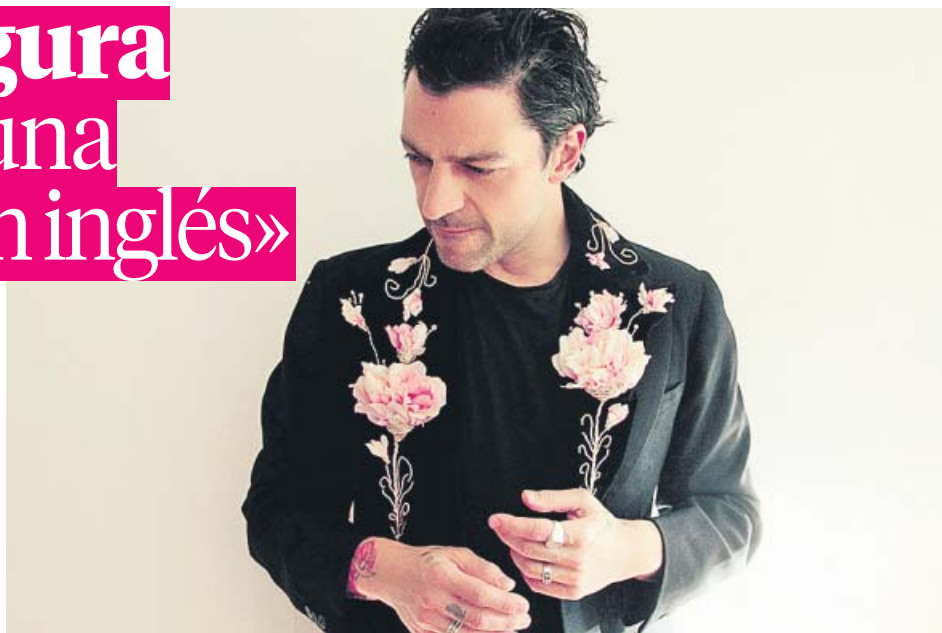
HOOK MANAGEMENT / SONY MUSIC