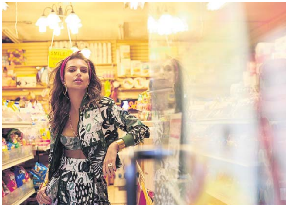
La modelo y actriz Emily Ratajkowski retratada por Carter Smith para InStyle Magazine.

Entre los fotógrafos especialistas en el mundo de la moda y la publicidad destacan nombres como el de la joven- císima artista londinense