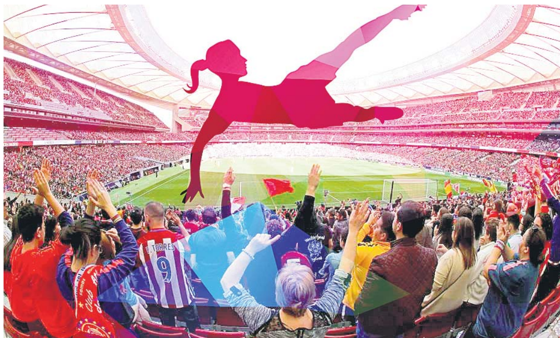
Las gradas del Wanda, repletas para el duelo de fútbol femenino entre Atlético y Barcelona.