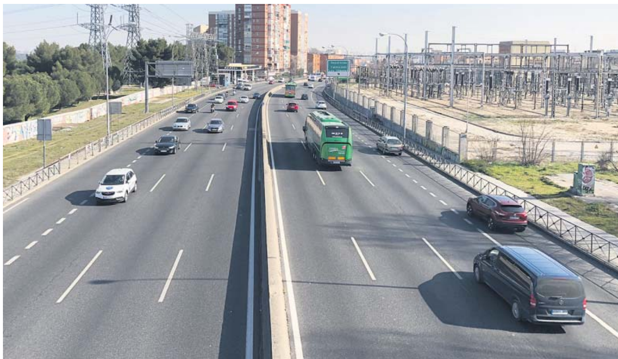
El radar de tramo controla casi dos kilómetros del Paseo de Extremadura.

El Ayuntamiento de Madrid comenzó ayer a multar con el radar de tramo instalado en la A-5, donde la velocidad máxima permitida en este tramo es de 70 km/h. El dispositivo, situado entre el kilómetro 4 y 5,75 del Paseo de Extremadura, detectó 27.712 superaciones de velocidad entre el 15 de febrero y el 10 de abril, periodo en el que ha estado en pruebas. El PP criticó su puesta en funcionamiento exigiendo su retirada inmediata y apostando en un futuro por soterrar la vía. ●