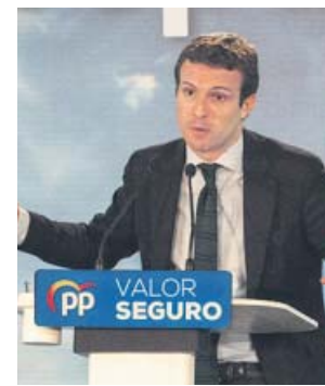
Pablo Casado, en un mitin ayer en Ciudad Real.

Ante un público formado principalmente por personas mayores, Casado anunció que si