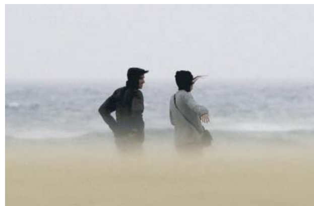
Dos jóvenes en la playa de la Zurriola de San Sebastián.

El jueves, la borrasca cubrirá prácticamente la totalidad del territorio dejando lluvias generalizadas en toda la Península, Ceuta y Melilla. Las temperaturas bajarán en toda España, sobre todo en Castilla y León, Castilla la Mancha y Madrid. En la capital, los mercurios pasarán de 27 a 15