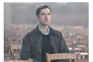
Una escena de la película, con Melvil Poupaud.

El prolífico director francés olvida sus acercamientos habitualmente estilizados, su narrativa perversa e irónica, para