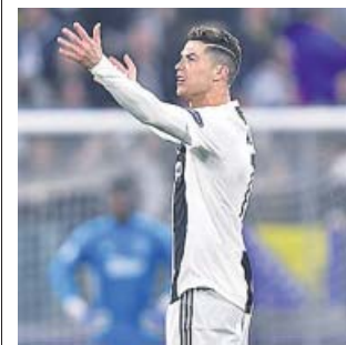
Cristiano Ronaldo se lamenta ante el Ajax.

La eliminatoria estaba igualada y en la segunda mitad fue el Ajax el conjunto que más buscó el gol de la victoria. Szczesny lo evitó ante un remate de Van de Beek y Pjanic evitó otro tanto cantado de Ziyech. Sufrió la Juve en su estadio y en el minuto 68 llegó el mazazo definitivo: el Ajax sacó un córner y De Ligt se elevó por encima de sus rivales para batir a Szczesny. ●