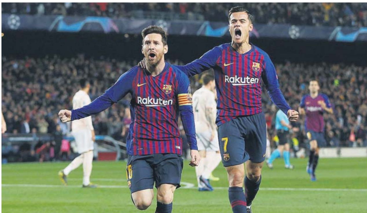
Leo Messi celebra uno de sus goles al Manchester United junto a Coutinho.

En una entrevista en Movistar, el tenista español desveló una de las claves de su preparación: «Juego mucho al parchís y trato de hacerlo entre el calentamiento y el partido. Me ayuda a desconectar».