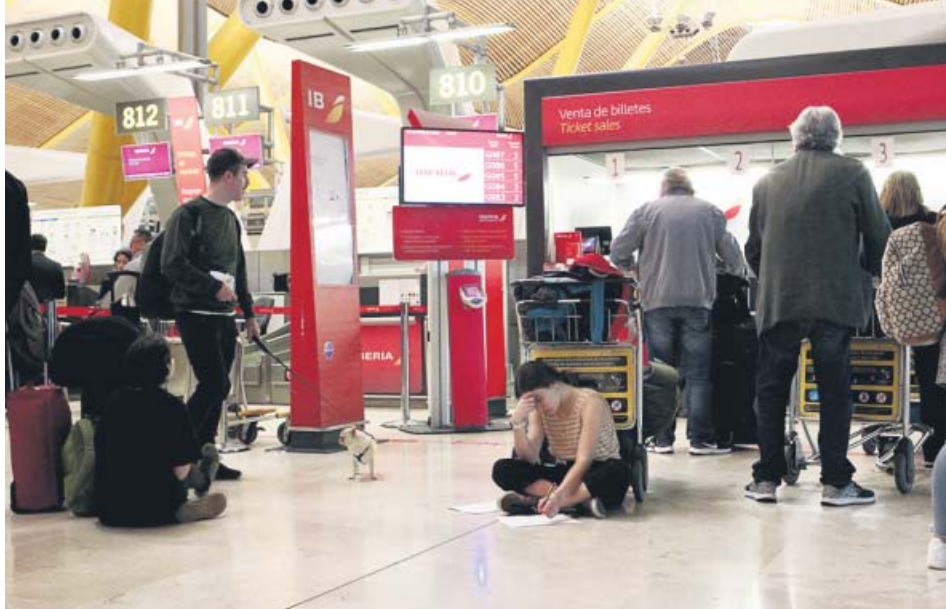
Esperas, el pasado lunes, en la terminal de salidas de la T4 del aeropuerto de Barajas. JORGE PARÍS

PABLO RODERO pablo.rodero@20minutos.es / @pablrodero