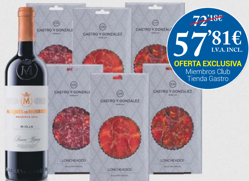
SELECCIÓN CASTRO Y GONZÁLEZ

72'18€ 57'81€ I.V.A. INCL. OFERTA EXCLUSIVA Miembros Club Tienda Gastro