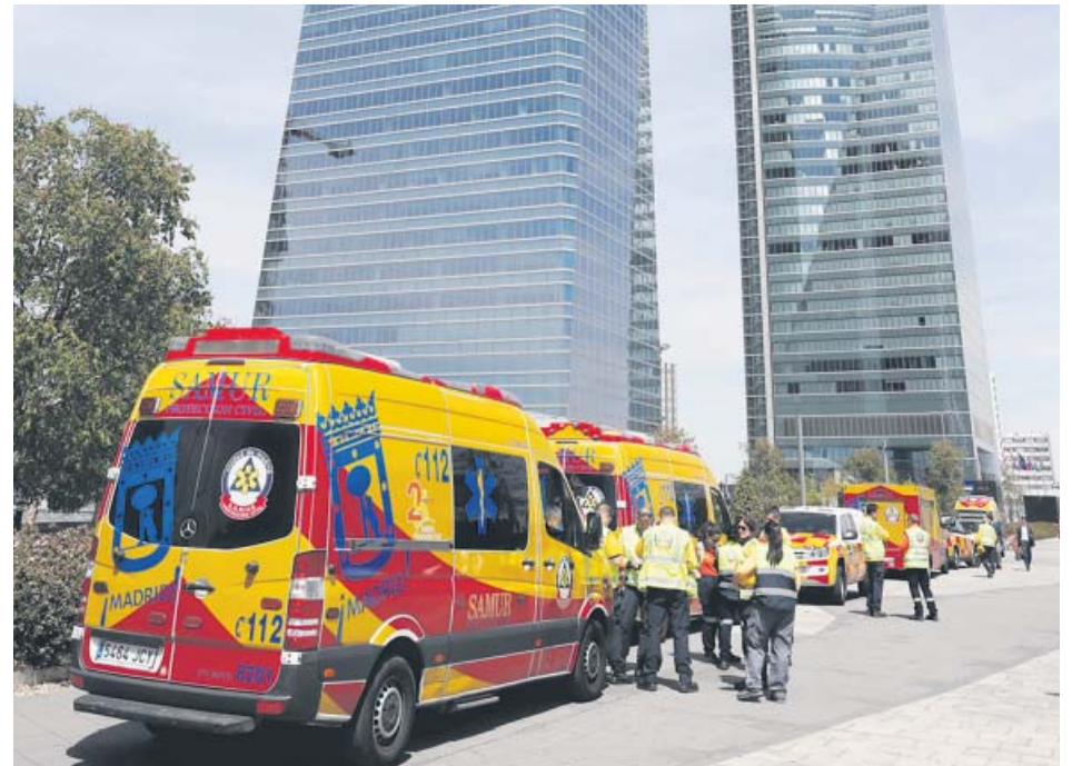
Los servicios de emergencias, ayer, junto a la Torre Espacio (derecha).