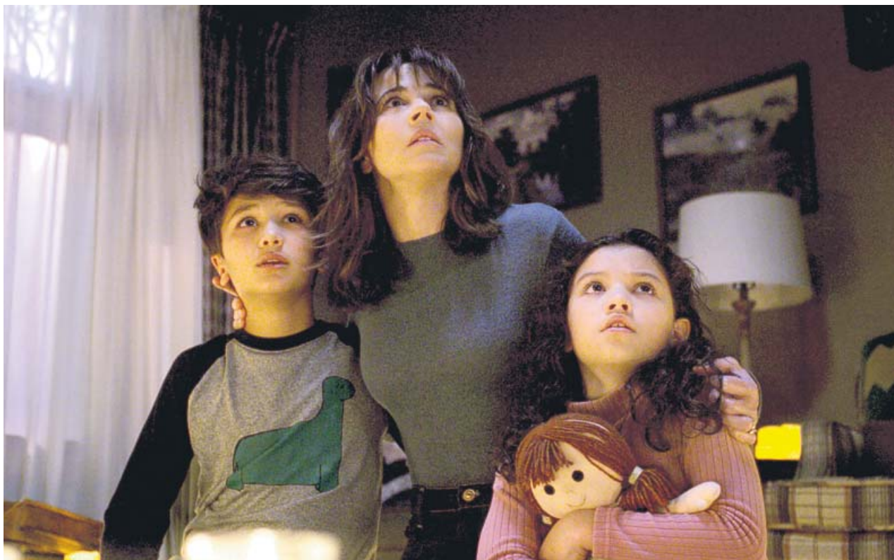
El personaje de Linda Cardellini y sus hijos.