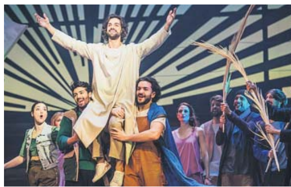
33 EL MUSICAL