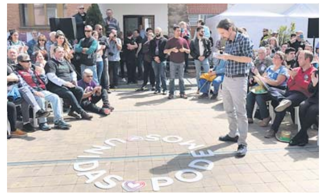
Iglesias recaló ayer en la localidad riojana de Nalda.

bernando. Nos han tomado el pelo porque no estábamos en el Gobierno», indicó. «Firman un acuerdo contigo, te dan la razón en muchas cosas y, una vez que tienen tus votos en el Parlamento, no cumplen», reprochó. ●