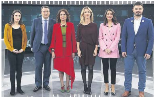
Irene Montero, Aitor Esteban, María Jesús Montero, Cayetana Álvarez de Toledo, Inés Arrimadas y Gabriel Rufián.

Aunque para encontraronzo el que Álvarez de Toledo tuvo con el número dos de ERC por Barcelona, Gabriel Rufián, quien declaró que le pareció «gravísimo» lo que la popular dijo en materia de igualdad sobre el «consentimiento afirmativo» y le pidió que lo revisara. Las mismas palabras de Álvarez de To-