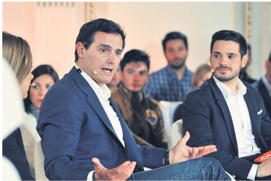
Albert Rivera, ayer, en un acto de campaña celebrado en Albacete.

En el conjunto de propuestas, Ciudadanos da un lugar importante a la cuestión de los permisos de paternidad y maternidad. Rivera se compromete a situarlos ya en 16 semanas para