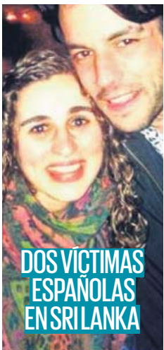
DOS VÍCTIMAS ESPAÑOLAS EN SRILANKA

La modelo ha adquirido la licencia de ambos certámenes tras ocho años sin celebrarse por las polémicas y ya anuncia cambios: «Los ganadores tendrán talento además de buen físico». PÁGINA 13