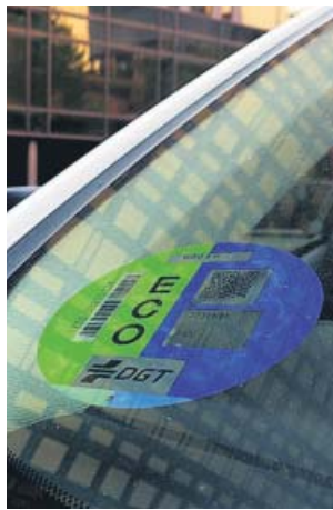
El distintivo debe figurar en un lugar visible.

Este miércoles entra en vigor la normativa que obliga a lucir el distintivo ambiental de la Dirección General de Tráfico (DGT) en todos los vehículos que vayan a circular o estacionar por cualquier esquina de Madrid. Estas pegatinas ordenan a los vehículos en función de su impacto ecológico, lo que sirve al Consistorio para mejo-