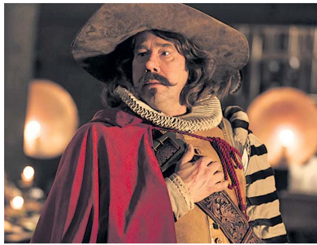
Cartas a Roxane, inspirada en Cyrano de Bergerac. A CONTRACORRIENTE

En total se proyectarán 59 obras, trece en la sección oficial