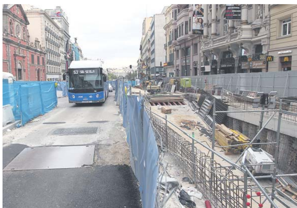
Zona afectada por las obras que trabajan en el macrocomplejo de lujo de Canalejas.

La constructora OHL ya está costeando todos los daños que ha causado a las infraestructuras de Metro, que aproximadamente ascienden a unos 3,5 millones de euros, así