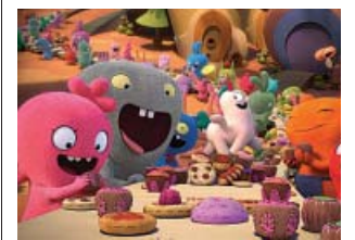
Moxy, Babo y otros peluches marginados. DIAMOND

La mayor baza del filme de Lord y Miller era recurrir a una marca que cientos de personas ya usaban como medio narra-