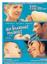
2019. Directora Jeanne Herry Reparto Sandrine Kiberlain, Gilles Lellouche, Élodie Bouchez

Si en la película de Quillévéré seguíamos el destino de