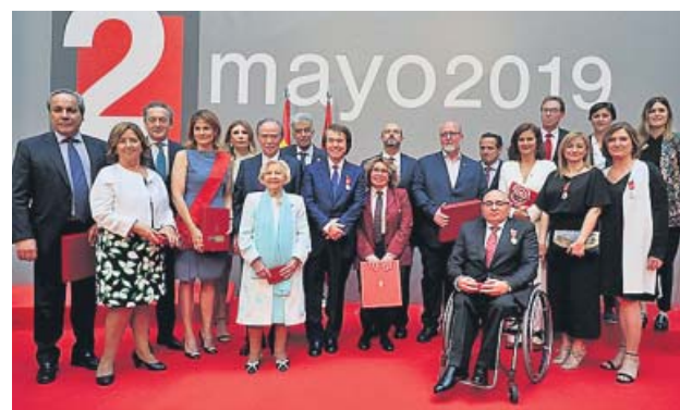
Arriba, Rollán preside los actos de homenaje en La Florida. Abajo, foto de familia de los condecorados.

mi y Plena Inclusión. Ya en su discurso institucional, Rollán defendió «el autogobierno» madrileño como seña de «eficacia, solidaridad y lealtad a España». Como ya hiciera su predecesor Ángel Garrido hace un año tras la abrupta marcha de Cristina Cifuentes y consciente de la volatilidad política actual, Rollán aludió a la «estabilidad» como valor de la Comunidad, fruto de «unas instituciones sólidamente asentadas». Mirando de reojo a las próximas elecciones, el po-