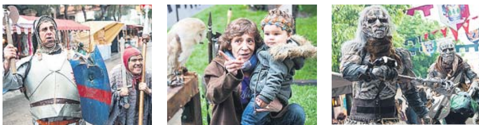
Pasacalles, caballeros de la época, exhibición de aves rapaces o temibles ogros esperan a los visitantes entre los puestos del mercado medieval de El Álamo, hasta el domingo. CM+MG