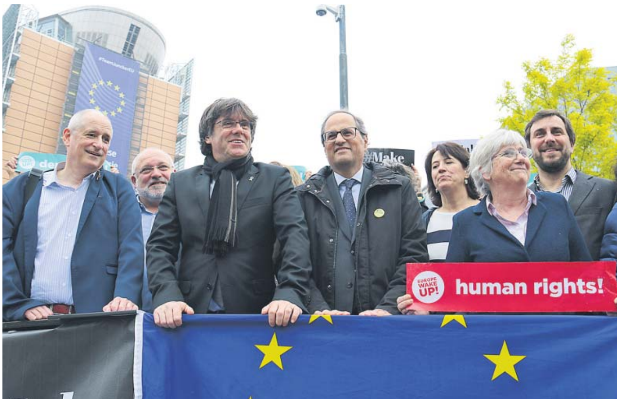
Carles Puigdemont y Quim Torra, ayer en Bruselas.