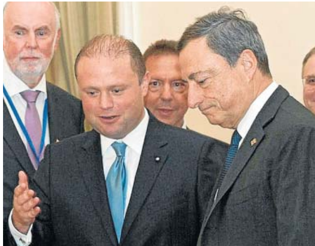
De izquierda a derecha y de arriba abajo, el portugués António Costa en su toma de posesión; el primer ministro sueco, Stefan Löfven; la rumana Viorica Dăncilă, y el maltés Joseph Muscat en una recepción a Mario Draghi.