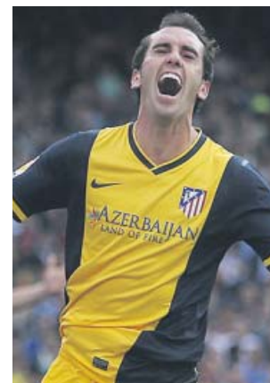
Multitudinaria despedida, ayer, al central uruguayo (arriba). A la izquierda, con lágrimas en sus ojos. A la derecha, tras marcar el gol en el Camp Nou que le dio al Atleti la Liga en 2014.

Champions ante el Real Madrid. Pero Sergio Ramos le arrebató en aquella ocasión la gloria al central uruguayo.