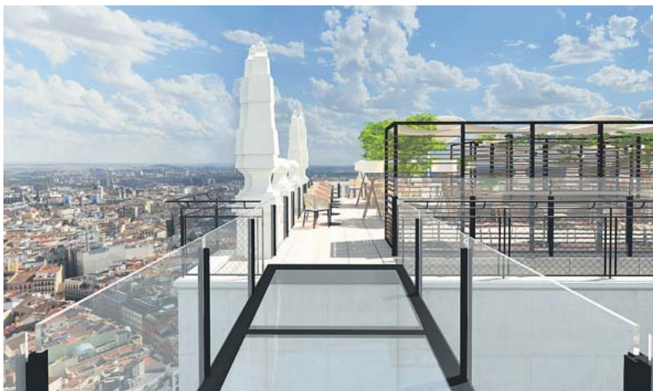
El hotel del Edificio España contará con una terraza en la azotea.

LA ALCALDESA Manuela Carmena realizó ayer una visita al rascacielos en rehabilitación