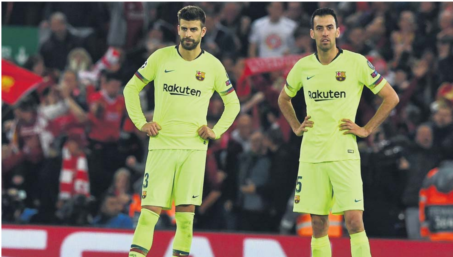
Sergio Busquets y Gerard Piqué se lamentan tras uno de los goles del Liverpool en Anfield.