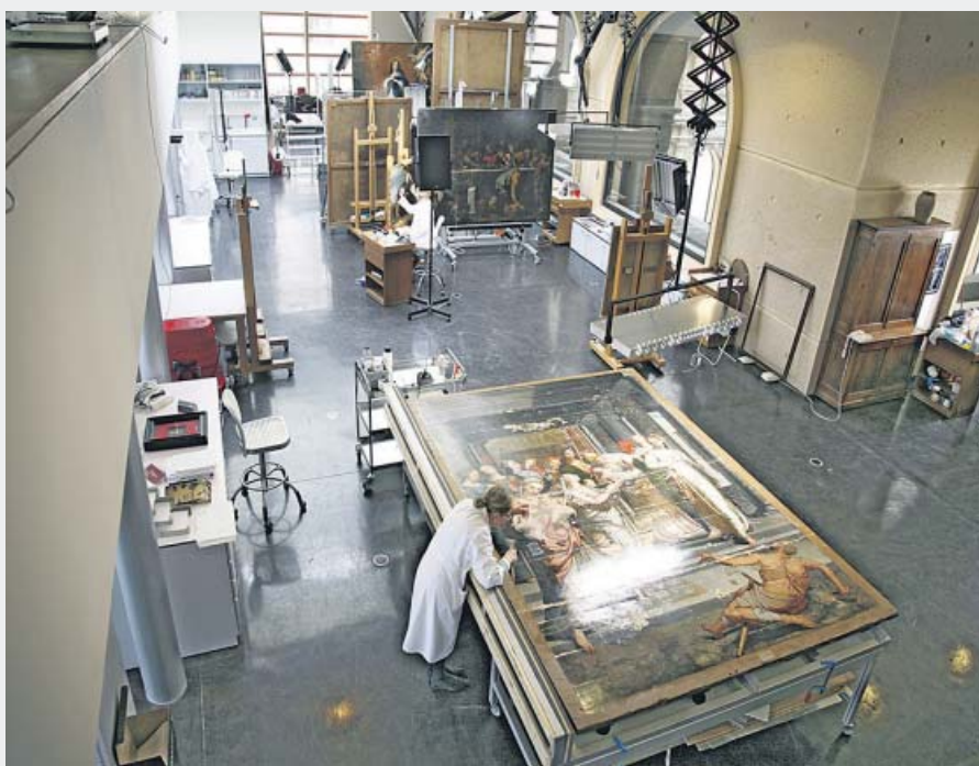
Vista general del taller de restauración (arriba) y 'La Anunciación', antes (izda) y después de la restauración (dcha). MUSEO DEL PRADO