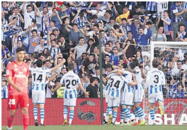
Los jugadores de la Real Sociedad celebran un gol ante el Real Madrid.

El equipo de Zidane, que jugó buena parte con diez, volvió a evidenciar serios problemas ante una Real superior