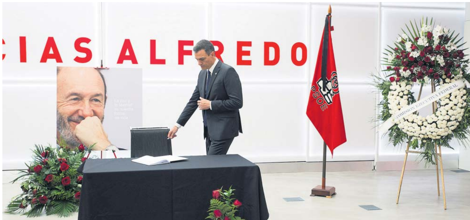
Pedro Sánchez, en el momento de la firma ayer del libro de condolencias dispuesto en la sede del PSOE, en Madrid.

La familia de Alfredo Pérez Rubalcaba enterró ayer sus cenizas en Tres Cantos y entregó al PSOE las flores recibidas para que las reparta en los mítines. En Ferraz, Pedro Sánchez escribió en el libro de condolencias que el exdirigente encarna el partido como «nadie de los que estamos hoy al frente». Tras un fin de semana de luto, el presidente regresa hoy a la campaña en Zaragoza. Más de 8.000 personas han pasado por la capilla ardiente en el Congreso. ● R. A.