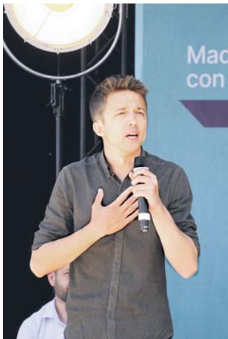
Íñigo Errejón participó en un acto en Leganés con los candidatos a alcaldes de Más Madrid para los municipios del sur de la Comunidad. Isa Serra estuvo en Madrid Río junto a los dirigentes de Podemos Ione Belarra y Pablo Echenique. MÁS MADRID / UNIDAS PODEMOS-IU-MADRID EN PIE

El exdiputado nacional dirigió sus ataques más duros contra los tres partidos del bloque de la derecha. Errejón denunció los «pinchazos» de los últimos actos de Vox: «Os pasa porque sois unos bufones», lanzó a