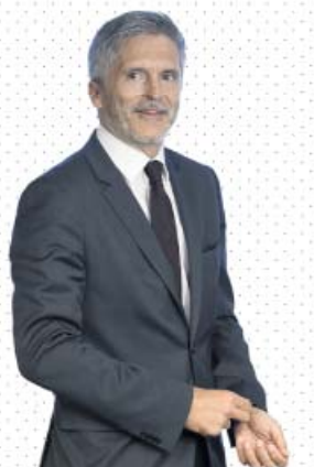
Fernando Grande-Marlaska Ministro del Interior

M e conmueve especialmente escribir estas líneas sentado en la misma silla que él ocupó durante largos y difíciles años. Cuando Alfredo Pérez Rubalcaba trabajaba en esta mesa, yo lo hacía desde la sala de lo Penal de la Audiencia Nacional. Nos unió nuestra lucha contra el terrorismo, cada uno desde nuestras responsabilidades, pero siempre desde un profundo respeto institucional que dio paso más tarde a la amistad.