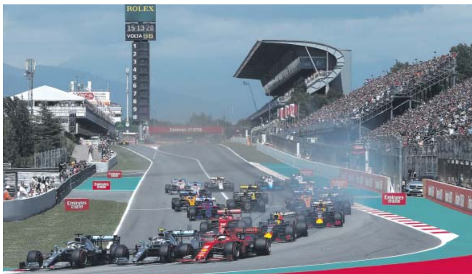
Los dos Mercedes al frente en la primera curva del GP de España.

De hecho, la superioridad alemana se hizo aún más evidente en el circuito de Montmeló, donde Hamilton y Bottas coparraron la primera línea de parrilla el sábado y ayer se escaparon sin oposición desde la primera vuelta. Solo tuvieron que luchar entre ellos y fue Hamilton, desde la segunda posición, quien dio el zarpazo al adelantar a Bottas en la salida. A partir de ahí, solo tuvieron que pisar a fon-