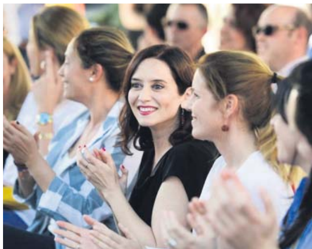
Isabel Díaz Ayuso, ayer en un acto de campaña.

La candidata popular anunció también su intención de elaborar un protocolo para ayudar a las embarazadas en