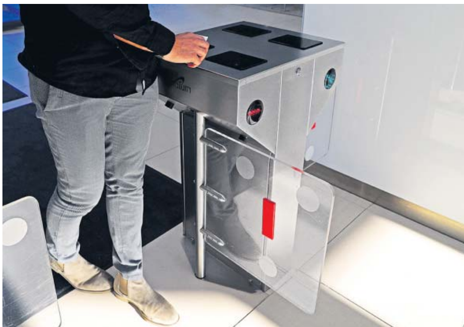
Un trabajador ficha al inicio de su jornada laboral, con la nueva normativa ya en vigor.

La ministra defiende el decreto y advierte de sanciones si las empresas no cumplen: «Han tenido dos meses para planificar»