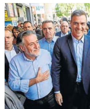
Pepu, junto a Pedro Sánchez en Vallecas.

PSOE El candidato del PSOE a la Alcaldía de la capital, Pepu Hernández, visitó ayer el distrito de Puente de Vallecas acompañado por el presidente del Gobierno, Pedro Sánchez, y el candidato a la pre-