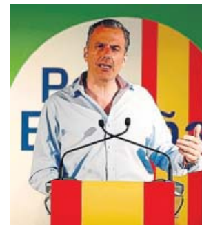
Javier Ortega Smith estuvo ayer con empresarios.

VOX El candidato de la formación de derechas a la Alcaldía de Madrid, Javier Ortega Smith, tuvo ayer un encuentro con los socios de la organización Madrid Foro Empresarial en