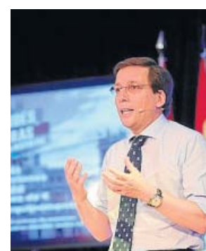
Almeida presentó su plan para los distritos en Villaverde. PP

PP El candidato del Partido Popular a la Alcaldía de Madrid, José Luis Martínez-Almeida, prometió ayer «cuidar» a los 21 distritos de la capital a través de un programa de acción para los mismos basado en 141