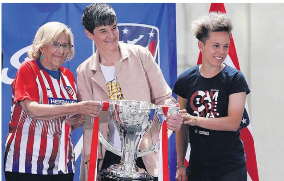
Carmena recibió ayer en el Ayuntamiento al Atlético femenino tras ganar la Liga.