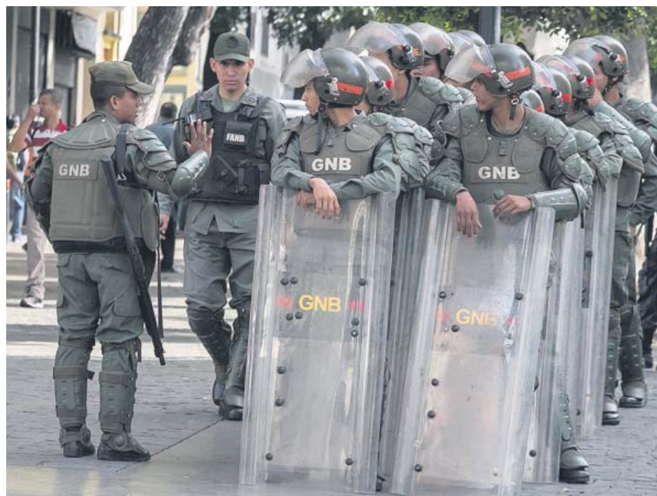
Funcionarios de la Guardia en las inmediaciones del Parlamento venezolano.

de mensajería instantánea situó a esta compañía como la principal sospechosa del programa de espionaje. Que algunas organizaciones afectadas sean plataformas de defensa de los derechos humanos refuerza la hipótesis de la implicación por parte de NSO Group. La empresa israelí diseña software espía para sus clientes, entre los que se encuentran Gobiernos de todo el mundo, que lo usan para acceder a dispositivos móviles y obtener información. La empresa opera de forma opaca y durante muchos años lo hizo en secreto. ●