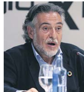
Pepu acudió ayer a un acto en el Club Siglo XXI.

El candidato del PSOE al Ayuntamiento de Madrid, Pepu Hernández, se comprometió ayer a gestionar un parque de vivienda pública en alquiler que llegue al 20% y reactivar el parque residencial de pisos desocupados, que estima en más de 150.000 viviendas vacías que deben incorporarse a la ciudad. Así lo detalló en su intervención en un almuerzo en el Club Siglo XXI para in-