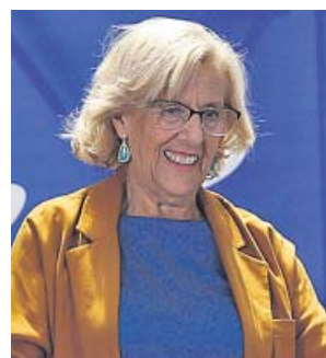
La alcaldesa de Madrid, Manuela Carmena.

Más Madrid La apuesta de Más Madrid por los barrios y el compromiso por el reequilibrio territorial se hace patente de forma gráfica con la campaña de cartelería en la que la candidata a revalidar la Alcaldía, Manuela Carmena, hace guiños a las señas de identidad de los barrios. Desde la plataforma municipal destacan que si algo ha caracterizado las políticas del Ayuntamiento de Madrid en