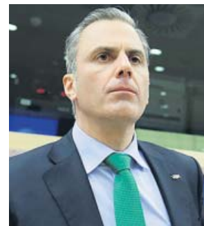
Ortega Smith quiere acabar con Madrid Central.

El candidato de Vox al Ayuntamiento, Javier Ortega Smith, reiteró ayer su determinación de acabar con Madrid Central en caso de ser elegido alcalde tras las elecciones del 26 de mayo, medida fruto de la «política sectaria» de Ahora Madrid, al tiempo que potenciará una red de parkings disuasorios y recuperará un plan de aparcamiento a residentes. Tras pasear por Gran Vía, Ortega Smith