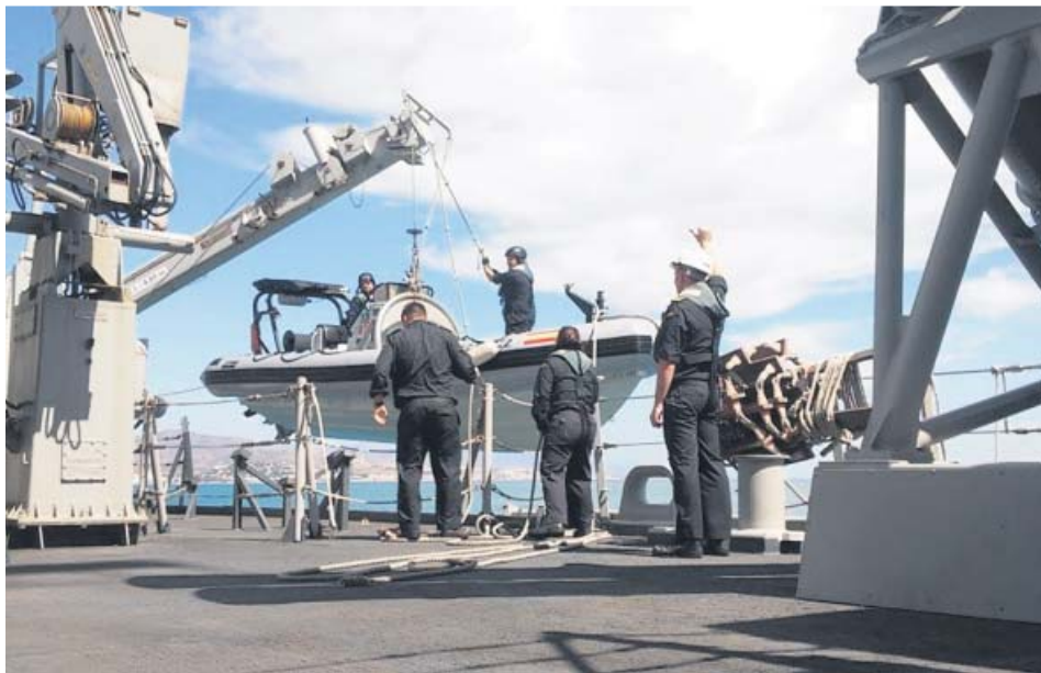
Imagen de archivo de la fragata Méndez Núñez.

La menor de 20 meses que murió el pasado noviembre tras acudir al Hospital de Vinaroz (Castellón) con un cuadro de vómitos, fue víctima de una cadena de negligencias, según el abogado de la familia. El letrado, que cita un informe de la comisión de investigación, aseguró que se constata de manera «incontestable» esta «negligencia». Según aseguró, la menor fue atendida por un médico de urgencias, no por un especialista y solo fue atendida por un pediatra cuando comenzaron las convulsiones. La causa de la muerte habría sido, según cita, la administración de una dosis excesivamente alta de glucosa por parte de una enfermera, que equivocó la prescripción que había dado el médico. ●