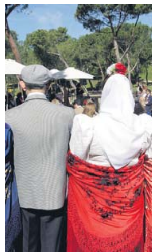
Asistentes a la presentación del programa de San Isidro.

—Aguirre con el conjunto completo: vestido, mantón, pañuelo y clavel—. A eso del mediodía, también visitará la Pradera Pepu Hernández, candidato del PSOE al Ayuntamiento. No lo hará así en principio Ángel Gabilondo, que no tiene programado ningún acto en la zona y visitará Alcobendas junto al Ministro de Interior en funciones, Grande-Marlaska. Sí estará en la entrega de medallas de la ciudad. Carmena, en calidad de al-