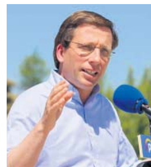
Almeida, ayer, en el Parque Forestal de Valdebebas. PP

El candidato del PP a la Alcaldía de Madrid, José Luis Martínez-Almeida, aseguró ayer que aquellas empresas que no cumplan con los pliegos establecidos en los contratos de limpieza en la capital serán sancionadas «de forma automática». Así lo indicó desde el Parque Forestal de Valdebebas durante la presentación de las medidas que contiene su programa electoral en lo refe-