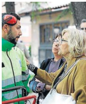
Carmena saluda a un operario de limpieza. MÁS MADRID

La alcaldesa también anunció que las multas por ensuciar la calle se sustituirán por la obligación de acometer tareas de limpieza. «Las multas no son objeto de recaudación, sino que sirven para