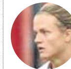
Irene Paredes ■ Paris Saint-Germain ■ Defensa central