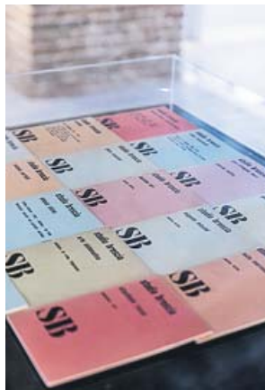
Arriba, poema-objeto de Brossa sobre bombilla (1967). Debajo, la publicación de poesía concreta de Studio Brescia (años 70) y Aranha (Araña) , de Sallette Tavares (1963). MACBA / FUNDACIÓN JOAN BROSSA

ron romper con la idea de la poesía como práctica elitista y reconstruir su valor «con unas formas abiertas y experimentales que tienen en cuenta los cambios tecnológicos y políticos y que quieren traspasar todo tipo de fronteras, empezando por las nacionales y las lingüísticas», señala la fundación.