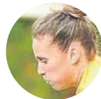
Sandra Paños ■ FC Barcelona ■ Portero