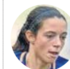
Aitana Bonmatí ■ FC Barcelona ■ Centrocampista