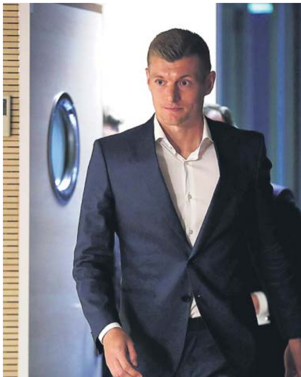
El centrocampista alemán, ayer, en la firma de la renovación.

Lo que sí quiso dejar claro el teutón es que en ningún momento pensó en dejar el equipo blanco pese a la mala situación del conjunto. «Nunca he tenido dudas de mi futuro. Hace un mes se dijo que