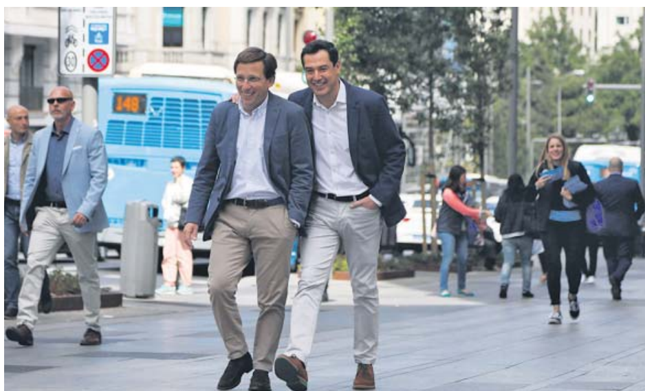
J. L. Martínez-Almeida y el presidente andaluz, Juanma Moreno, paseando ayer por Gran Vía.

Con todo, Carmena decidió ayer, una vez recibido el informe, convocar a los grupos mu-