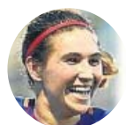
Mariona Caldentey ■ FC Barcelona ■ Centrocampista