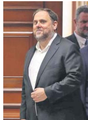
Junqueras, ayer en el Congreso.

El PSOE tampoco reveló su postura con el argumento de que la Mesa ni siquiera estaba constituida aún. Que la balanza de los votos del PSOE se incline a un lado o a otro supone la primera prueba de fuego para la hasta ahora ministra de Política Territorial, Meritxell Batet,