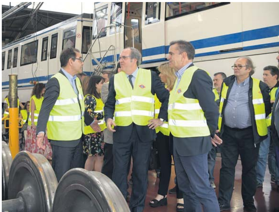
Ángel Gabilondo, durante su visita a los talleres centrales de Metro ayer.

Gabilondo criticó los «graves problemas de gestión» de Metro, completamente en manos de la Comunidad desde diciembre de 2011, cuando el Ayuntamiento del entonces alcalde Alberto Ruíz-Gallardón cedió todas sus acciones en la compañía –un 75%– a la Comunidad, presidida por Espe-