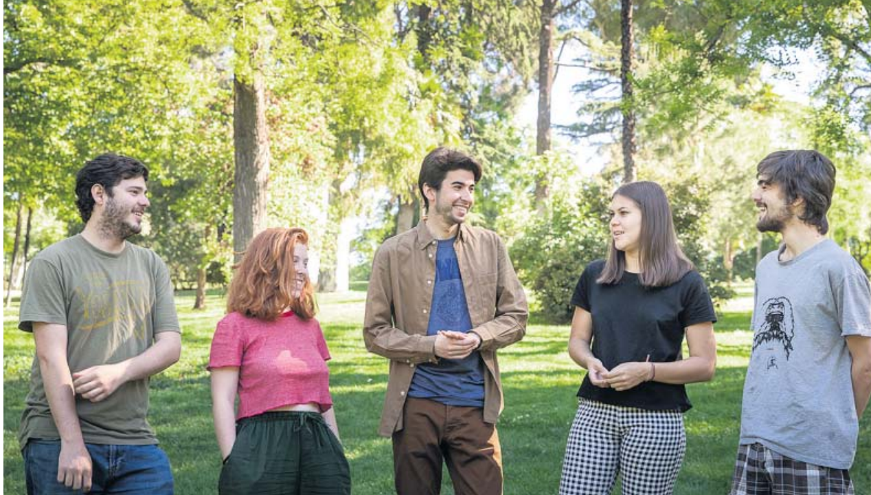
Miembros del movimiento estudiantil Fridays For Future en el parque del Retiro de Madrid.

El movimiento estudiantil Fridays For Future celebra mañana su duodécima sentada frente al Congreso. Antes, se manifestarán en Sol durante la huelga global por el clima