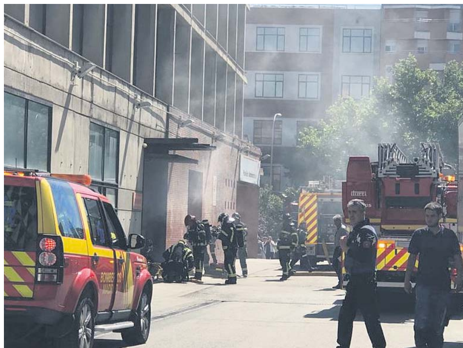
Los bomberos sofocaron rápidamente el pequeño fuego del Gregorio Marañón.

El hospital Gregorio Marañón de Madrid evacuó ayer al personal de una zona de oficinas del centro por el intenso humo generado por un motor averiado de la lavandería. Los servicios de emergencias recibieron una llamada a las 11.45 horas por el humo detectado tras la avería en un edificio en obras junto al edificio administrativo. Por ello, la dirección del hospital decidió desalojar al personal de administración de esa zona. Ni personal sanitario ni pacientes se vieron afectados. ●