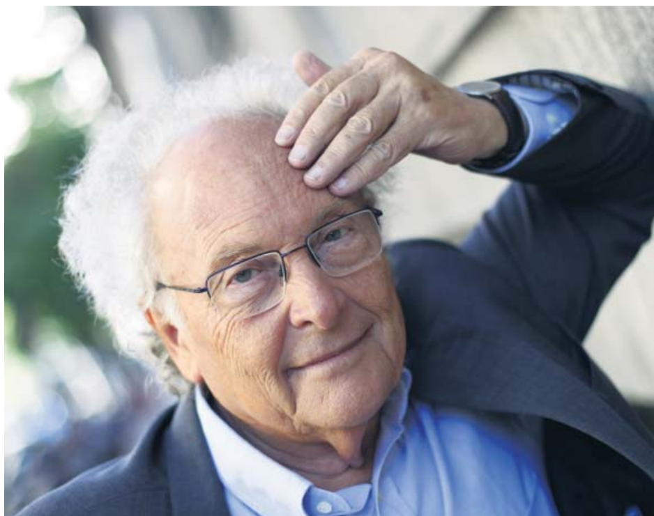
Eduard Punset, retratado durante una entrevista con 20minutos en 2013.

Nacido en 1936 en Barcelona, se formó en la Universidad de Londres y en la Complutense de Madrid en Ciencias Jurídicas. Tras la muerte de Franco, entró en política de la mano de Centristes de Catalunya y, en