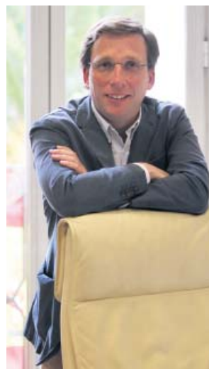
José Luis Martínez-Almeida en su despacho. JORGE PARÍS

El SER cubre la práctica totalidad de los barrios del interior de la M-30 y limita el aparcamiento para no residentes, de lunes a viernes, no festivos, de 9 a 21 horas y los sábados, de 9 a 15 horas. Las APR eran zonas restringidas al tráfico de no residentes en el centro de la capital que fueron incluidas en la zona de Madrid Central, que abarca casi todo el distrito Centro desde el pasado 30 de noviembre. Las multas por incumplir las normas de estas