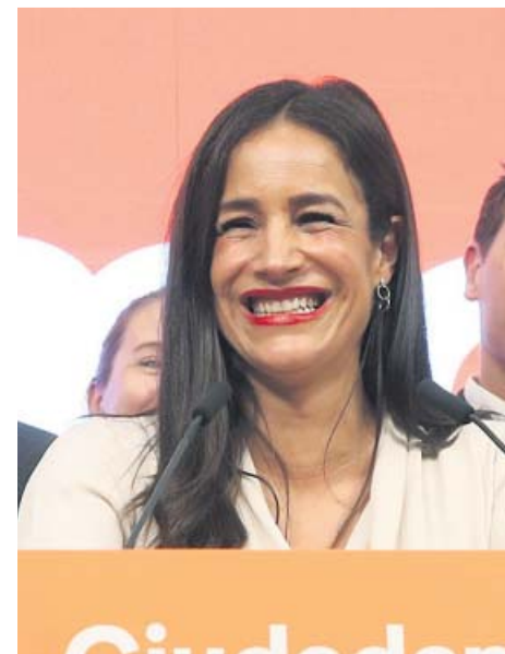
BEGOÑA VILLACÍS CANDIDATA MUNICIPAL DE CS

“ SOBRE DAR LA VICEALCALDÍA A VILLACÍS «No creo que los cargos o los títulos vayan a ser un problema para que podamos tener ese Gobierno»