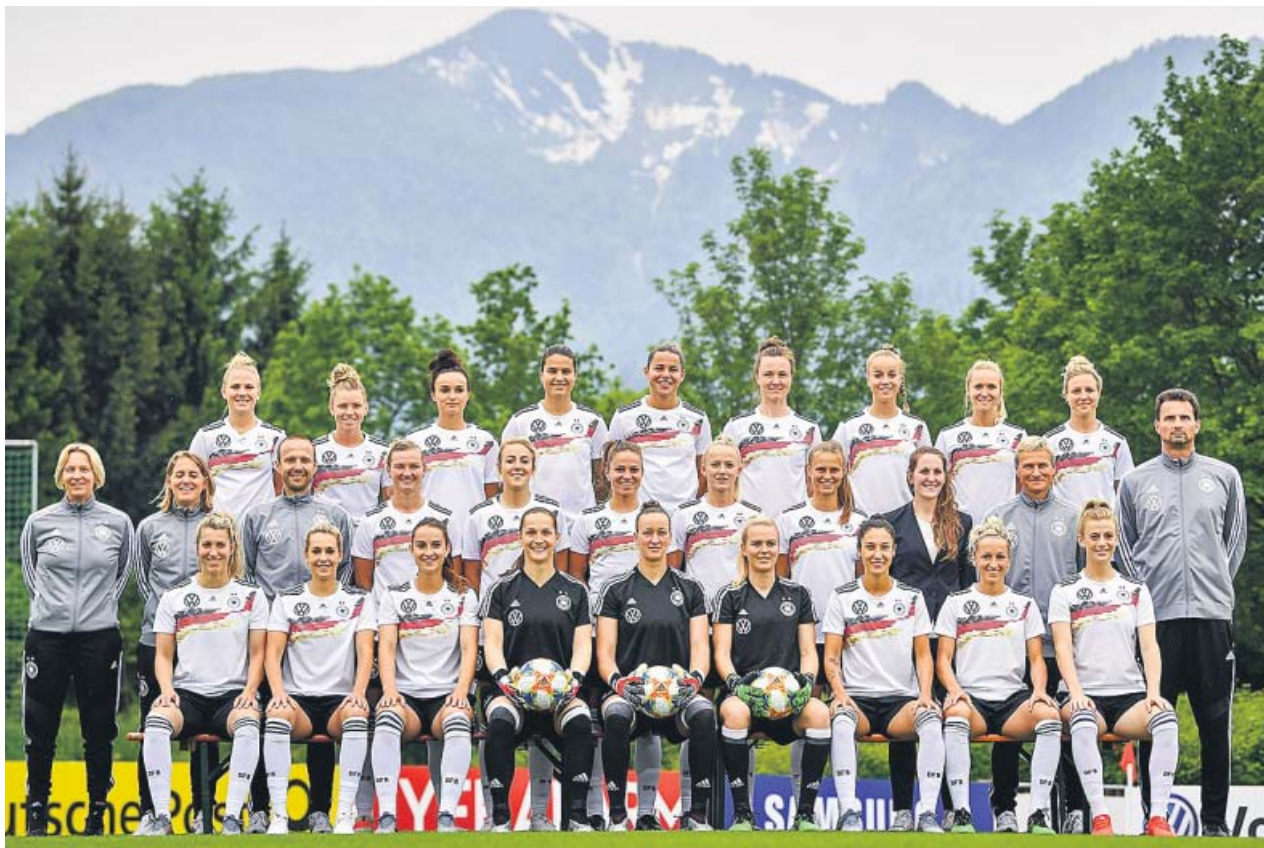
Puesta de largo alemana. La selección germana, el rival más duro de España en la primera fase del Mundial, se realizó ayer la tradicional foto de equipo, en un escenario idílico. Parten como grandes favoritas para ganar el torneo.