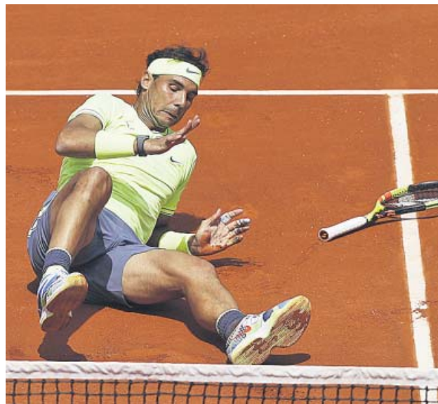
Nadal tropieza durante un lance del duelo de ayer.

veces ha ganado Rafa Nadal el torneo de Roland Garros, en el que ayer se estrenó con una cómoda victoria