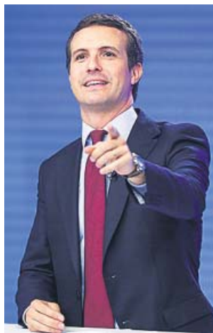
Casado, en rueda de prensa en la sede del PP.

Pablo Casado recupera crédito y confianza. Los resultados del 26 de mayo sirvieron de bálsamo para el nuevo proyecto del PP, que había quedado tocado tras las generales. El propio líder, tras la reunión del Comité Ejecutivo Nacional celebrado ayer en Madrid, reivindicó la «recuperación» y celebró que «ha empezado la remontada» como «contrapeso» del Gobierno de Sánchez. «Hoy comenzamos la refundación del centroderecha, conscientes de nuestras debilidades y conscientes de que el ciclo electoral nos per-