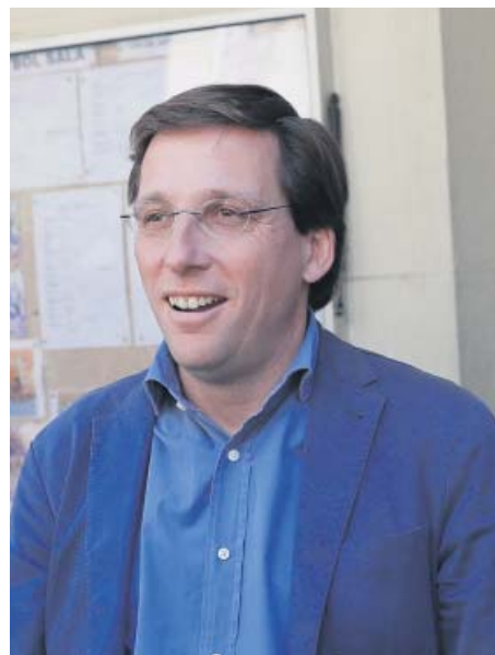
JOSÉ LUIS MARTÍNEZ-ALMEIDA CANDIDATO MUNICIPAL DEL PP

20M.ES/26M Puedes consultar los resultados de las elecciones autonómicas y municipales en 20minutos.es