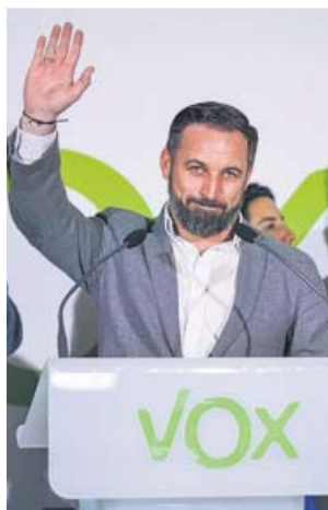
Abascal saluda a la gente en la noche electoral.

VOX «Quien quiera contar con nuestro apoyo para una mayoría alternativa tendrá que ser respetuoso y flexible». El tono de Santiago Abascal está lejos de ser condescendiente de cara a los posibles pactos de gobierno en los que pueda participar Vox. El líder de la formación avisó de que los partidos que quieran contar con los votos de los suyos «se tendrán que sentar a negociar con nosotros». El objetivo de Vox, a diferencia de lo que sucedió en Andalucía, es poder formar parte de esos Ejecutivos en los que tendrán un papel «fundamental», según