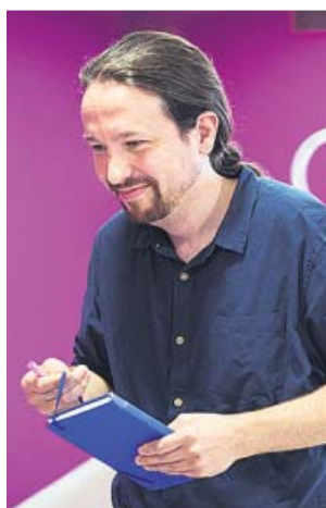
Iglesias, ayer, antes de dar una rueda de prensa.

Los malos resultados de este domingo no modifican el objetivo de Pablo Iglesias. El secretario general de Podemos insistió ayer en la necesidad de negociar con Pedro Sánchez un gobierno de coalición desde la «posición modesta» que, en sus palabras, les han otorgado los ciudadanos en las autonómicas, municipales y europeas. En una rueda de prensa en la sede del partido, Iglesias esgrimió que su cargo está a disposición de los inscritos «siempre» pero descartó marcharse porque, según justificó, ahora le toca «asumir la