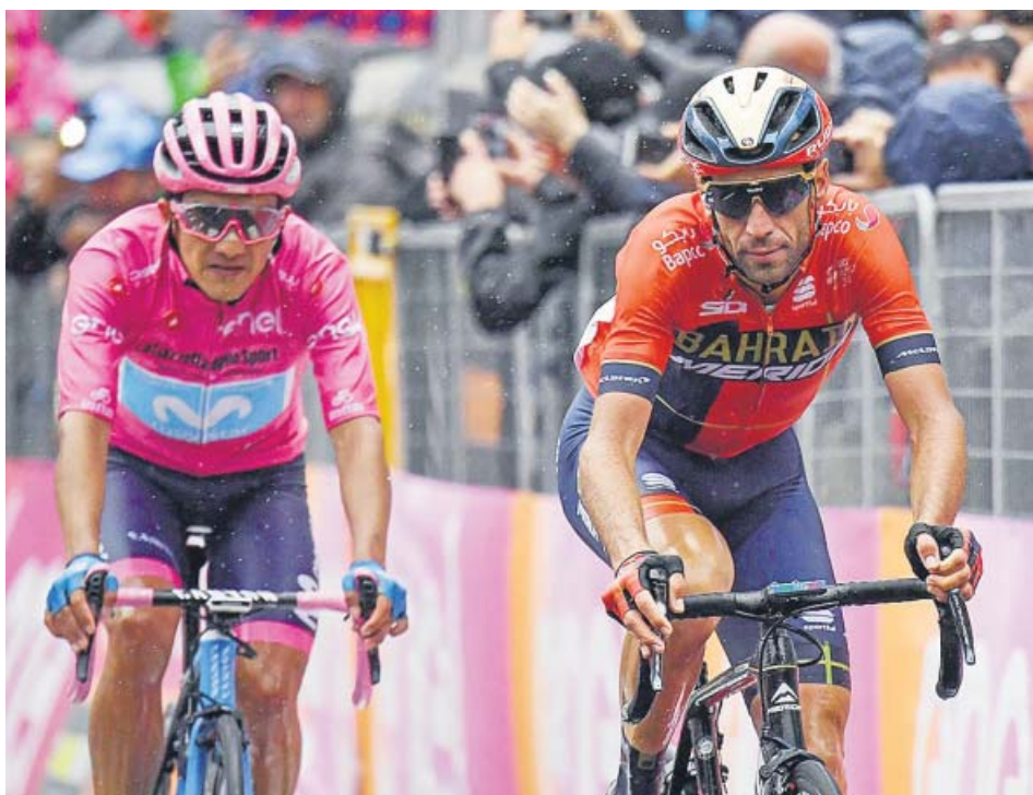
Nibali y Carapaz llegan juntos a la meta de la etapa de ayer.