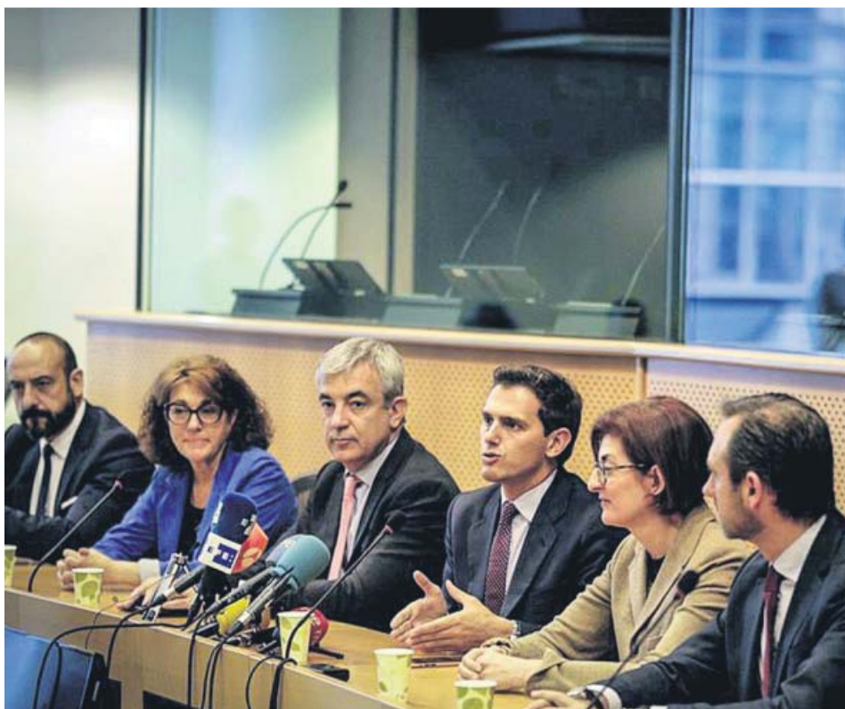
Albert Rivera, ayer con los eurodiputados de Ciudadanos.