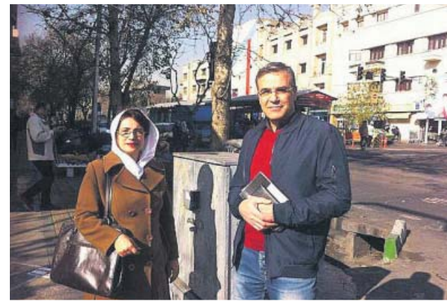
Un icono en la avenida Revolución

En Irán, desde el año 1979 la ley establece la obligatoriedad de usar hiyab a las mujeres y las niñas desde los 9 años. Las sanciones oscilan entre la multa económica variable y la pena de prisión, si el incumpl-