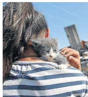
Una niña con un gatito ante una chabola derribada.