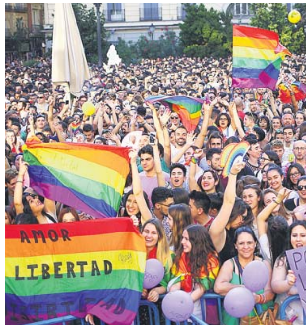
Imagen de archivo de una manifestación del Orgullo. MADO

Los organizadores alegan que Ciudadanos no ha firmado el decálogo que se exige a los partidos para participar en la protesta. Uno de los puntos del