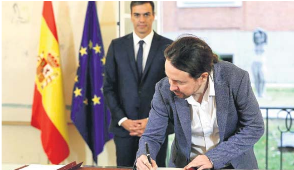
Iglesias y Sánchez, firmando su pacto presupuestario en la Moncloa, en octubre de 2018.

IGLESIAS insiste en que la entrada de Podemos en el Gobierno es la única forma de que Sánchez cumpla sus compromisos FIRMARON un acuerdo en 2018 pero hay medidas incumplidas, como el ingreso mínimo vital o derogar la Ley Mordaza LOS PRESUPUESTOS que Sánchez no logró aprobar incluían muchas de esas medidas