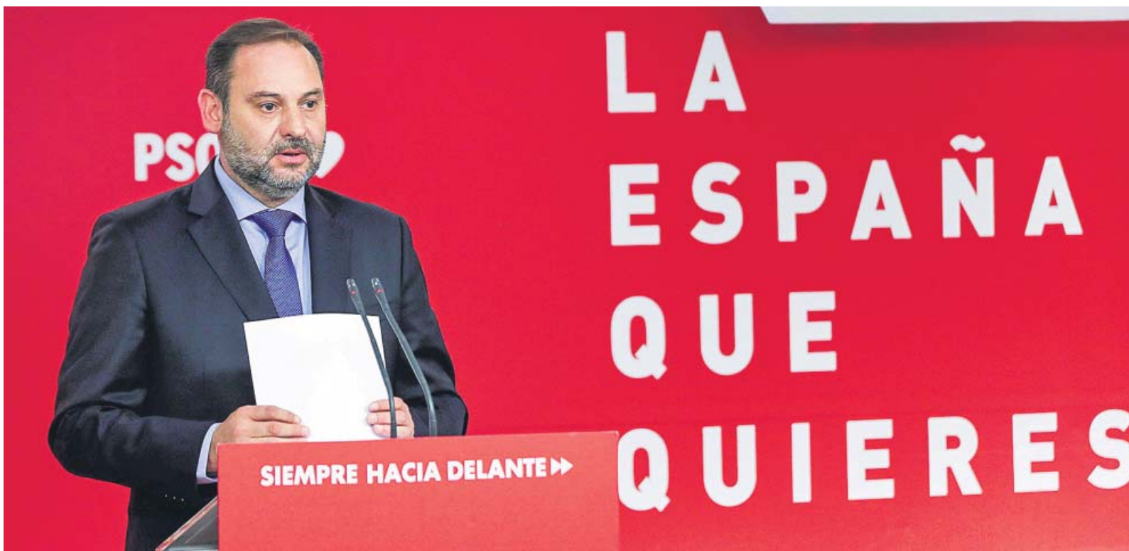
El secretario de Organización del PSOE, José Luis Ábalos, ayer en rueda de prensa en Ferraz para analizar la investidura de Pedro Sánchez.