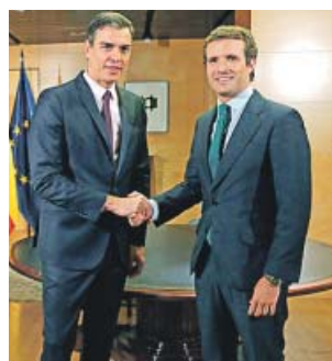
Sánchez y Pablo Casado, ayer en el Congreso.

«El PP no va a apoyar la investidura ni tampoco se va a abstenen en una segunda votación». La postura de Pablo Casado no ha cambiado ni un ápice y así se lo hizo saber ayer a Pedro Sánchez en su reunión. «Tenemos un mandato de los españoles para liderar la oposición», sostuvo. Su lejanía con el PSOE no le impidió pedir cierta celeridad en la formación del Ejecutivo, pero hizo un llamamiento: «Lo que ahora nosotros esperamos es que ese acuerdo se complete no con independentistas y sí con partidos regionalistas», dijo, en referencia a formaciones como UPN o Coalición Ca-