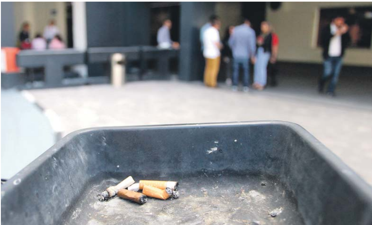
Un grupo de empleados, durante una pausa laboral en un centro de trabajo.