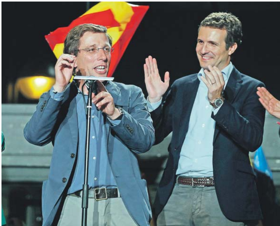
Pablo Casado aplaude a José Luis Martínez-Almeida en la noche electoral del 26-M.

EMILIO ORDIZ emilio.ordiz@20minutos.es / @EmilioOrdiz