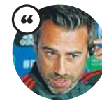
JORGE VILDA Seleccionador femenino español

«La decisión sobre el 11 la vamos a tomar esta noche. No es por no adelantarla sino porque ellas no lo saben»