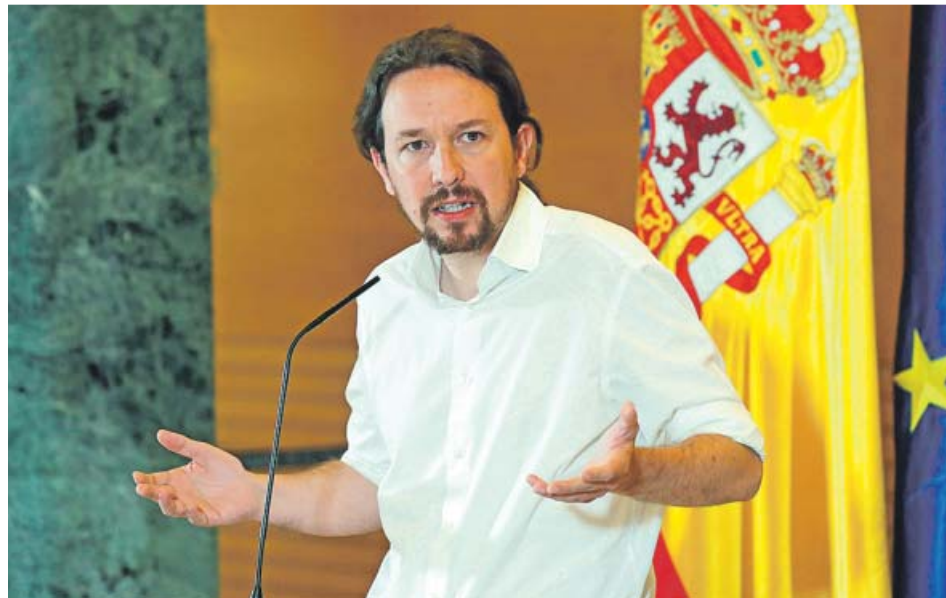
El líder de Unidas Podemos, Pablo Iglesias, tras su reunión con Pedro Sánchez.

Sánchez inició con Iglesias la ronda de contactos que ayer mantuvo también con los presidentes de Ciudadanos y del