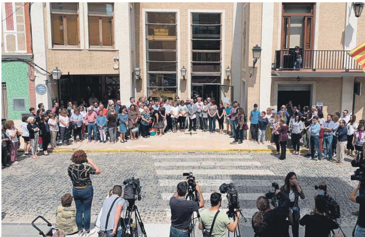
Vista general del ayuntamiento de Alboraya durante los tres minutos de silencio que se han guardado por el crimen.

La Comunidad Valenciana es la segunda región –junto a Andalucía y Madrid– donde más crímenes machistas se han cometido en 2019, solo por detrás de Canarias. Concretamente han sido cuatro las mujeres asesinadas por sus parejas o exparejas en la región. ●