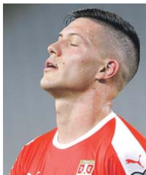
Jovic será presentado hoy por el Real Madrid.

Mientras, el Atlético se encuentra en stand-by, tanto en refuerzos como en posibles salidas. Oblak, Rodri y Costa siguen ocupando titulares para hacer las maletas, mientras el capítulo de llegadas de momento tiene su pilar central en la joya portuguesa Joao Félix.