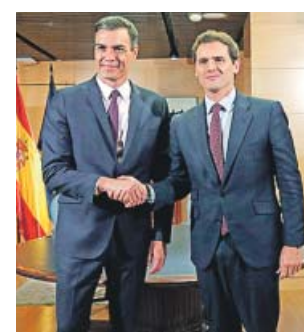
Pedro Sánchez y Albert Rivera, durante su reunión.

Ayer no se habló de nombres pero el PSOE está dispuesto a que entre los ministros haya independientes que puedan con-