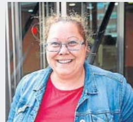
Virginia 40 años

«Me parece fatal que lo controle el Gobierno. Ya lo que nos faltaba. Yo trabajo de teleoperadora y para mis ojos un descanso, ya sea para fumar o no, me ayuda a mejorar el rendimiento. También depende del sector».