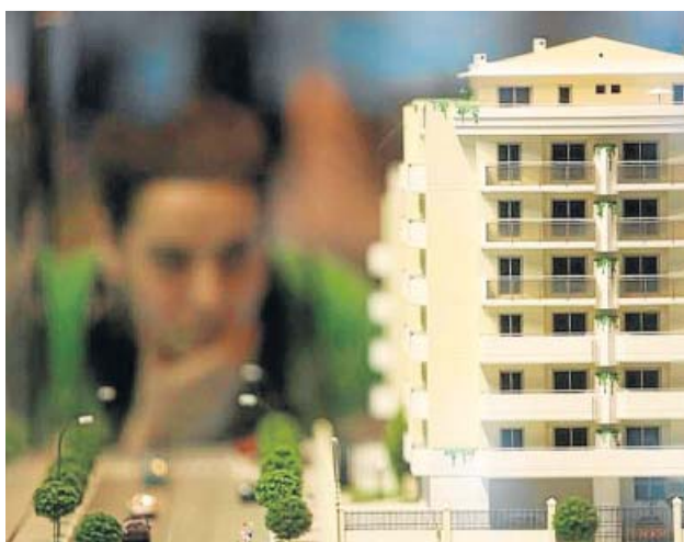
Un posible comprador mira la maqueta de un edificio. J. PARIS