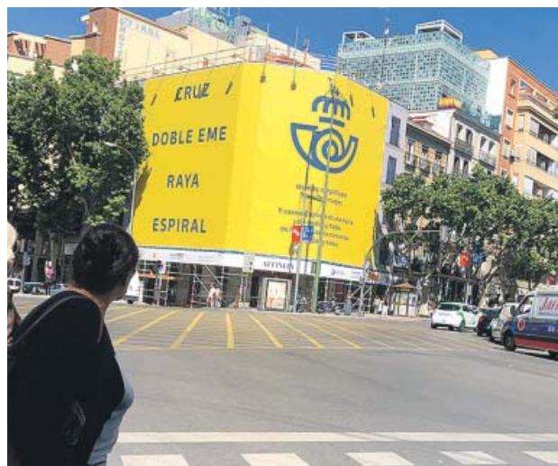
Un anuncio de la nueva imagen de Correos. FUJORGE PARIS

logístico de referencia internacional, y GFS, uno de los principales operadores en la zona, encargado de la recogida y envío de paquetes con origen en China. La creación de la nueva sociedad implicará aumentar el volumen de paquetería gestionado por Correos a través de la captación in situ de potenciales clientes, y mejorará los márgenes finales de distribución por mejor preparación, trazabilidad y predictibilidad de la deman-