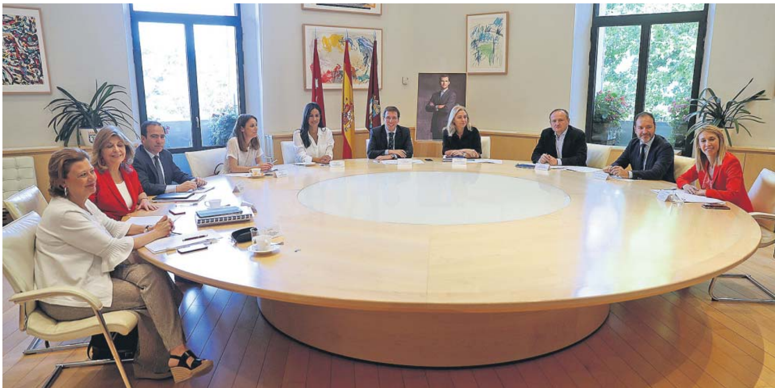
El nuevo Ejecutivo municipal, ayer, antes de su primera Junta de Gobierno en Cibeles. AYUNTAMIENTO DE MADRID