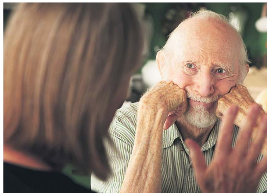
En España hay unos 800.000 afectados y al año se detectan 40.000 nuevos casos.