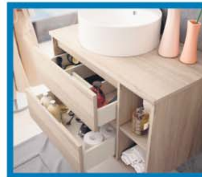
MUEBLES Y ESPEJOS