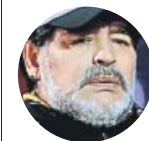
DIEGO MARADONA Tras la derrota argentina en la Copa América

«Te das cuenta que nos puede ganar Tonga. ¿Qué es la camiseta? La camiseta la sentís, la concha de tu madre»