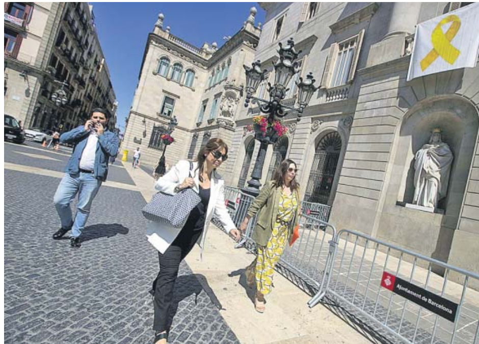
Los tres regidores de Cs pasan delante de la fachada del Ayuntamiento, con el lazo puesto.

El gobernador del Banco de España, Pablo Hernández de Cos, explicó ayer que la evaluación del impacto real de la subida del SMI no se conocerá hasta el verano de 2020, al carecer hasta esa fecha de los datos necesarios para su cálculo.