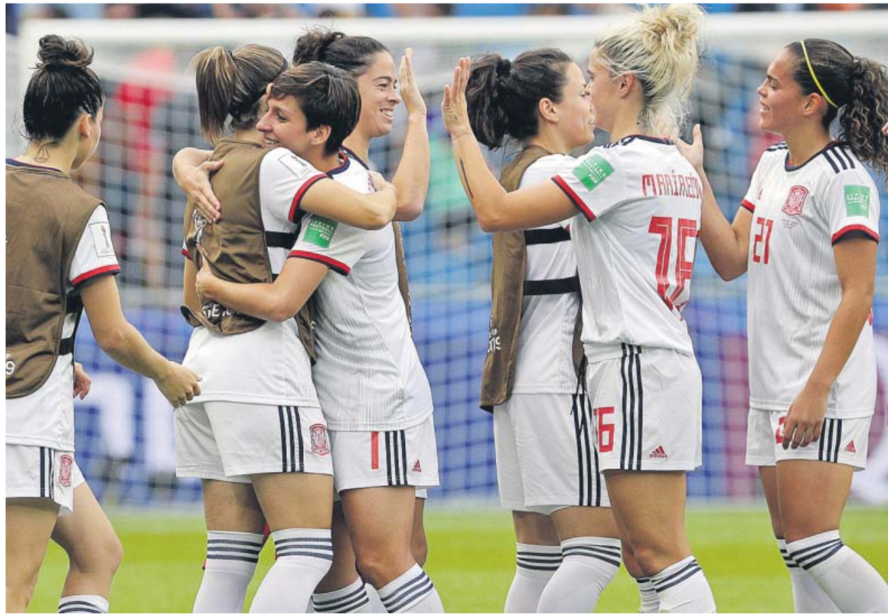
Las jugadoras españolas celebran su clasificación para los octavos de final del Mundial.

España empezó con mucho ritmo y dos maravillosos pa-