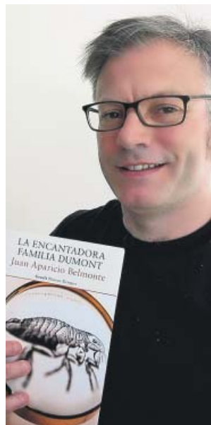
El autor, con su nueva novela en las manos. J.A.B.

Sobre el proceso creativo, el escritor asegura que «lo que hace uno como novelista es crear unos personajes y a la vez vivirlos como si fuera un actor, interpretándolos. Es una forma de