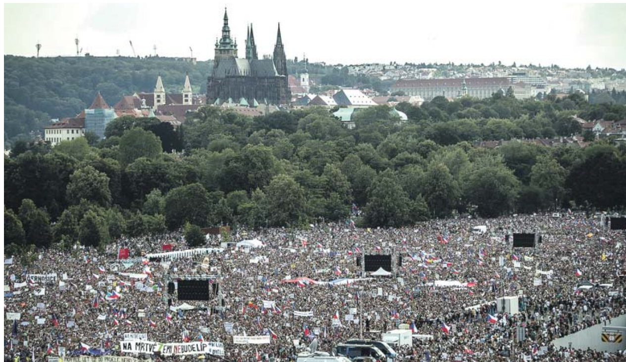
Decenas de miles de checos se manifestaron ayer en Praga contra el primer ministro.

Praga volvió a ser ayer escenario de una multitudinaria manifestación para exigir la dimisión del primer ministro checo, el populista Andrej Babis, acusado de conflicto de intereses y fraude con fondos europeos. Babis es empresario, lidera la Alianza de Ciudadanos Descontentos y gobierna en minoría con el apoyo tanto de la ultraderecha como del partido comunista. Ambos no le han retirado el apoyo ante la moción de censura de este miércoles, que no está previsto que prospere.● R.A.