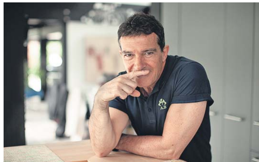
El actor Antonio Banderas o el futbolista Koke (imagen inferior) han participado en la campaña solidaria «Ningún niño sin bigote» impulsada por la Obra Social «La Caixa».

Dos años después del fuego, que afectó a un total de 10.340 hectáreas, en su mayor parte de titularidad pública, continúan los trabajos de reforestación en Doñana, mientras que la Junta de Andalucía ha ampliado los gastos de daños y extinción a 96,1 millones de euros.