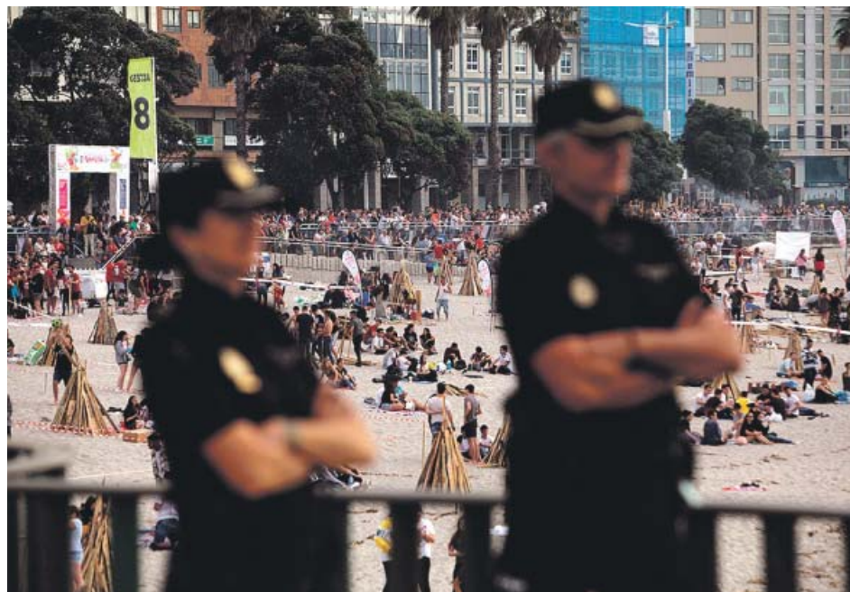
Miles de personas disfrutaron ayer del fuego a lo largo de toda la geografía española.

En cuanto a su prolongación, «es probable que las altas temperaturas persistan, al menos, hasta el domingo, día 30», pero la Aemet indica que «no se descarta que puedan prolongarse durante los primeros días de julio en algunas zonas». ● R. A.