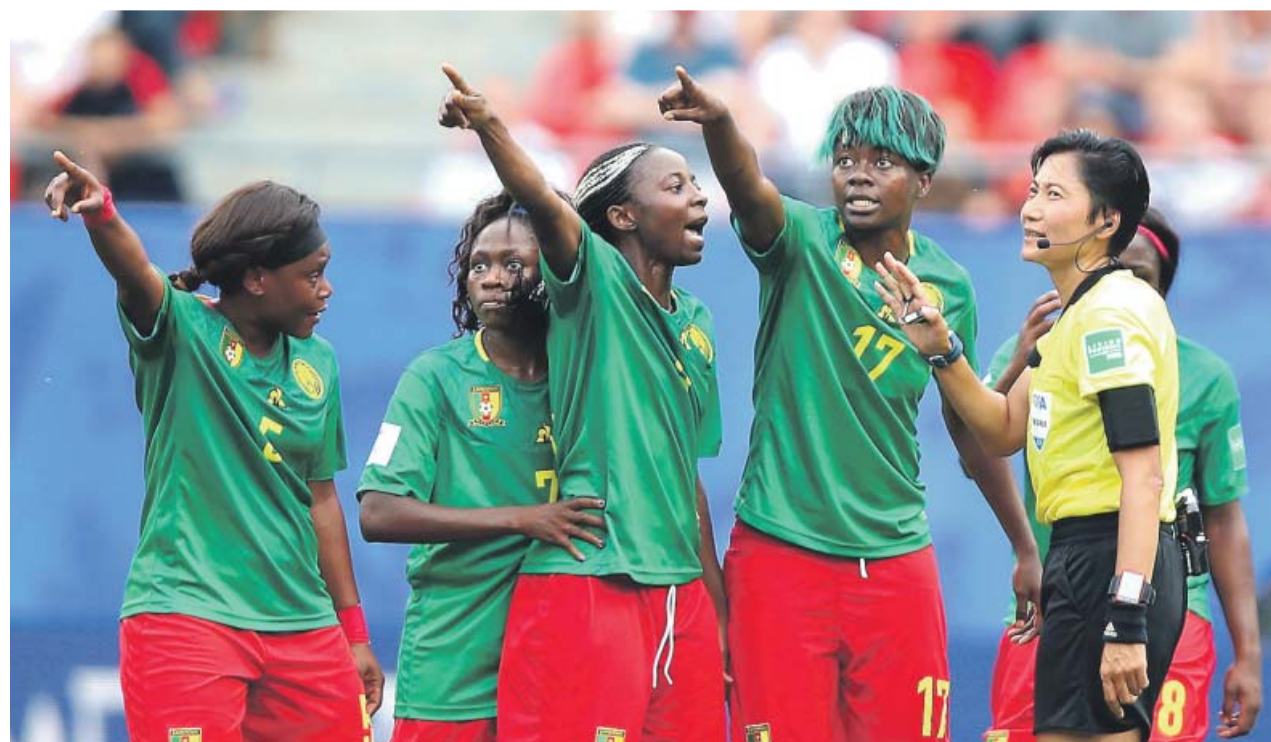
Las jugadoras de Camerún protestan a la árbitro en el partido contra la selección de Inglaterra.

El español Toni Bou sigue imparable en el Mundial de trial al aire libre, que ha ganado en doce ocasiones, y ayer logró su cuarta victoria (de cuatro) en el GP de los Países Bajos.