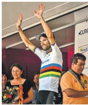
Valverde celebra la victoria en el podio.

La última victoria de etapa fue para el francés Arnaud Demare (Groupama FDJ),