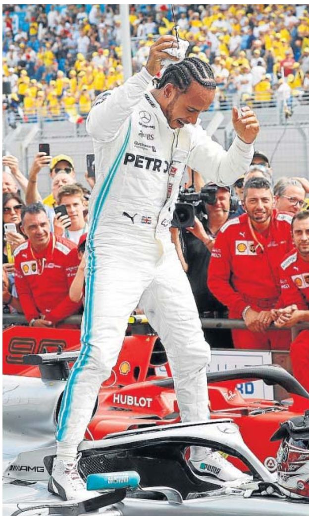
Lewis Hamilton celebra su victoria en Francia.

FERRARI Leclerc fue tercero y Vettel, quinto. El equipo italiano sigue muy lejos de Mercedes