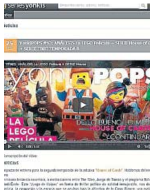
Captura de la web original de Series Yonkis.

La reforma del Código Penal de 2015 es la clave de todo, ya que introdujo en el artículo